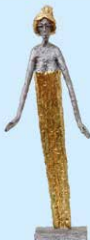
Olbram Zoubek: Hygie II vyvolávací cena: 90 000 Kč