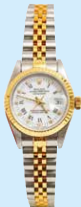
Rolex: Oyster Datejust vyvolávací cena: 50 000 Kč