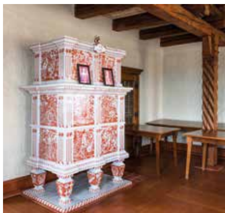
Fotoreportáž | Nový prohlídkový okruh vylíčí dějiny Špilberku

29 | Sport Běh Lužánkami se letos uskuteční naplno