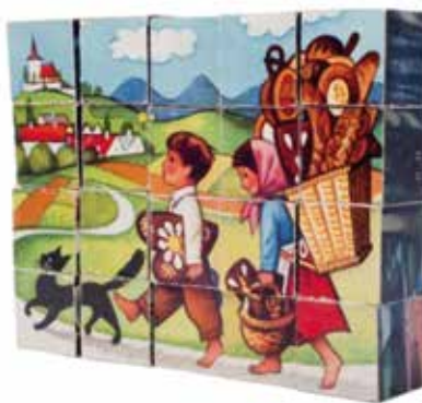
Kultura | U Mitrovských jsou k vidění československá nej

Vážení čtenáři, vážené čtenářky, v redakci nás těší, že nám voláte a píšete náměty na nová témata, komentáře k otištěným článkům i pochvaly či postesknutí nad děním v Brně. Kontakty najdete níže na této straně, v tiráži.