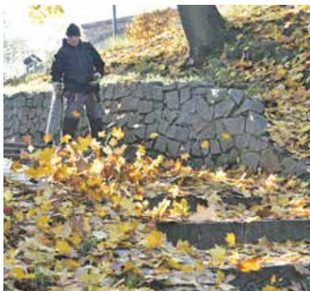
Fotoreportáž | Co se děje v parcích, než se uloží k zimnímu spánku?