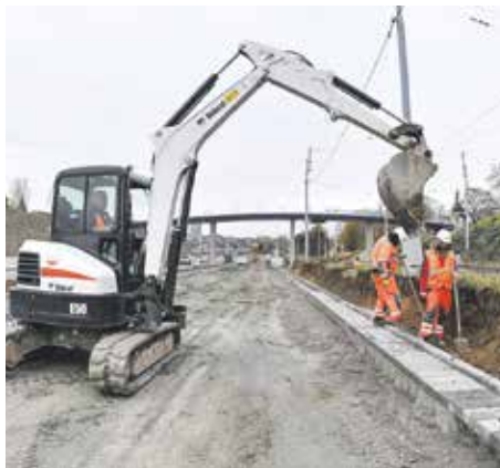
Magistrát informuje | Pokračuje stavba Velkého městského okruhu Žabovřeská

Běžkyně přešla na chůzi a po půl roce je mistryní republiky