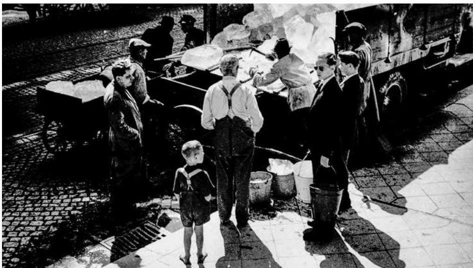
Prodej ledu v Brně v roce 1947.