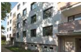
Bytový dům, Brno-Chrlice

Celé portfolio našich nemovitostí najdete na www.e-finance.eu .