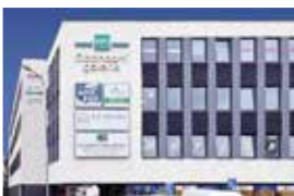
Obchodní galerie, Jihlava