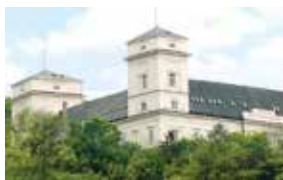
Zámek Račice, přestavba