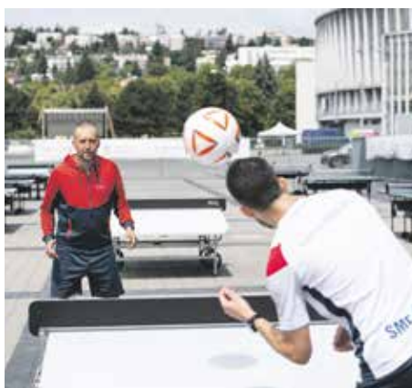
Sport | Děti nemusí v létě sedět doma. Zaspoutují si a zasoutěží

Vážené čtenářky, milí čtenáři, název jedné druhdy populární knihy tvrdí, že „ženy neumí číst v mapách“. Zjevnou nepravdivost této floskule dokazuje mimo jiné fakt, že v magistrátním oddělení, které se zabývá přípravou mapových podkladů a aplikací tvořících geografický informační systém, ve zkratce GIS, převažují ženy. Gisačky (a přirozeně i gisáci) svou prací žijí. A to už rovných 15 let, tak dlouho totiž geografický informační systém v Brně vzniká. Díky rozvoji digitálních technologií se před mapovými specialisty rozprostřel vějíř nových možností. Portál gis.brno.cz tak dnes kromě klasické mapy nabízí třeba přehled brněnských vodních toků nebo významných parků, slouží jako průvodce po Ústředním hřbitově, ukáže uzavírky i nádoby na tříděný odpad, poradí, kam zamířit k volbám, a prozradí, kam dopadaly spojenecké i sovětské bomby v letech 1944 a 1945. Více se dozvíte na našich stránkách – papírových, které nalistujete zhruba v půlce tohoto časopisu, i webových.