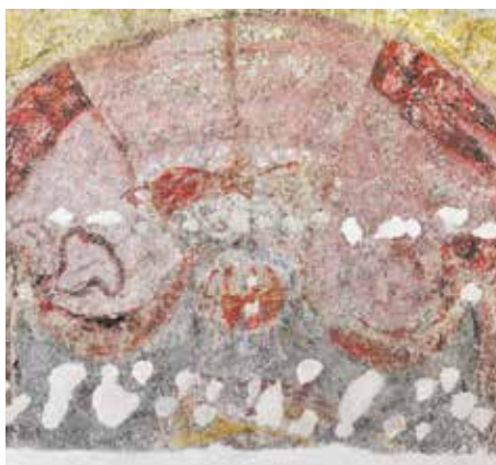
Magistrát informuje | Do sálu na Nové radnici se vrátí fresková výzdoba