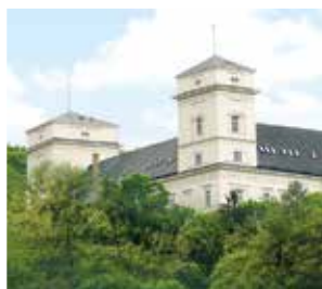
Zámek Račice, přestavba