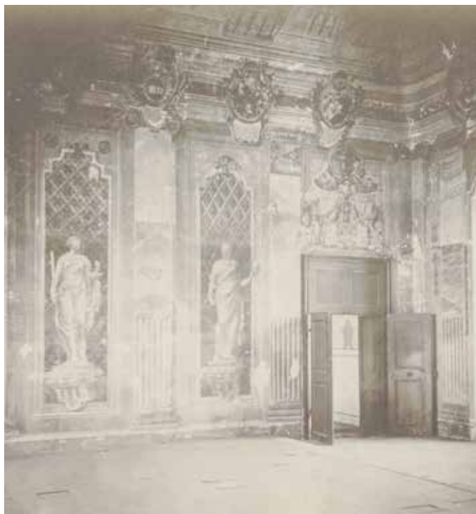
Stav zasedací místnosti královského tribunálu v 19. století před zalíčením fresek zachytil na fotografiích Mořic Trapp.