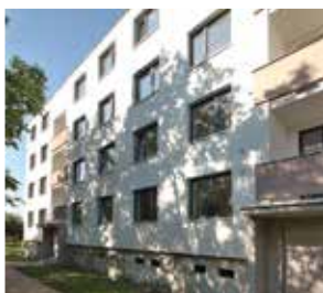
Bytový dům, Brno-Chrlice