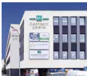
Obchodní galerie, Jihlava