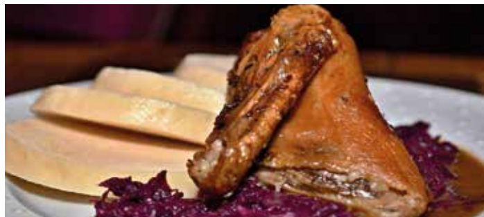
Čtvrťka pečené kačeny se zelím

V eFiShopu nabízíme také teplá jídla určená k okamžité spotřebě rozvážená v menu boxech, delikatesy a základní potraviny.