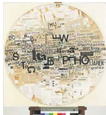
Jan Rajlich st.: Velký bílý kruh, reliéfní koláž na překližce, 98 × 98 × 2,1 cm, 1972.

„Výstava ukáže i méně známé oblasti Rajlichovy tvorby, jako jsou scénografie, výstavní design či umělecká díla ve veřejném prostoru.“