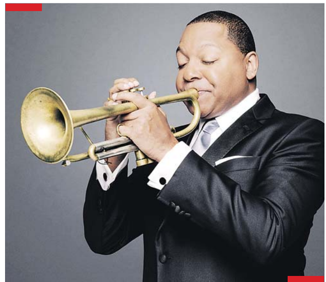
Wynton Marsalis a kapela Jazz at Lincoln Center Orchestra zahrají v Brně 1. února.