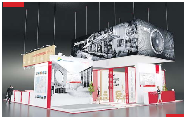
Stánek Brna připomene první republiku.

Snad každý má doma staré rodinné fotografie. Všechny přitom nesou nějaký příběh, nějakou vzpomínku. Nechte si od babiček, pradědečků, strýců a prarodičů vyprávět rodinné události a příběhy, které se k fotkám vážou. Ty pak můžete spolu se snímky nahrát na web Národní kroniky, nebo osobně přinést a odvyprávět právě na stánek Brna na veletrhu. Vznikne tak jedinečná databáze osobních vzpomínek – skutečná historie plná lidských příběhů. Více informací na www.tinyurl.com/pribehyfotek .