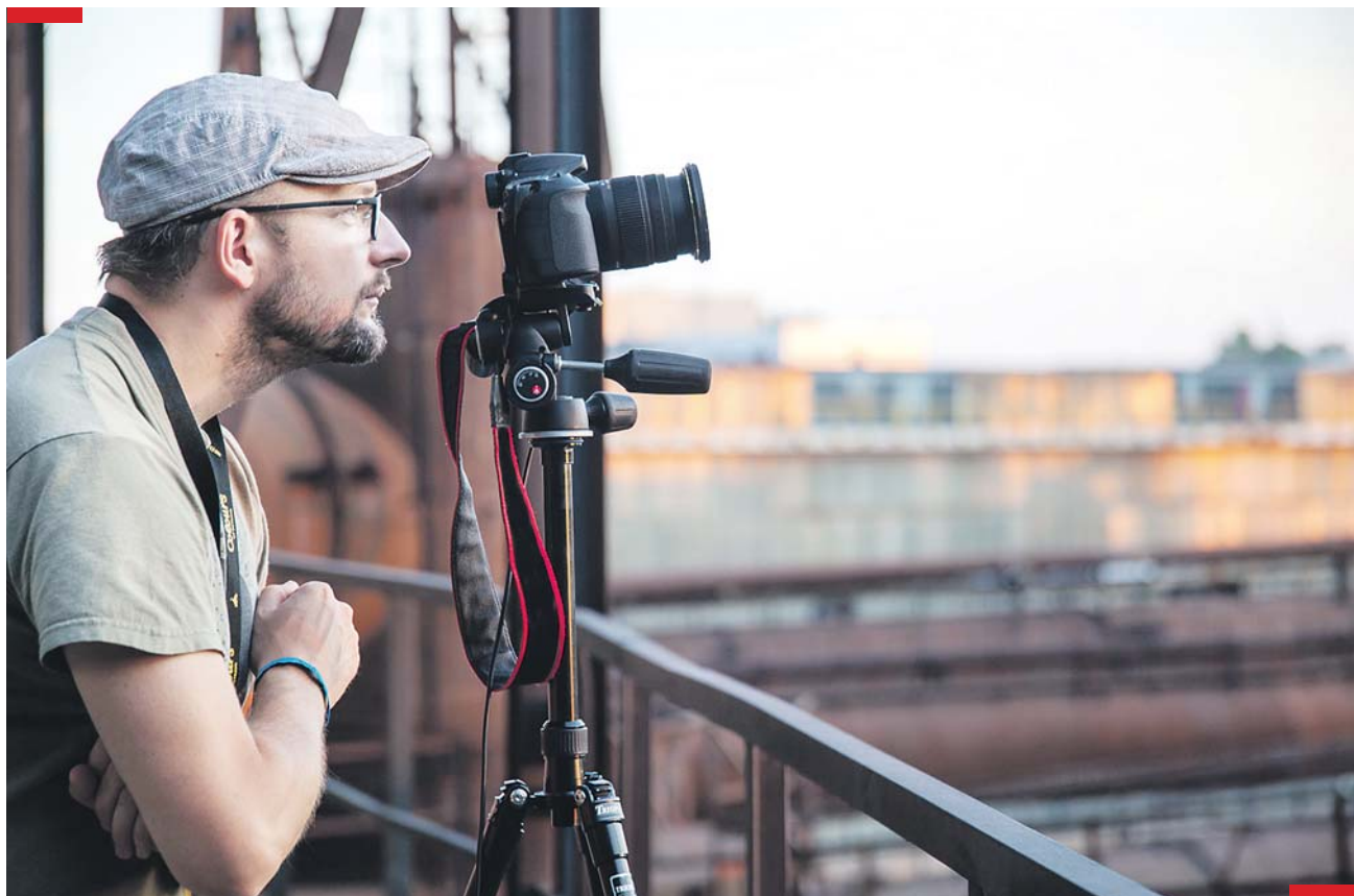
Brněnský fotograf své snímky téměř každý den zveřejňuje i na Facebooku Neuvěřitelné Brno.

si všímají, že na mých záběrech je – z výše zmíněného důvodu – často Kraví hora nebo její okolí.