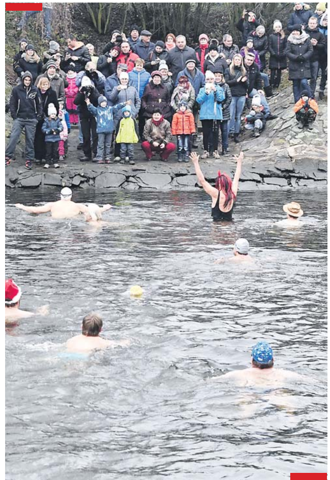
6x foto: M. Schmerková