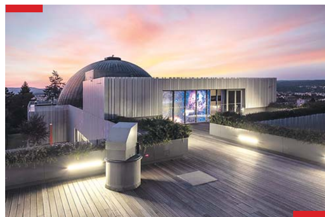
Snímky Pavla Gabzdyla často zachycují „obyčejnou“ krásu Brna.

Mnohdy se to prolíná, protože například focení Brna pro mě začalo tady na hvězdárně, když jsem připravoval představení Kde se vzalo Brno? a pak Neuvěřitelné Brno. Dodnes obvykle fotografuji při cestě do nebo z práce, protože volného času mám málo. I lidé