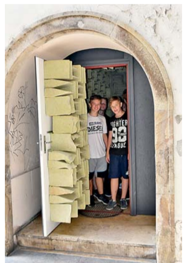
▲ Poustevna ve městě. V průchodu za Domem pánů z Kunštátu je možné spočinout v „odhlučněné kapse“ Jána Gašparoviče a pochytat si vlastní myšlenky.