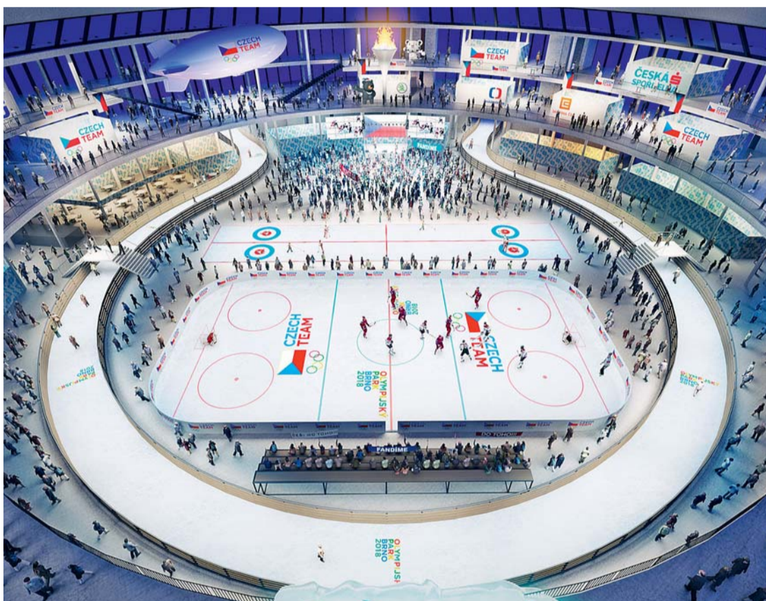
▣ Olympiáda na výstavišti. V době konání ZOH Pchjongčchang 2018 připravuje město a Jihomoravský kraj ve spolupráci s Českým olympijským výborem zajímavý koncept: dění bude koncentrováno do areálu BVV Veletrhy Brno. Olympijský park v Brně nabídne na ploše pavilonu Z s kruhovým půdorysem například hokejové hřiště a curlingové dráhy, další sportoviště obklopi prostranství kolem pavilonu. Akce v Brně naváže na úspěšné projekty z minulých olympiád: v roce 2014 při olympiádě v Soči podobnou akci na Letně v Praze navštívilo 409 tisíc návštěvníků. V roce 2016 při LOH v Rio byl hlavní olympijský park na Lipně (341 tisíc návštěvníků, 47 sportů) a vedlejší v Ostravě, Plzni a Pardubicích. Brno se díky projektu bude prezentovat také v zahraničí. (LUK)