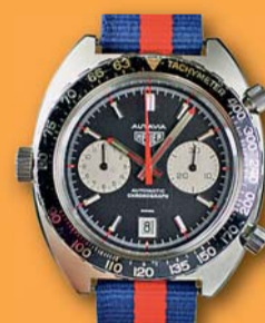
25 000 Kč a víc

VYKUPUJEME MECHANICKÉ NÁRAMKOVÉ A KAPESNÍ HODINKY, MINCE, BANKOVKY, ODZNAKY, MEDAILE, VYZNAMENÁNÍ VOJENSKÉ DEKRETY, ZBRANĚ, STARÉ POGLEDNICE, DOKUMENTY, HRAČKY, FOTOAPARÁTY, ZLATO A STŘIBRO