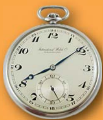
3000 Kč a víc