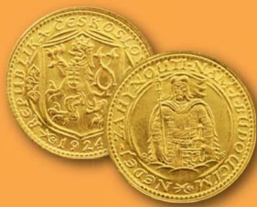
7000 Kč a víc