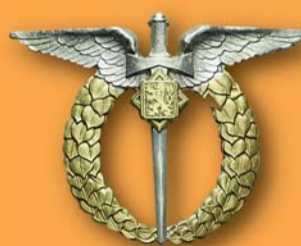
2000 Kč a víc