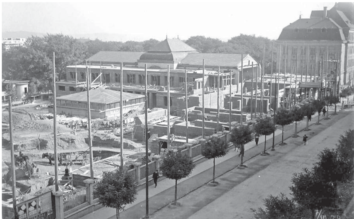
▲ Stavba. Celkový pohled na stavbu, 7. říjen 1928.

Původní stavební plány vypracoval architekt Jindřich Kumpošt, ale zakázku za něj nakonec převzal architekt Miloš Laml. Ten navrhl areál, kde prostor vlastní sokolovny s tělocvičnami a společenský prostor propojil jednopodlažní vstupní halou s mo-