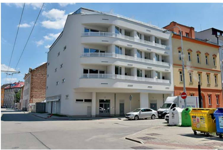
▣ Bezbariérový. Nový dům s pečovatelskou službou má vysoký standard. Ve společných prostorách je i klidová zóna.

V domě je třináct menších bytů 1+kk a devět bytů s dispozicí 2+kk. Každý