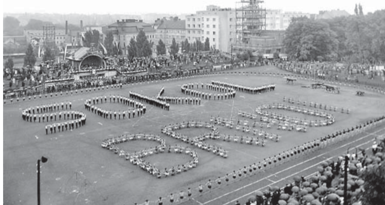
▲ Sokoli. Veřejné cvičení během slavnosti otevření Stadionu, 23. června 1929.