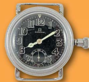
30 000 Kč a víc

SBĚRATELSKÝCH PŘEDMĚTŮ UVEDENÉ CENY GARANTUJEME – VYPLÁCÍME IHNED