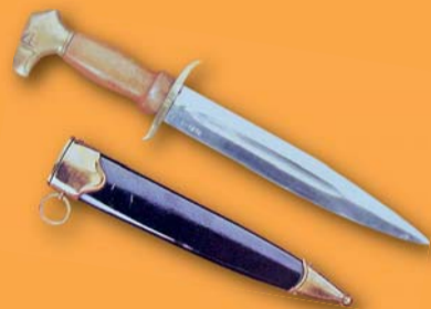
6000 Kč a víc