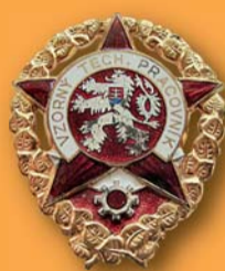
800 Kč a víc