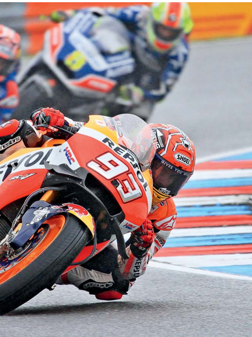
středok Moto GP. Pojede se 4. – 6. srpna. Více informací v článku na str. 1.