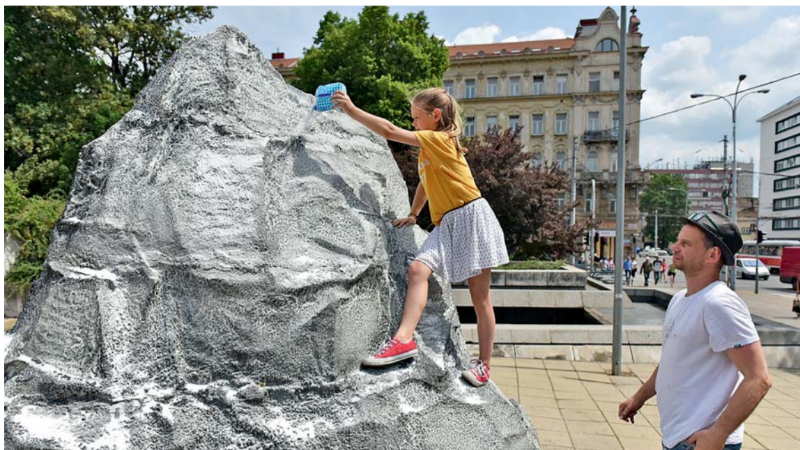
▲ Sněh v létě. Před Domem umění znepokojivě ční nepatřičná Kinterova hora zašlého, pozvolna odtávajícího sněhu. „Je to ‚kulišárna‘, protože právě v létě se taková hromada sněhu stala uměním,“ uvažuje autor. 4X FOTO: Z. KOLAŘÍK

Za sochami je možné se vydat s mapkou, která je zdarma k dispozici v Domě umění. Více informací lze získat na stránkách www.dum-umeni.cz . (MAK)