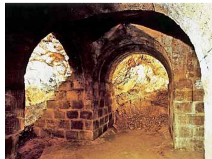
Křížení chodeb v protiletectkém krytu vybudovaném německou armádou na sklonku 2. světové války v masivu Kraví hory. Dnes se do něj vstupuje z ulice Úvoz.

Americké muzeum přírodní historie (The American Museum of Natural History) v New Yorku je jedno z největších a neznámějších muzeí na světě. Od roku 2000 je součástí muzea i moderní Haydenovo planetarium, které každý rok navštívuje zhruba milion diváků. Autorská představení Haydenova planetária se řadí mezi nejlepší na světě.