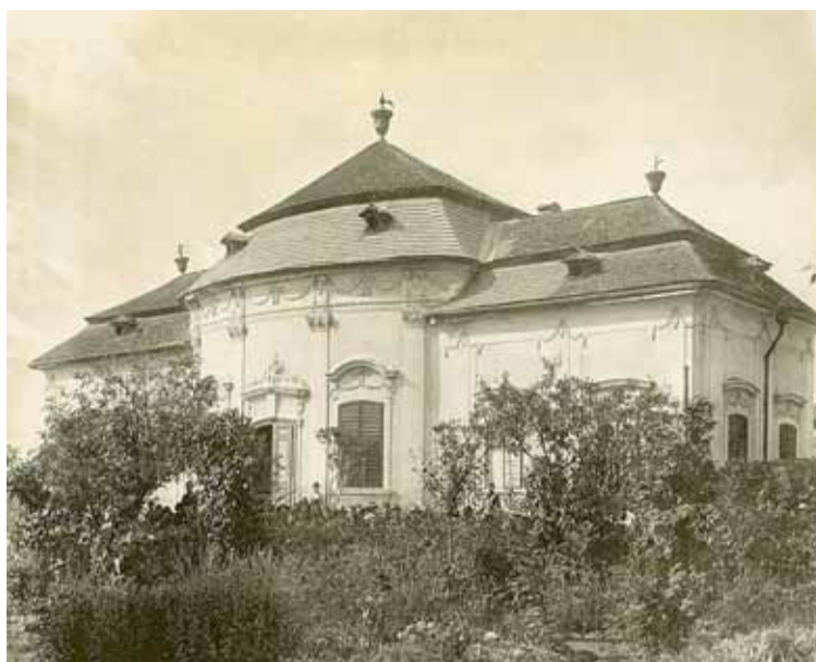
Letohrádek Mitrovských.

V roce 1814 Mitrovští letohrádek prodali, ten pak měnil majitele a v létě