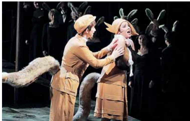
Příhody lišky Bystroušky bude na festivalu Janáček Brno vyprávět pražské Národní divadlo.

Letošní rok je v Brně nazván janáčkovským. 160. výročí Mistra narození připomene zejména festival Janáček Brno 2014 (od 21. do 30. listopadu). Národní divadlo Brno uvede premiérově operu Věc Makropulos, dále bude k vidění Její pastorkyňa, Výlety páně Broučkovy a Příhody lišky Bystroušky, Filharmonie Brno provede Sinfoniettu a další díla. Více najdete na webu janacek-brno.cz .