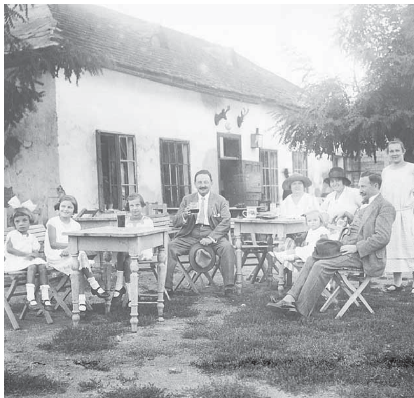
▲ Odpolední idylka na zahrádce hostince v tehdejší ulici Dr. Macků 88, dnes Údolní a steakhouse.

• 14. října 2014 bude v Urban centru na Staré radnici zahájena volně přístupná výstava zaměřená na historii hvězdárny.