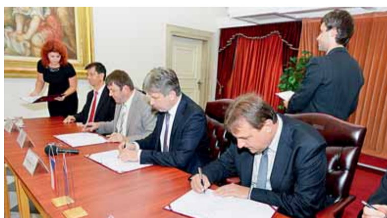
Brněnský primátor a starostové a místostarosta Šlapanic, Kuřimí, Rosic, Židlochovic a Slavkova u Brna podepsali 15. září memorandum o spolupráci.

Agglomerace nebo takzvané metropolitní oblasti jsou chápány jako národní póly růstu a nositelé konkurenceschopnosti se zásadním významem pro rozvoj celé České republiky. K financování společných projektů pro udržitelný rozvoj těchto oblastí je možné využít nástroj integrovaných územních investic (ITI).