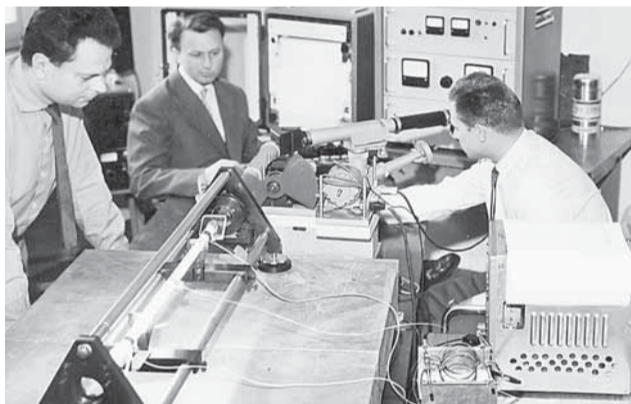
▲ První československý plynový laser z roku 1963 se svými konstruktéry, brněnskými vědci.

Laser od svého zrodu prošel obrovským vývojem, ať už jde o nové typy laserů, nebo šíři jejich využití. Existuje bezpočet oblastí pro aplikaci laserů a s jejich příklady se všichni denně setkáváme: CD přehrávače, tiskárny, odstraňování zubního kamene, laserové operace, navigační systémy... K úspěšnému uvedení technologií vznikajících na vědecké půdě je však zapotřebí spolupráce s komerční sférou. Ambicí svést dohromady plejádu expertů na lasery, jak z akademie, tak z firemního prostředí, má nadcházející konference LASER 54, která se koná od 29. do 31. října v zámečném hotelu Třešť. Vidět práci s lasery na vlastní oči s profesionálním výkladem nebo se pobavit nad představením Úžasného divadla fyziky pak bude navíc možné během dnů otevřených dveří ÚPT 13. a 14. listopadu.