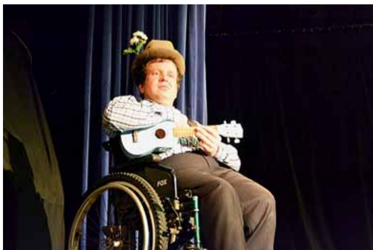
▲ Divadlo Jára Pokojského.

Důležitým cílem festivalu je ukázat dalším spolkům a souborům, že Barka se může stát i jejich domovem. Divadlo se dá pronajmout za velmi příznivých podmínek. „Vystupují zde děti, senioři, poloamatérské soubory, konají se tu přednášky, besedy atd.,“ vypočítává Vlachovská.