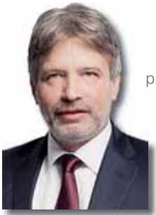
ROMAN ONDERKA primátor města Brna (ČSSD)