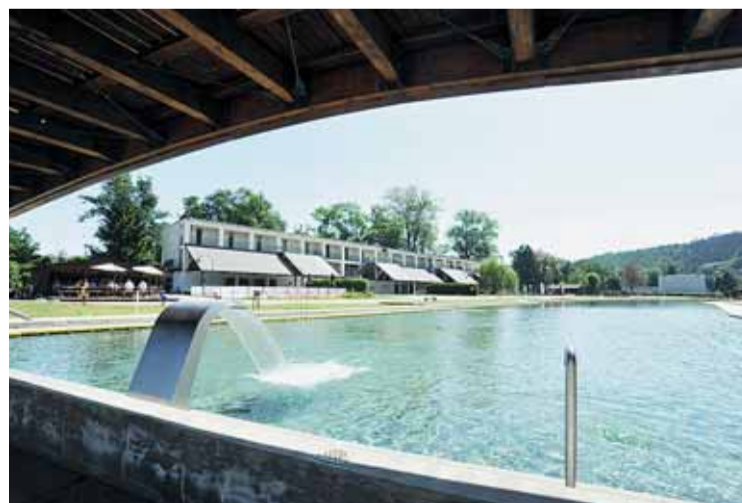
▲ Snazší vstup. Zaplatit na pokladně Riviéry a dalších pěti brněnských sportovištích lze jedním čipem.

Mezi hodnotícími kritérii byla například kvalita informačního systému (orientační tabule a směrovky, ceníky, návštěvní řády), nabídka služeb pro zákazníky i zaměstnance, akce pořádané v prostorách areálu (např. soutěže pro handicapované), hygienic-