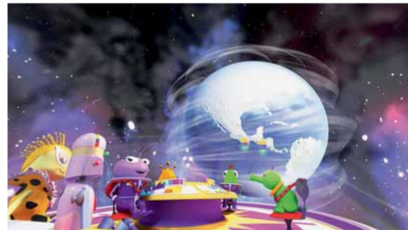
Zula hlídka: Dobrodružství v čase.

A konečně, „Úsvit kosmického věku“ zve na výpravu do historie kosmonautiky diváky od 12 let (premiéru bude mít v listopadu). Lidé po celá staletí snili o cestách do vesmíru... a po celá staletí se nic nezměnilo. Vždy zůstalo pouze u snění. Teprve v polovině minulého století bylo najednou možné uvést troufalé představy ve skutečnost. Diváci půjdou ve šlápěch konstrukterů prvních umělých družic Země, zažijí výpravu prvního člověka do vesmíru. Budou sledovat první pozemšťany, kteří se procházeli po Měsíci, a vydají se i na Mars, Venuši nebo až na kraj sluneční soustavy.