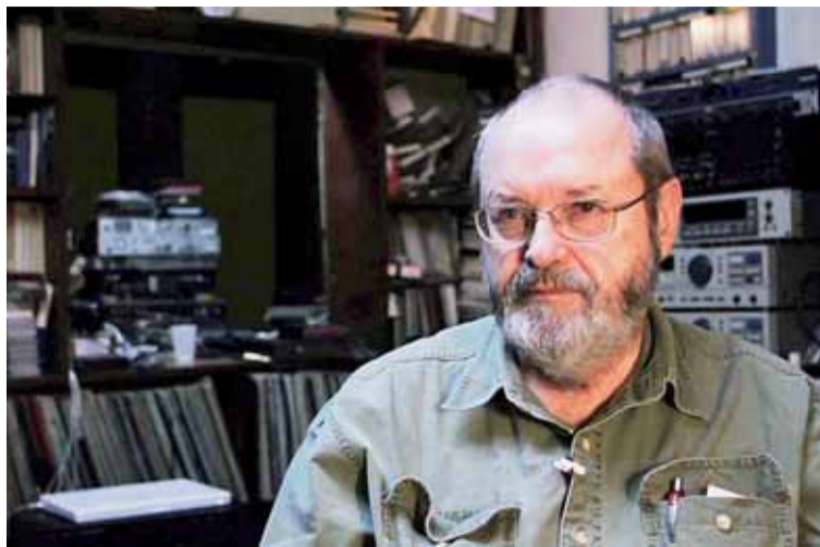
Hostem zahajovacího koncertu bude americký skladatel Phill Niblock.

„Těším se na osobní setkání s Philem Niblockem, skladatelskou legendou zmiňovanou v kultovní knize Alexe Rosse Zbývá jen hluk, i na českou premiéru Cembalového koncertu jiné legendy, Philipa Glasse – to vše zazní na zahajovacím koncertě v Besedním domě,“