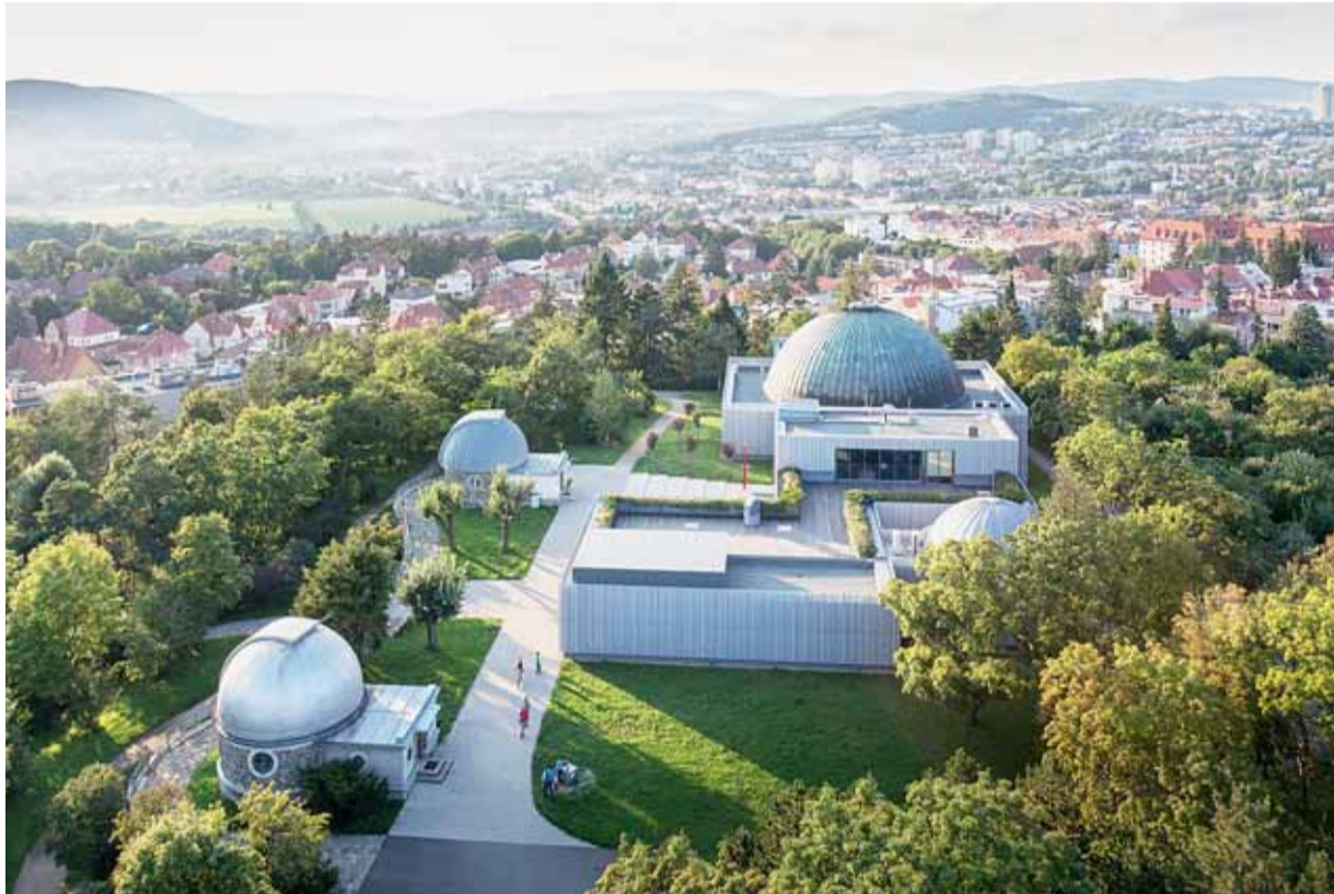
▲ Dechberoucí výhled na Brno i na oblohu. To je hvězdárna na Kraví hoře.

Pozůstatky válečné aktivity německé armády však lze najít dodnes: na samém vrcholku kopce hned vedle vodojemu se pod zemí skrývá trojice protiletectvých krytů a pozorovatelná s integrovaným krytem. Další protiletectvé kryty byly vyhloubeny v roce 1944 na temeni kopce se vstupem z Úvozu. Chodby o délce několika stovek metrů bývají příležitostně zpřístupňovány.