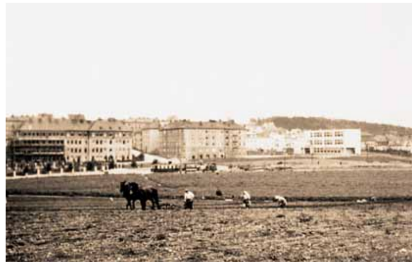
Konečná tramvaje číslo 4 na tehdejší Babákově náměstí (dnes náměstí Míru). V té době ještě nestál kostel sv. Augustina. V popředí oře rolník poličko v místě dnešního parku.

Dvoustranu zpracovalo Tiskové středisko MMB ve spolupráci s Hvězdárnou a planetáriem Brno