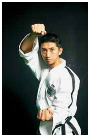
Hlavní hvězda Hwang Su II.

Akci navštíví také čínský mistr Hwang Su II, který proslul především ztvárně-