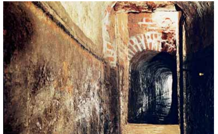
▲ Solniční ulice, odpadní a odvodňovací štola. O podzemí pod Českou a Solniční bude Aleš Svoboda mluvit 10. listopadu.

Více informací získáte na webové adrese www.gotobno.cz . Tento portál byl jako komplexní zdroj informací o Brně pro turisty, ale i pro míst-