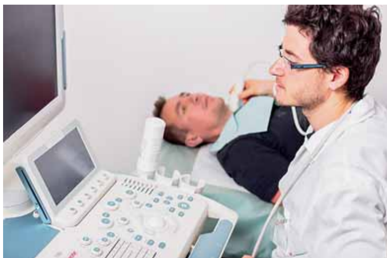
Ultrasvukové měření karotid čili krkavic, které jsou hlavním zdrojem okysličené krve pro mozek.

Vedoucími projektu jsou Ondřej Sochor z Fakultní nemocnice u sv. Anny