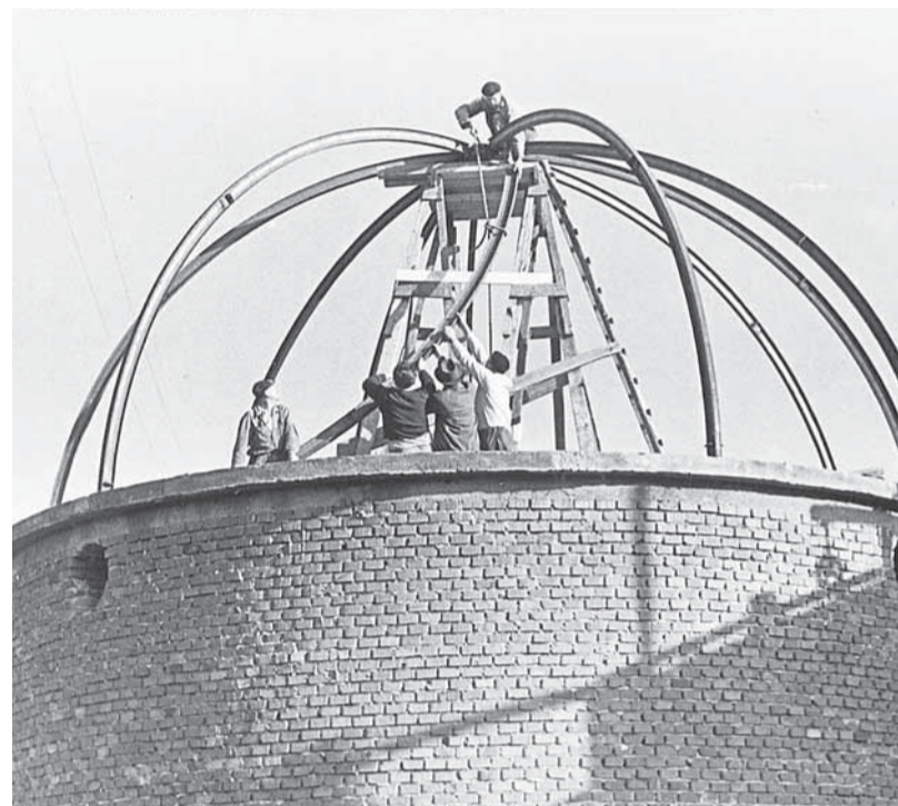
Stavba planetária, 80. léta 20. století.