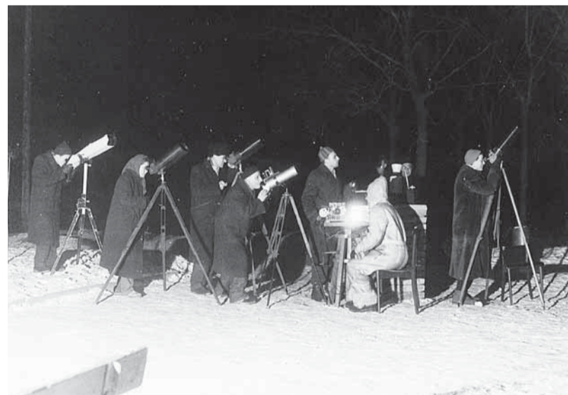
Pozorovatele díve hřál jen jejich zápal pro hvězdy.