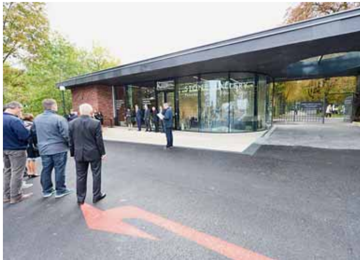
▲ Pavilon na Jihlavské je současně vstupem na hřbitov.

Od konce 20. let 20. století dotváří jeho prostor vedle konstruktivistické obřadní síně architektů Fuchse a Poláška také ceněné funkcionalistické Wiesnerovy