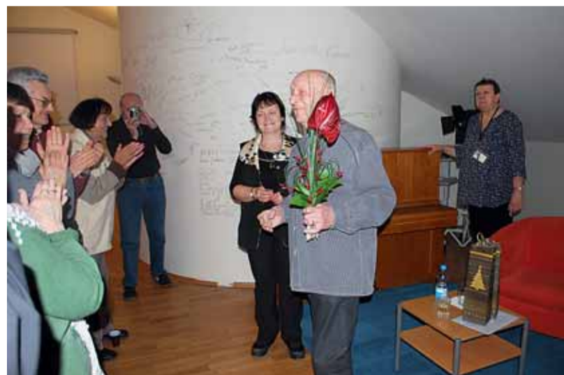
▣ Setkání s hercem Stanislavem Zindulkou v Knihovně Jiřího Mahena.

Nezapomíná ani na vzdělávací programy – uspořádal třeba návštěvu hvězdárny na Kraví hoře, přednášky o brněnském podzemí, se zdravotní tematikou či o bezpečnosti seniorů, velmi vítané byly počítačové kurzy.