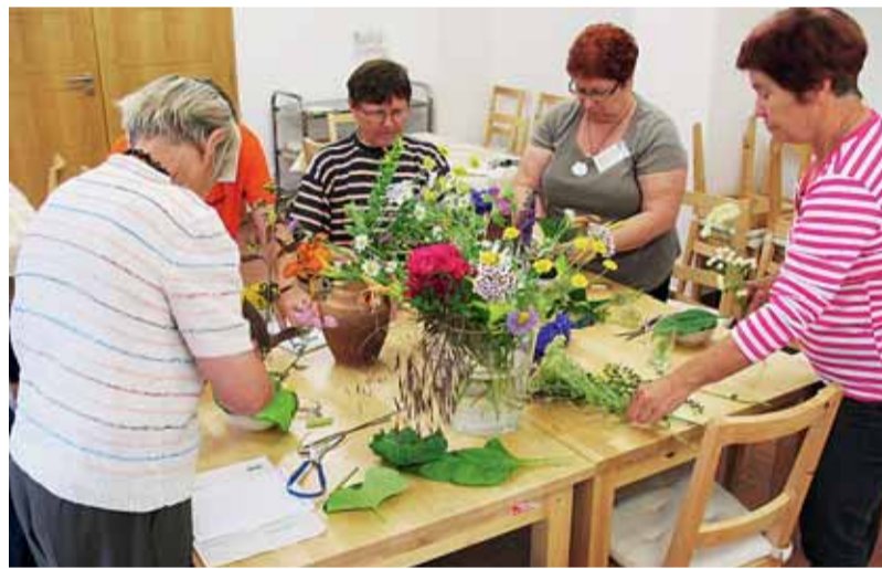
▣ Seniorky na táboře Lipky vytvořily krásné květinové vazby.

Návštěvníci tu naleznou například vyvýšené záhony, které jsou přístupné bez ohýbání, speciálně upravenou zahradnickou dílnu nebo místa pro relaxaci.