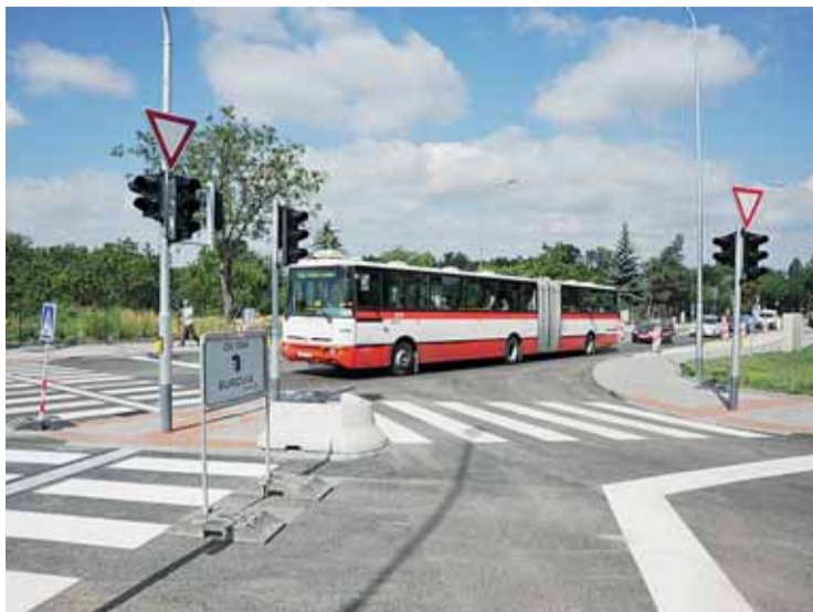
▶ Začátkem prázdnin byla zprovozněna křižovatka Kaštanová, nově osazená semaforem. Zjednodušil se tak výjezd z Holásek.

Nové koleje jsou také na ulici Palackého, pracovalo se i v Kníničské ulici, další