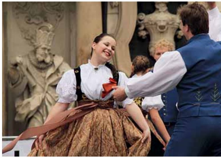
☛ Hlavní program Babylonfestu zahrnuje průvod, hudební a taneční vystoupení i ochutnávky jídel.

Poprve se sázelo předloni v parku na Špilberku, podruhé loni v Lužánkách a akce vzbudila ohlas. „Menšinám se nápad velice líbí, zájem dokonce projeví i lidé z jiných měst, že by chtěli mít v Brně svůj strom. Těm jsme ale bohužel nemohli vyhovět,“ popsal po-