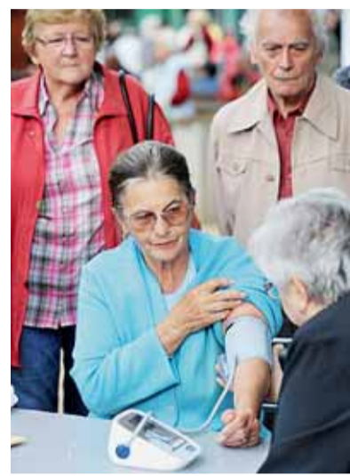
▣ Měření tlaku v rámci mezigeneračního odpoledne.

Další novinkou, připravovanou s podporou Jihomoravského kraje, je bezplatný