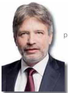
ROMAN ONDERKA primátor města Brna (ČSSD)