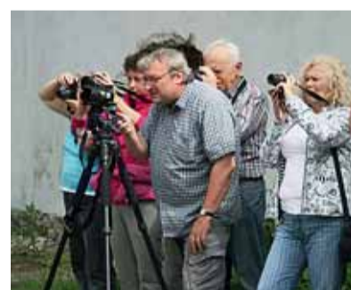
▣ Kurz digitální fotografie na U3V Masarykovy univerzity.

Více informací najdete na webu www.babickyabba.cz .