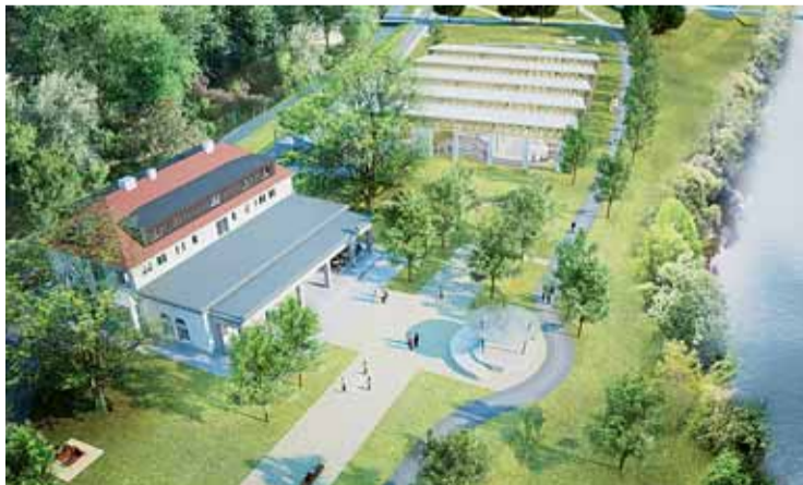
▶ Budoucí podoba Areálu dopravní výchovy na Riviéře.