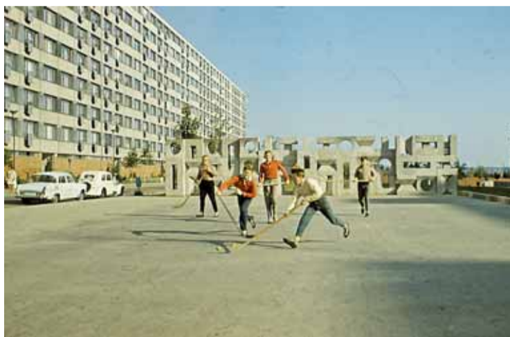
▲ Procházka povede i Lesnou. Jak vypadala kdysi a jak dnes? Panelový blok Arbesova a dekorativní zed Čestmíra Kafky (1969).