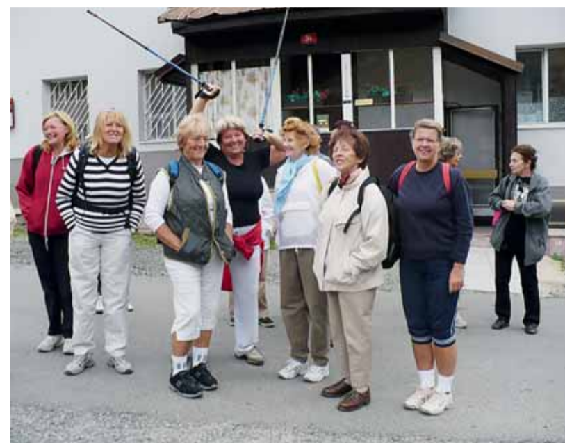
▣ Pobyt pro seniory.