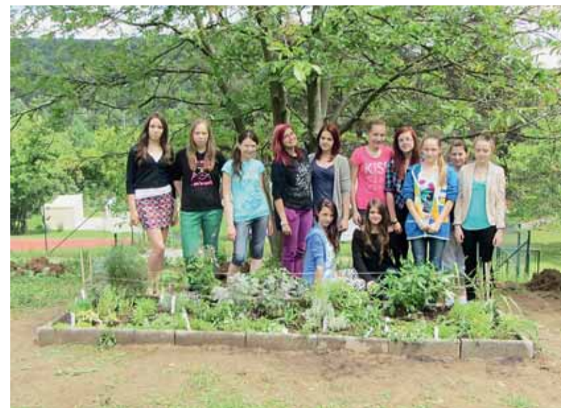
Bylinky do polévky? Žádný problém. Na ZŠ Heyrovského si je žáci (hlavně žáčky) pěstují na školních pozemcích.

Nejčastější volbou je spádová škola, tedy škola ve školském obvodu, v němž žák trvale bydlí, ale někdy rodiče dají přednost jiné škole. Přednost při přijetí mají logicky děti s místem trvalého bydliště v příslušném školském obvodu. Přehled spádových obvodů škol lze najít na stránkách www.brno.cz .