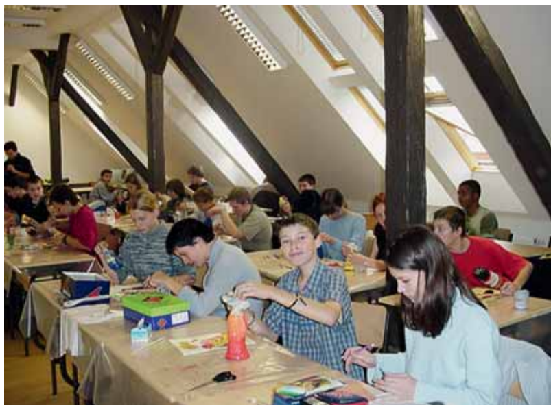
Výtvarný ateliér na Základní škole Sirotkova.

Letos se opět bude konat ve Středisku volného času Lužánky 21. a 22. listopadu, vždy od 14 do 18 hodin.