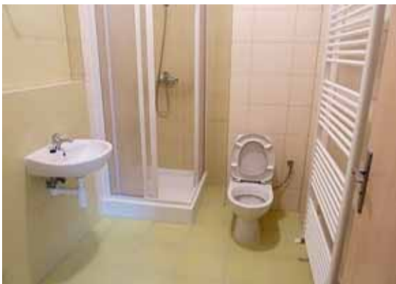
▲ Účelná a moderní klasika. Původní i nově budované byty jsou uspořádány i vybaveny standardně, v kuchyni nechybí nová kuchyňská linka se sporákem, každý byt má vlastní sociální zařízení.

Téměř v každém městě narazíme na „problémové“ lokality s neutěšeným prostředím, v nichž se hromadí sociální, společenské a ekonomické obtíže. Největší takové území v Brně, nazývané lidově Bronx, se nachází na rozhraní městských částí Brno-střed a Brno-sever. Díky projektu Integrovaný plán rozvoje města Brna v problémové obytné zóně, který byl zahájen v roce 2010, se zde situace začala měnit k lepšímu. Projekt financovaný z rozpočtu města, dotace Evropské unie a státního rozpočtu umožňuje regeneraci vybraných bytových domů, revitalizaci veřejných prostranství a realizaci pilotních projektů zaměřených na romskou komunitu. Z plánované úplné regenerace 11 starých obytných domů je již sedm objektů úspěšně opraveno (Spolková 3, Francouzská 20, 44, 64 a 68, Přadlácká 9, Bratislavská 62), práce na bytovém domě Bratislavská 60 právě probíhají, na Bratislavské 36a se s opravami začíná a regenerace domů na Bratislavské 39 a Francouzské 42 bude zahájena na jaře příštího roku.