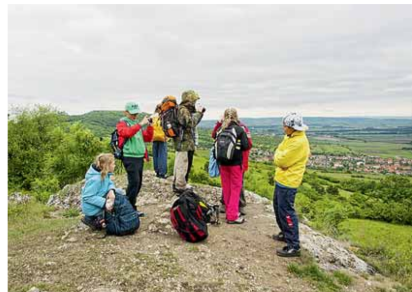
Na Pálavě bylo chladno a větrno, ale i tak to byl zážitek. Užili si ho žáci ze ZŠ Heyrovského.

žáky s pohybovým omezením, například ZŠ Novoměstská.