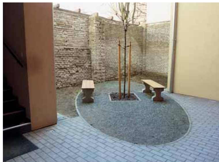
▲ Dům se probudil k životu. Z dlouhodobě neobydleného a zchátralého objektu na Francouzské 64 se zrodil pěkný bytový dům s dvoupodlažní nástavbou, v němž se nachází 12 bytů. V tomto poměrně malém objektu, do něhož se první nájemníci nastěhovali loni na jaře, nebyl kamerový systém instalován a funguje tu pouze domovník. Přesto se v domě dosud daří zachovat perfektní pořádek a čistotu.