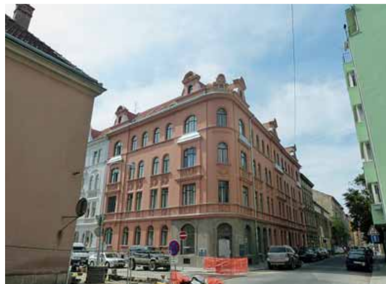
▲ Památka opět poutá pozornost. Zdobná fasáda kdysi předurčila dům na Bratislavské 62 k tomu, že byl zařazen do seznamu kulturních památek. Ani to ale nezabránilo poškození fasády výdychy z plynových „wawek“ a jejímu opadávání z důvodu naprosto zanedbané údržby. Rekonstrukční práce, které probíhaly v částečně obydleném domě, umožnily mimo jiné zrušit vytápění plynovými topidly a přispěly tak ke zdařilé obnově fasády i celého domu. Stavba byla zkolaudována v srpnu 2012 a najdeme zde opět byt domovníka i „oči“ kamer.

Fotostranu připravila Jitka Kalášková, Bytový odbor MMB, foto: MMB