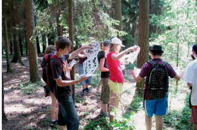
█ Děti ze ZŠ Hudcova se seznámily s lesním ekosystémem.