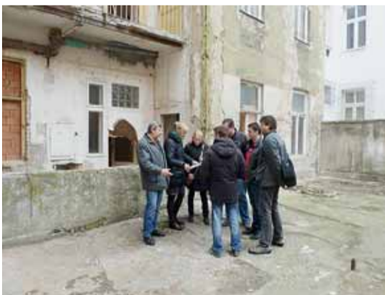
▲ Vrátili se do hezčího. V bytovém domě Přadlácká 9 se situace oproti původnímu stavu také výrazně změnila. Zmizelo 12 nekomfortních bytů, většinou bez vlastního sociálního zázemí, přibýly půdní vestavby a vzniklo tak 17 komfortních bytů. Od letošního února se domů mohla vrátit část původních nájemníků. I zde je zřízen kamerový systém a domovnícký byt.