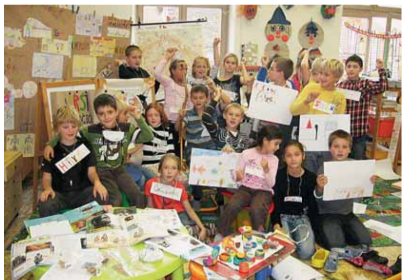
Probírali pravěk a pak ho nakreslili, vyrobili luk a šipky a jiné pranáštroje, z plastelíny tvarovali „keramiku“. Škola hrou na ZŠ a MŠ Husova.

mětu je umožnit žákům naučit se základní komunikaci v češtině v takové kvalitě, aby je bylo možné co nejdříve zařadit do běžných tříd podle jejich skutečného věku a odstranit tak jazykovou bariéru a tím předejít projevům netolerance a xenofo-