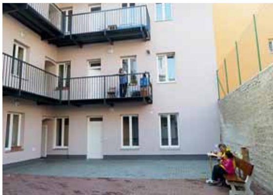
▲ Posedět si, pohrát si. Od loňského března byl k bydlení připraven dům na Francouzské 68, včetně nově vydlážděného dvora, který je využíván nájemníky k posezení a děti ke hrám.