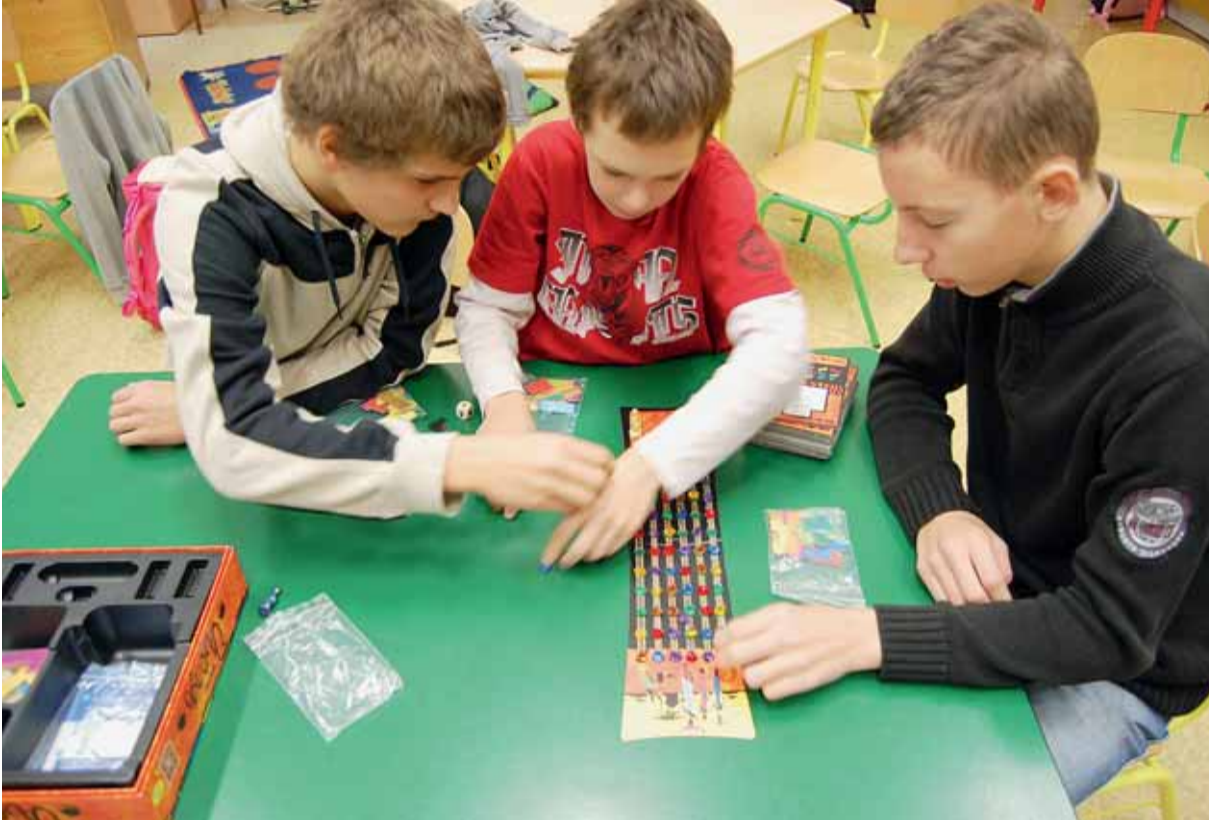
█ Každá škola zapojená do sítě brněnských otevřených škol má svůj klub deskových her. Takhle se hraje na ZŠ Antonínská.

Základní vzdělávání vyžaduje na 1. i 2. stupni podnětné a tvůrčí školní prostředí, které stimuluje nejspokojenější žáky, povzbuzuje méně nadané, chrání i podporuje žáky nejslabší a zajišťuje, aby se každé dítě vyvíjelo v souladu s vlastními předpo-