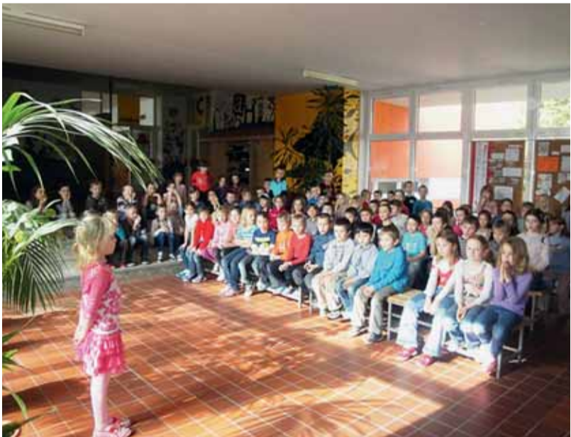
█ Děti ze ZŠ a MŠ Milénova absolvovaly soutěž v recitaci.

Při hodnocení žáků se speciálními vzdělávacími potřebami se přihlíží k povaze postižení nebo znevýhodnění. K základním školám, v nichž jsou kromě běžných tříd zřízeny třídy speciální pro žáky s poruchami učení, patří například ZŠ Bosonožská nebo ZŠ Horní. Kromě nich funguje v Brně 19 bezbariérových škol pro