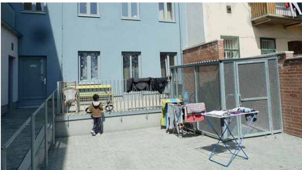
▲ I zničené lze změnit v komfortní. Již od února 2012 září novotou dům na Francouzské 44, který byl původně zcela zdevastovaný a dlouhodobě neobydlený. Z původních čtyř nekomfortních bytů vzniklo spolu s nástavbou domu celkem 12 nových bytů. I zde je vidět péče domovníka i nových nájemníků o udržení příjemného prostředí a čistoty.