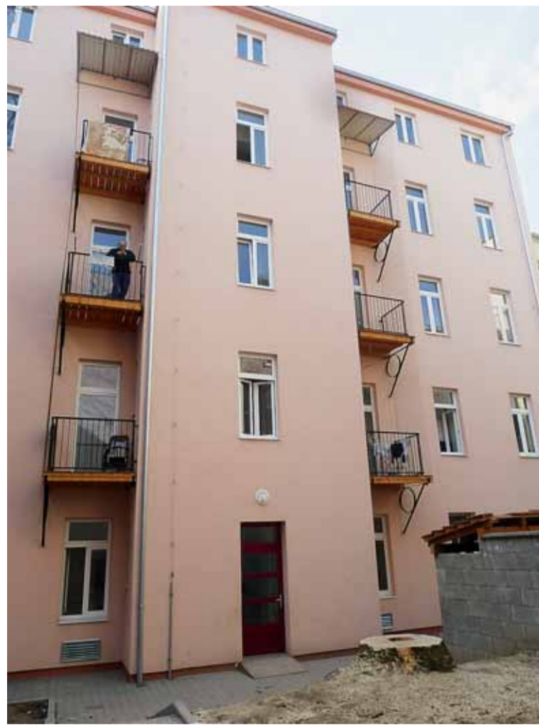
▲ Domovník a kamery bdí. První opravený bytový dům na Spolkové 3 slouží nájemníkům už dva roky. Ačkoliv zde bydlí převážně sociálně slabí a potenciálně problémoví nájemníci, ve společných prostorách domu i před ním je čisto a pořádek. Osvědčil se tak nově zřízený institut domovníka i nainstalovaný kamerový systém.