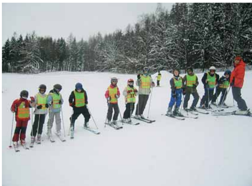
Seřadit se na kopci a pak jednotlivě, pravotočivě, levotočivě... až dolů. Na snímku lyžaři ze ZŠ Novolišeňská.

Dvojstranu připravil Odbor školství, mládeže a tělovýchovy MMB