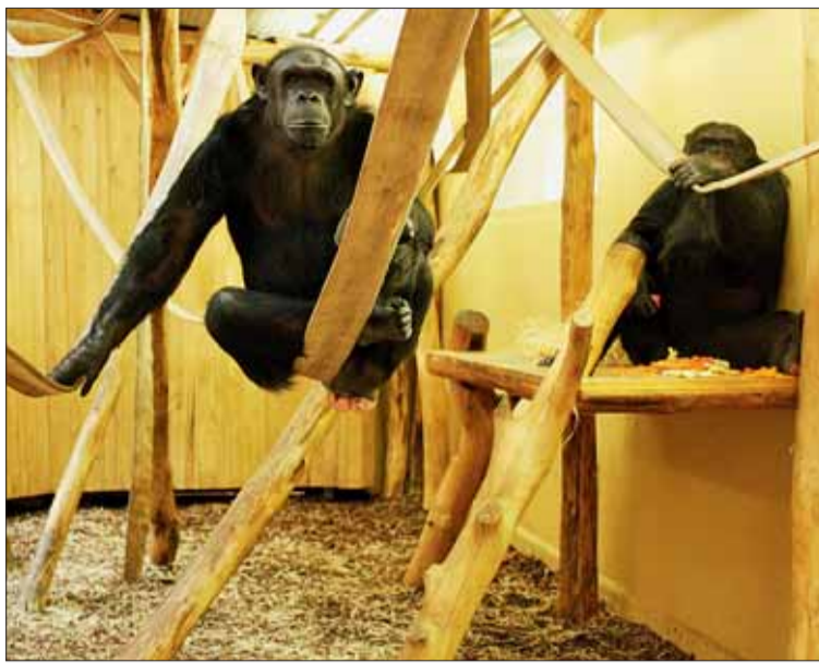
■ K šimpanzi Fábenu přibudou v těchto dnech dvě samice z Plzně.

„K současným chovatelským úspěchům Zoologické zahrady města Brna patří především odchovy čtyř ledních medvědů, narozených v roce 2007 a 2012,“ uvedl šéfredaktor časopisu Zooreport Eduard Stuchlík. „V oblasti stavebního vývoje bylo nejdůležitější poslední desetiletí, kdy zahrada zřídila několik velkých nových expozic výrazně měnících její tvář. Některé stavby získaly první místa v soutěžích občanského sdružení Česká zoo – v roce