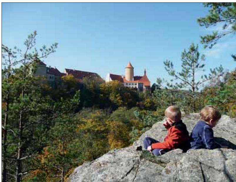
■ Hrad Veveří a Podkomorské lesy