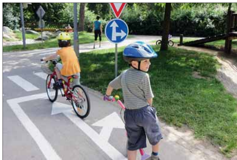
Děti se na hřišti např. naučí poznávat dopravní značky.