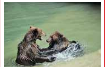
Zoo na Mniší hoře slaví 60 let