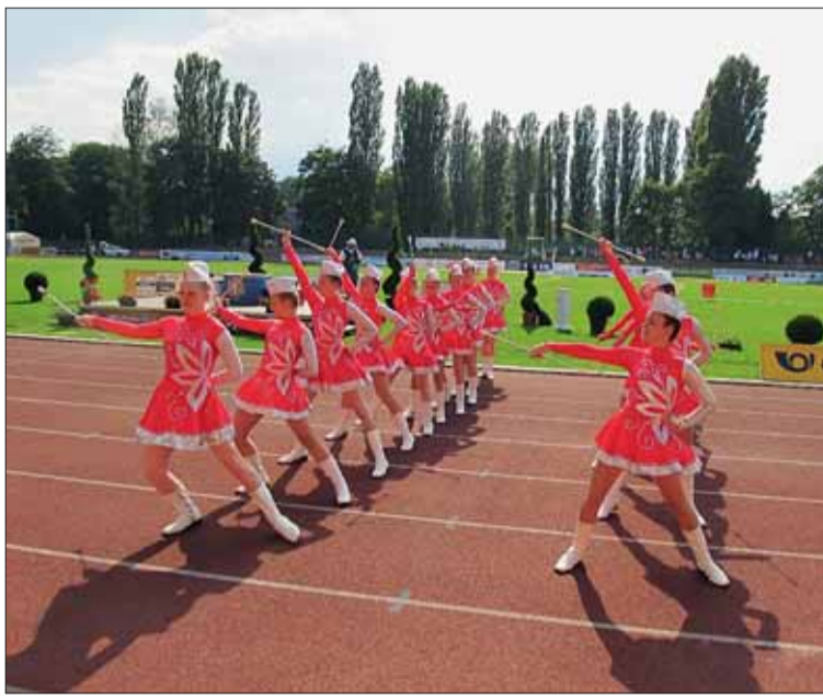
■ Tanec s batonem potěší oko diváka. A možná i poroty.

„I letos budou české mažoretky na evropském šampionátu bojovat o nejcennější kovy. Již od počátku této soutěže patří mezi evropskou špičku a udávají trend,“ uvedla k ambicím domácích závodnic prezidentka Asociace mažoretek ČR Dagmar Kubíčková.