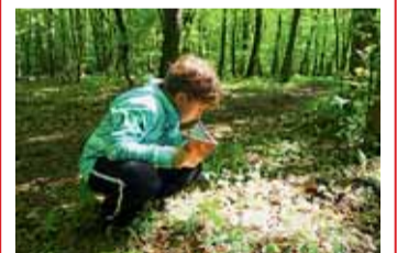
Zelené zajímavosti a toulky brněnskou přírodou