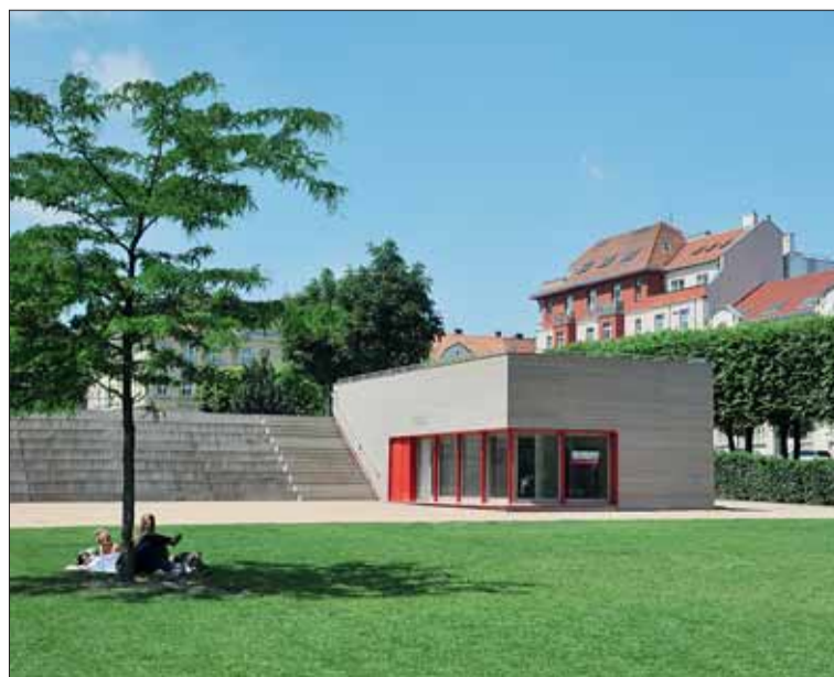
■ Espresso prosím? Park na Slovanském náměstí oživila kavárna.

Když se park na Slovanském náměstí na podzim roku 2006 otevíral veřejnosti po celkové rekonstrukci, hovořilo se o kavárně v prostoru pod vyhlídkovou terasou.