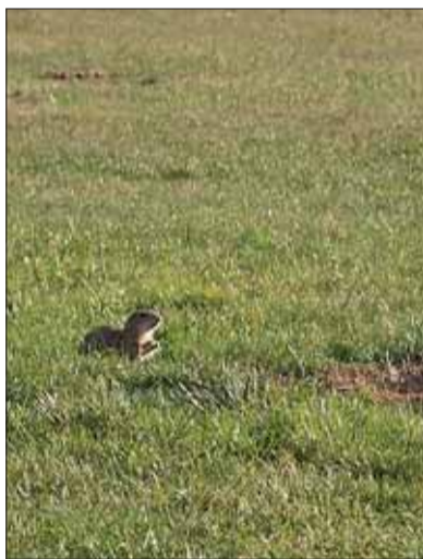
■ Sysel na medláneckém letišti

všudypřítomných lesních porostů). Plochy obhospodařované v minulosti pastvou a kosením jsou dnes charakterizovány vět-