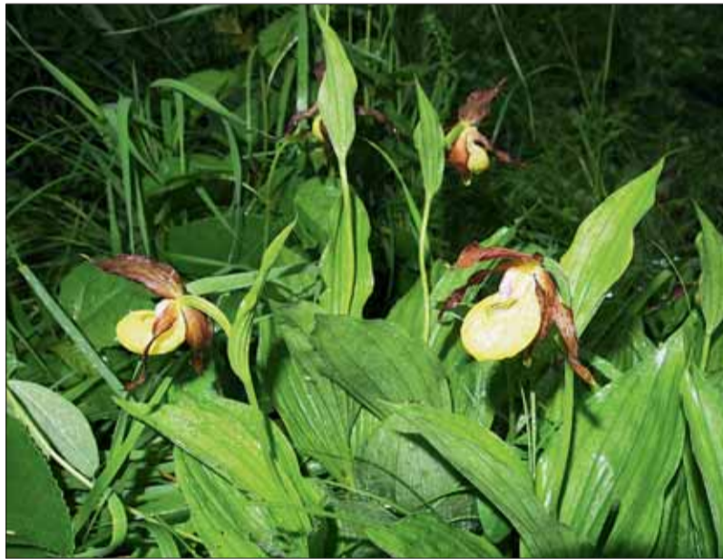
■ Střevíčník pantoflíček

Výborně dostupná lokalita u silnice z Bystřice do Žebětína (zastávka MHD Žebětínský rybník) je jedinečná zejména proto, že v okolí byl v letech 1999–2004 vybudován systém trvalých betonových zábran, které umožňují bezpečné putování dospělých žab do rybníka za rozmnožování a také malých žabek na jejich první cestě z rybníka (zábrany financovalo město ve spolupráci s Ministerstvem životního prostředí ČR). Dospělci se do rybníka vydávají většinou ve druhé polovině března a malé žabky z rybníka pak