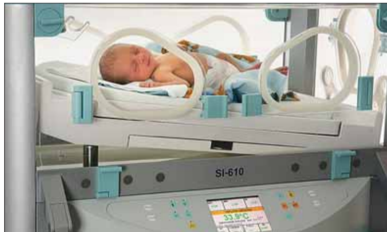
■ Firma TSE a VUT budou s podporou města pracovat na inovaci vyhřívaných lůžek pro novorozence.

Projekt podporuje jednoduchou a účinnou formou spolupráci podnikatelů a vědců. Firmy si podávají žádost na konkrétní výzkum provedený jednou ze 12 místních institucí. Pokud jsou vylosovány, obdrží na něj peníze. Ale i pokud nejsou, získají alespoň cenné kontakty na schopné vědce a výzkumníky se zase seznámí s potenciálními odběrateli svých technologií.