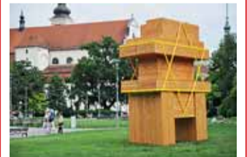
Sochy v ulicích diváka provedou 20. stoletím