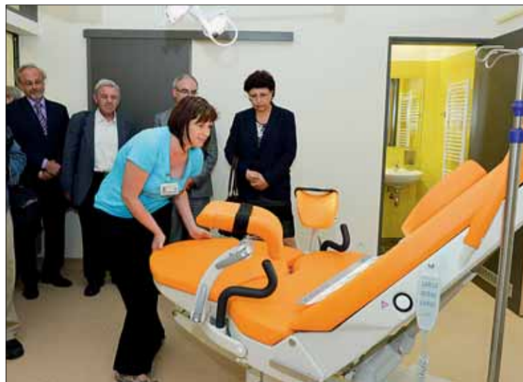
Nové porodní sály začnou klientkám porodnice sloužit už v červenci.

Pro rok 2013 nemocnice ve spolupráci s městem Brnem připravuje další část rekonstrukce, jejímž hlavním cílem je modernizovat hotelové zázemí pro pacien-