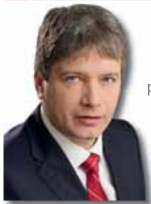
ROMAN ONDERKA primátor města Brna (ČSSD)