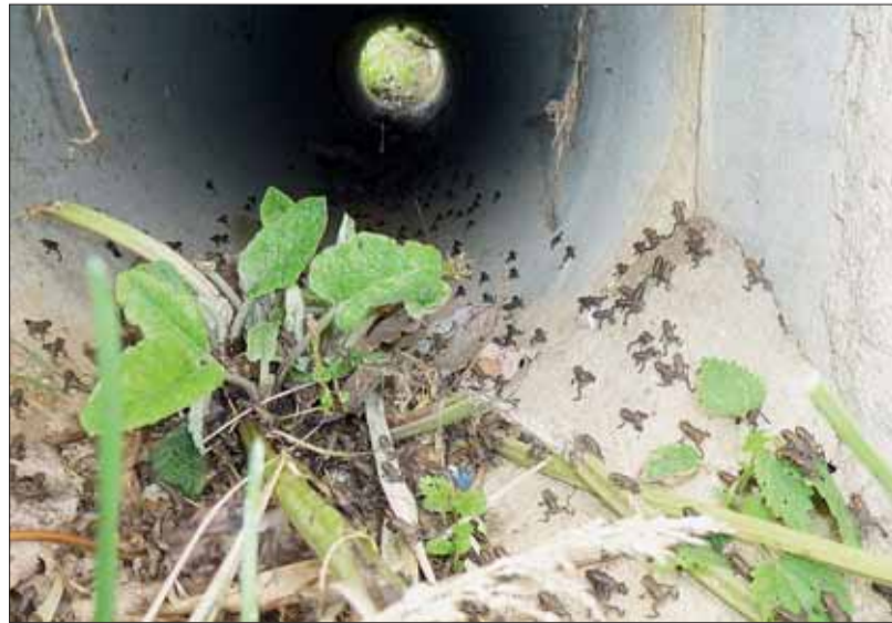
■ Žabky v průchodu u Žebětínského rybníka

Lesní rybníčky (aktuálně je funkční pouze jeden, v posledních letech je obnovován i druhý) se nachází v lesnatém svahu mezi Soběšicemi a Řečkovicemi, v údolí potoka Kubelín (ústí do Ponávky v blízkosti řečkovického nádraží). Na jaře jsou tu ideální podmínky pro pozorování pářících se obojživelníků, později sledování snůšek vajíček a potom i rostoucích pulců a ma-