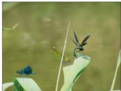
■ Motýlice u Staré řeky

Na území města zasahuje i velkoplošné zvláště chráněné území chráněná krajinná oblast Moravský kras.