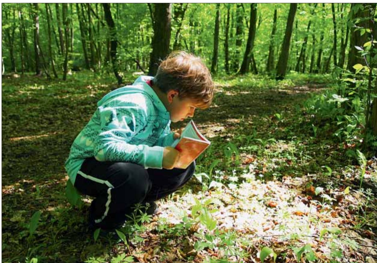
■ Určování rostlin na Hádecké planince

Z hlediska ochrany přírody mají význam rovněž stepní a lesostepní lokality (vzniklé v dávné minulosti po odlesnění