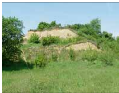
■ Červený kopec

Dále je nutno zmínit dřívější těžbu vápnitých spraší a výskyt červenofialového pískovce s vložkami břidlic a slepenců devonského stáří, který vystupuje na Červeném a Žlutém kopci, i těžbu šterkopísků tuňanské terasy na jihovýchodě města (např. významný krajinný prvek Černovická pískovna).