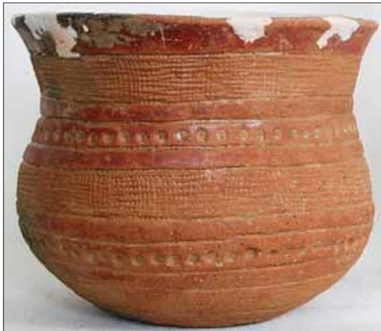
■ Zvoncovitý pohár nalezený v jednom z hrobů.