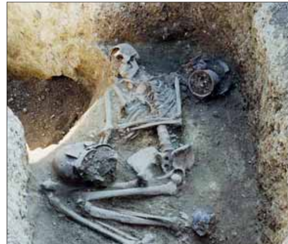
■ Hrob ženy s uloženým keramickým inventářem

Chcete-li se dozvědět o archeologických objevech v Brně více, navštivte sekci Archeologie na stránkách www.encyklopedie.brno.cz . Tato část Internetové encyklopedie dějin Brna je finančně podporována v rámci Operačního programu Vzdělávání pro konkurenceschopnost, který je spolufinancován Evropským sociálním fondem a rozpočtem České republiky.