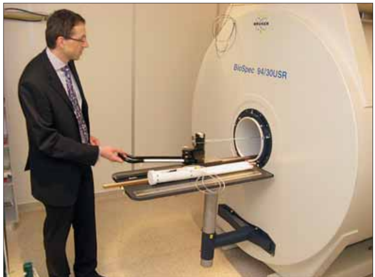
Na pohled nenápadný, uvnitř ale silně přitažlivý. Nejsilnější magnet v zemi.

lika desítek buněk,“ popsal vědecký ředitel ALISI Pavel Zemánek. U myší či