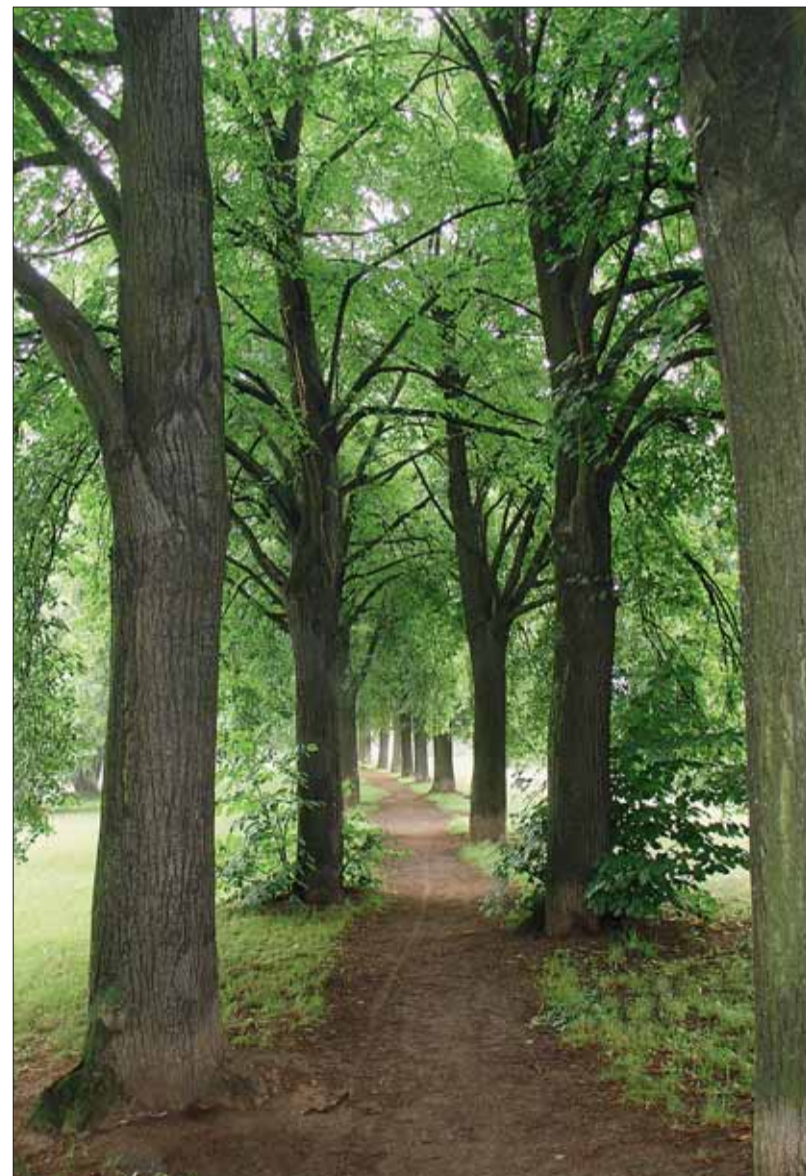
■ Maloměřická lipová alej

Pro zachování stávající a nedotčené přírody a krajiny byla na území města vyhlášena maloplošná zvláště chráněná území.