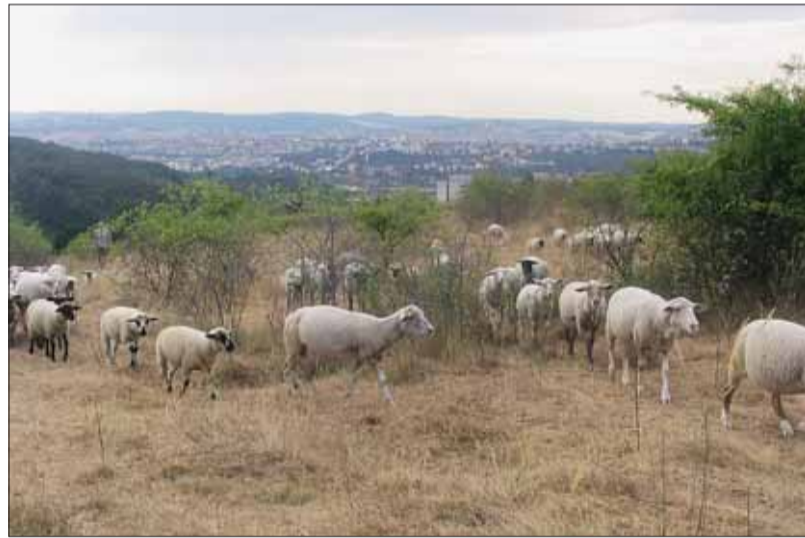
■ Pod Hády i dnes spásají traviny ovce.

V rozlehlém komplexu Podkomorských lesů najdeme kromě studánek, údolí s potůčky a vrcholů s lesními porosty také přírodní rezervaci Jelení žlíbek. Je to nevelké území s převládajícím zastoupením buku lesního. Porosty jsou ponechá-