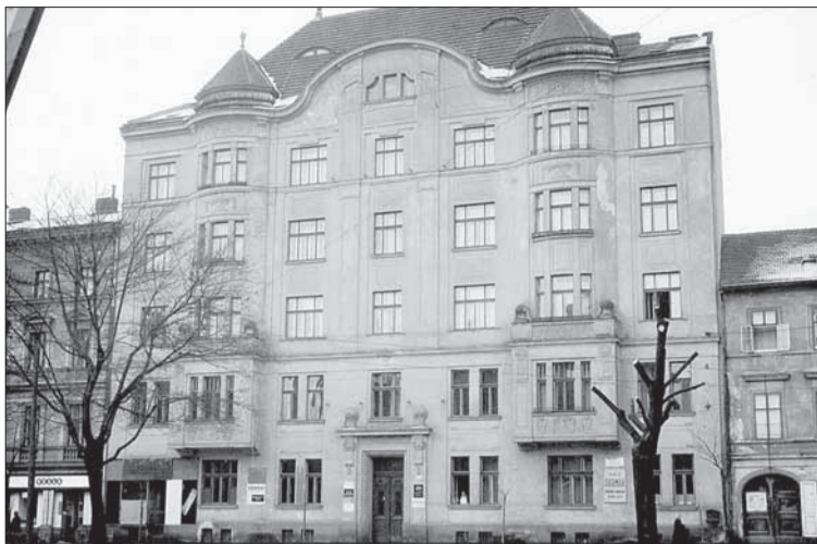
■ Jak se dříve nazývala tato ulice?