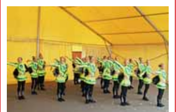
Mažoretky svedou boj o evropský titul