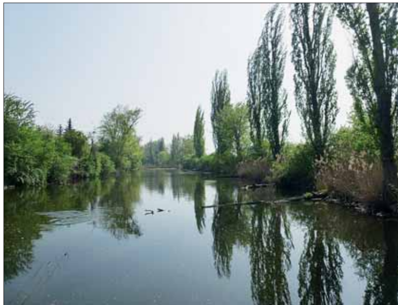
■ Holásecká jezera

Z celkem 29 území jsou dvě národní přírodní památkou (Červený kopec, Stránská skála), osm je přírodní rezervací (Babí doly, Bosonožský hájek, Břenečák, Černovický hájek, Velký Hornek, Jelení žlíbek, Kamenný vrch, Krnovec) a devatenáct přírodní památkou (Augšperský potok, Bílá hora, Holásecká jezera, Junácká louka, Kavky, Kůlny, Medlánecká skalka, Medlánecké kopce, Mniší hora, Na skalách, Netopýrky, Obřanská stráň, Pekárna, Rájecká tůň, Skalky u přehrady, Soběšické rybníčky, Údolí Kohoutovického potoka, Velká Klajdovka, Žebětínský rybník).