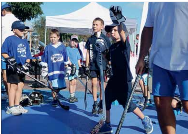
Festival by mohl nadchnout děti pro pravidelné sportování.