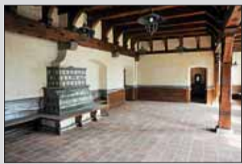
■ Budoucí vinárna.