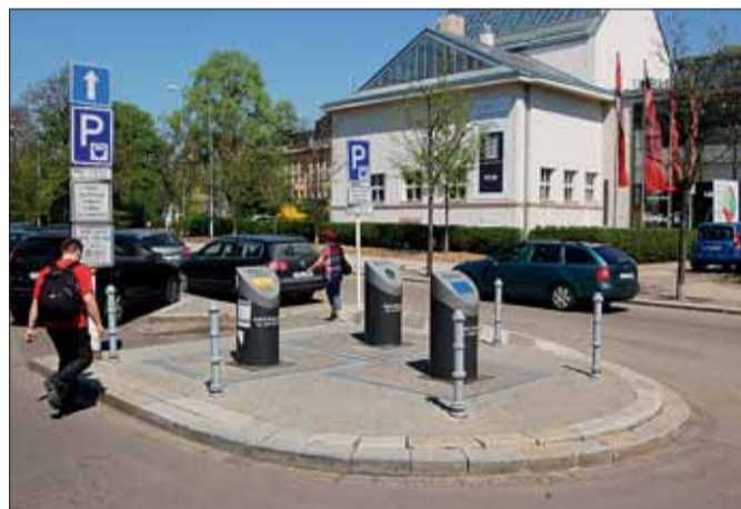
Podzemní kontejnery na Malinovského náměstí.

Materiálově využitelné složky komunálního odpadu jsou odpady, které lze využít například k recyklaci (odpad je zpracováván na výrobky nebo materiály). Recyklace znamená pro město zdroj příjmů, protože za vytríděné komodity dostane zaplacení od firem, které je dále zpracovávají. Především je ale recyklace šetrnější k životnímu prostředí, protože se některé druhy zboží nemusí vyrábět z nové suroviny. To méně vyčerpává její přírodní zdroje a spotřebovává se také méně energie a vody.