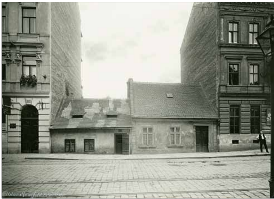
Fotografie z roku 1912, podepsaná jménem Kunzfeld, zachycuje část tehdejší Silniční ulice s domy číslo 23, 25, 27 a 29.

Se jménem Josefa Hybeše se Brňané žijící ve dvacátém sto-