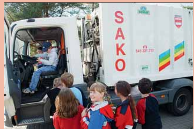
Kdo nechtěl být jako dítě popelářem? Málko.

Prohlídka zařízení vyrábějícího energii z odpadu je možná pouze po předchozí rezervaci na telefonním čísle 548 138 214, e-mailem na adrese dod@sako.cz nebo prostřednictvím rezervačního formuláře na webových stránkách www.sako.cz/rezervace . Prohlídky probíhají po skupinách v 9, 10, 11, 13, 14 a 15 hodin a pro zajištění bezpečnosti je počet návštěvníků ve skupině omezen.