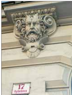
Detail domu s číslem 17.

letí setkávali téměř na každém kroku. Ve městě byla Hybešova čtvrť, Hybešova nemocnice i Hybešova hora (dnes Bílá hora). Hybešovu ulici mělo hned několik městských částí. Jmenovala se tak dnešní Kluchova ve Starém Lískovci, Borová ulice v Soběšicích i Tenorova v Žide- nicích. Dnes zůstal název jediné z nich, ulici na Starém Brně.