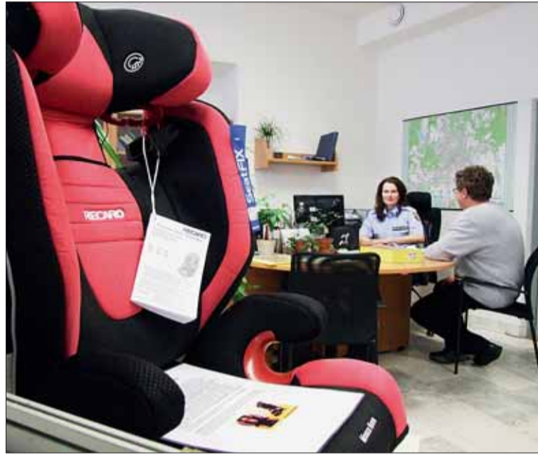
■ Kterou autoseďadku vybrat? Rozhodnutí ulehčí přehlídka několika typů s možností si je přímo vyzkoušet.

N ejen emotivním názvem „Připoutej mě, chci žít“ apeluje na rodiče a osoby převážející děti v autech nová expozice v Poradenském centru Městské policie Brno v Křenové 4. Až do 28. června se tu návštěvníci mohou dozvědět řadu užitečných informací o dětských zádržných systémech.