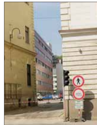
Za některými nenápadnými fasádami obrácenými do ulice se skrývají prostorné dvorní trakty i dolní část rozlehlého areálu nemocnice u sv. Anny.