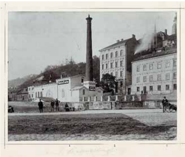
Snímek pořídil cca před sto lety pro městský stavební úřad fotograf, který sice neměl Silniční ulici před objektivem, ale stál na jejím rozhraní s Novými Sady a zachoval pro nás památku na městské sprchové lázně na sousední Kopečné ulici.