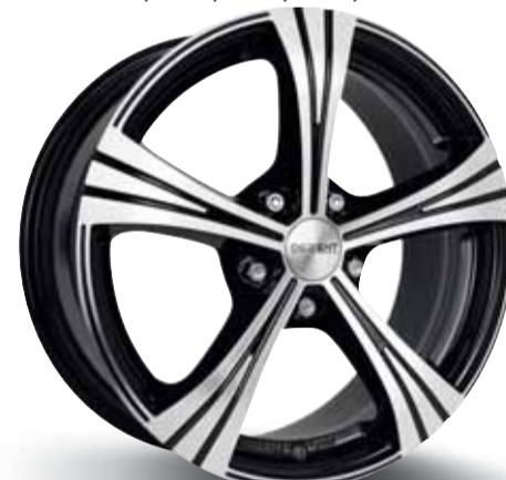
DEZENT RI dark 15", 16", 17"