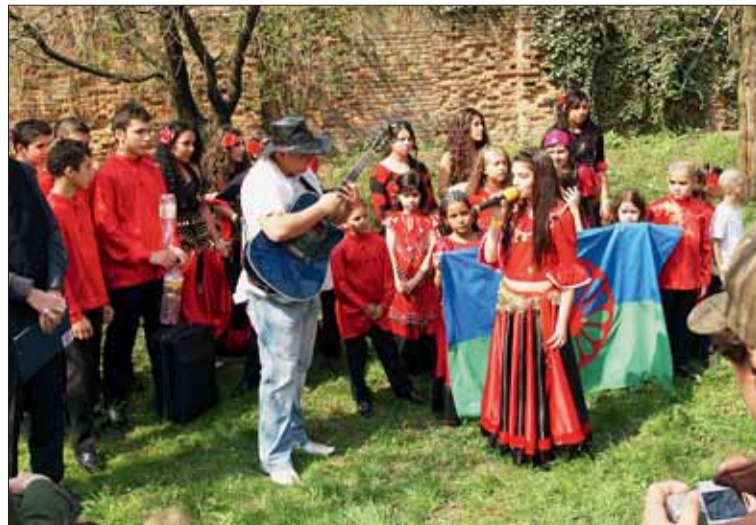
Mezinárodní den Romů byl stanoven na 8. dubna, kdy se v roce 1971 konal historicky první světový kongres Mezinárodní romské unie. Na snímku loňské oslavy v Brně.

Oslavit bohatou a krásnou romskou kulturu, ale zároveň připomenout útlak a porušování základních lidských práv Romů na celém světě. Takový je cíl Mezinárodního dne Romů. Jeho oslavy se v Brně konají 8. dubna a letos jsou pojety opravdu velkolepě – s bohatým kulturním programem na náměstí Svobody.