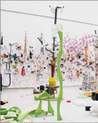
■ Výstava Krystaliza her.

Královský hrad Špilberk byl v 18. století tzv. žalářem národů, nejproslulejší věznicí v habsburské monarchii. Nyní návštěvníkům nabízí několik stálých výstav i prohlídku podzemních kasemat. Po rozsáhlé rekonstrukci se koncem května otevře veřejnosti jižní křídlo hradu, jehož prostory budou sloužit nejen výstavám. Slavnostní otevření bude provázeno vernisáží dvou nových stálých expozičních – Galerie výtvarného umění 2. poloviny 20. století a počátku 21. století a O nové Brno – brněnská architektura 1919–1939. Zajímavým počinem inspirovaným dílem Komenského bude také výstava výtvarníka Petra Nikla s názvem Orbis Pictus – Krystaliza her, přístupná od 30. května do 28. října.