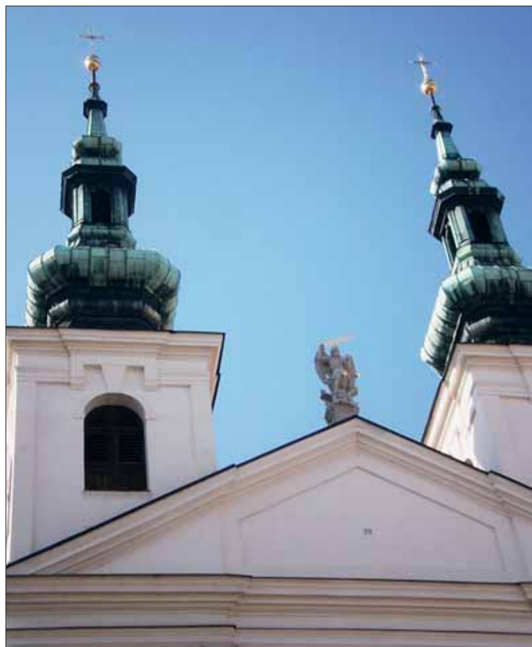
■ „Zlatá přílba, meč jak blesk, junák statný – velký třesk“ aneb anděl s mečem na čestném místě mezi věžemi kostela sv. Michala.

Na konec jsme si nechali velmi zajímavou otázku, kterou nastolil jiný kmenový překladatel: Jak se vůbec může dařit padlým andělům na půdě svatostánku? „Potěšili jste mě příběhem