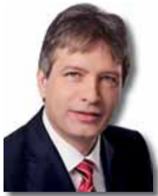
ROMAN ONDERKA primátor města Brna (ČSSD)