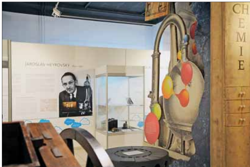
Výstava Vynálezci a vynálezy.

Moderní a rozsáhlé muzeum v Králově Poli nabízí ucelené expozice historie dopravy, letectví, nožířství, kovolictví, železničství, sdělovací techniky, vodních a parních motorů, salon mechanické hudby a kultury nevidomých.