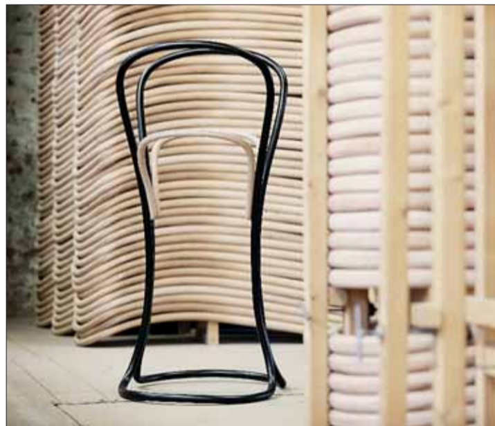
■ Designem k prosperitě. Ve dvoraně Centra VUT v Brně v Antonínské 1 je od konce března k vidění putovní výstava Designem k prosperitě. Představují se tu české firmy a značky, kterým kvalitní design pomohl k vytvoření stabilního místa na trhu, ke zvýšení prodejů a konkurenceschopnosti. Výstupy projektu by měly sloužit jako inspirace pro manažery domácích podniků k investici do kvalitního designu. 11. dubna se v rámci výstavy uskuteční seminář na téma design jako účinný nástroj úspěchu a prosperity. V Brně se průmyslový design vyučuje právě na VUT. (zug), foto: TON (dřevěný věšák Petalo)

Premiéru má letos série vícedenních workshopů zahraničních umělců na půdě Janáčkovy akademie múzických umění, jejíž nedávno vzniklá katedra jazzové interpretace je vzdělávacím partnerem festivalu. (zug)