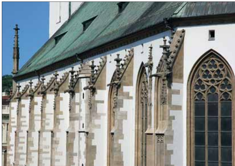
Kostel sv. Jakuba.

Příležitost k návštěvě katedrály sv. Petra a Pavla na Petrově, baziliky Nanebevzetí Panny Marie na Starém Brně, děkanského kostela sv. Jakuba a minoritského kostela sv. Janů a lo-rety mimo dobu bohoslužeb nabízí projekt Brno a jeho chrámy. Od poloviny června do poloviny září je možné zdarma využít přítomnosti profesionálních průvodců a dozvědět se vše o stavebně-historickém vývoji, liturgii nebo ikonografii dané památky.