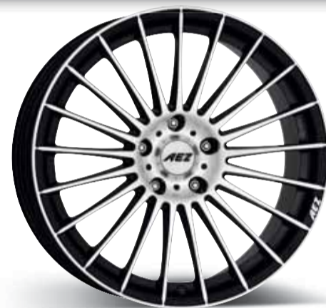
AEZ Valencia dark 16", 17", 18", 19", 20"