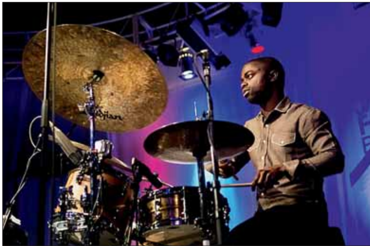
■ Předskokanem festivalu bylo březnové vystoupení osmnáctinásobného držitele ceny Grammy, skladatele a klavírního virtuosa Chicka Coreya s novým projektem The Vigil.

Také v Semilassu se 19. dubna představí indo-americký kytarista Rez Abbasi ve společnosti saxofonisty Rud-