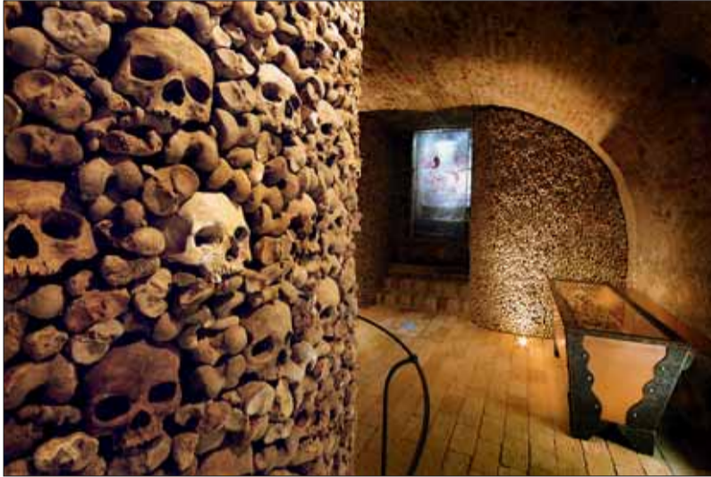
■ Kostnice u sv. Jakuba.

Brněnské podzemí – Mincmistrovský sklep, Labyrint pod Zelným trhem a Kostnice u sv. Jakuba – vytváří jedinečný komplex zážitkové turistiky.