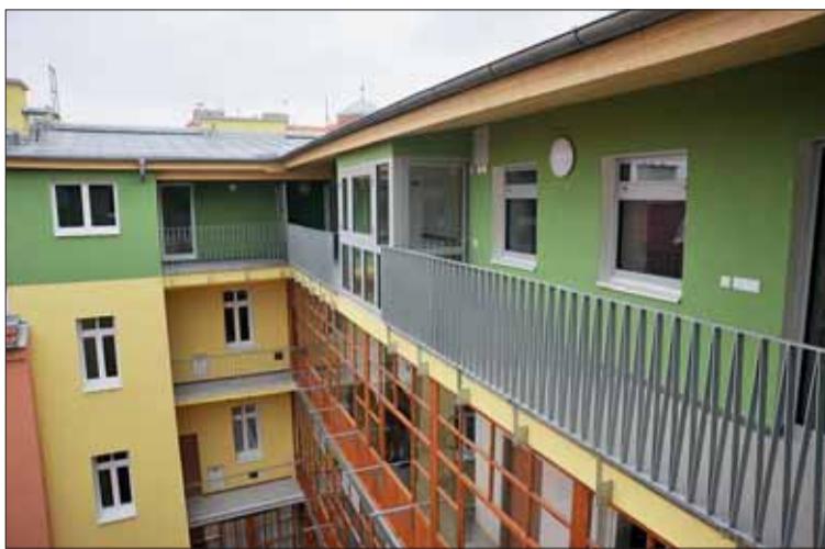
■ Opravený bytový dům ve Francouzské 20 byl slavnostně otevřen 28. března. Je už sedmý, nyní zbývají poslední čtyři.

Celkem bude v problémové obytné zóně tvořené hlavně ulicemi Cejl, Bra-