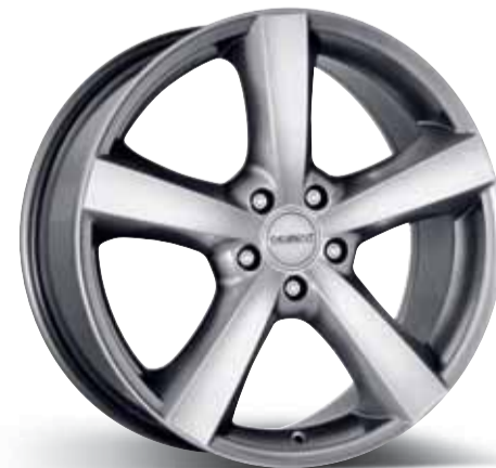
DEZENT F/M 14", 15", 16", 17", 18" 16", 17", 18", 19", 20"