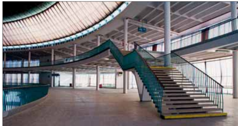
■ Jednou z hodnocených – a hodnotných – staveb je pavilon Z, postavený v letech 1958–59.

Více informací o projektu a výstavě najdete na stránkách www.arch4579.eu a www.urbancentrum.brno.cz . (mak)