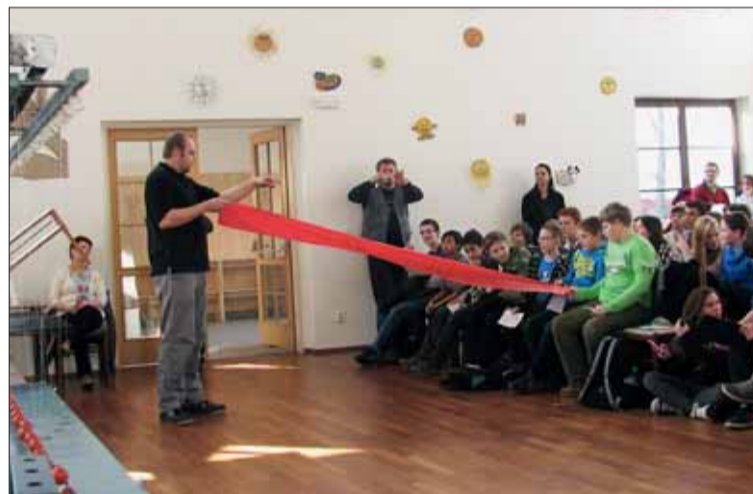
Jak představit slavného fyzika živě? Ukázkami vybraných experimentů spjatých s jeho jménem.

Stojí za připomenutí, že Ernst Mach se v areálu někdejšího chrlického zámku narodil a následně byl v nedalekém tuňanském kostele pokřtěn. Dlouhou dobu byl u nás opomíjen, ale jeho dílo ve světě žije jako součást letectví i teoretické fyziky, mechaniky a kosmologie. Je největším fyzikem, který