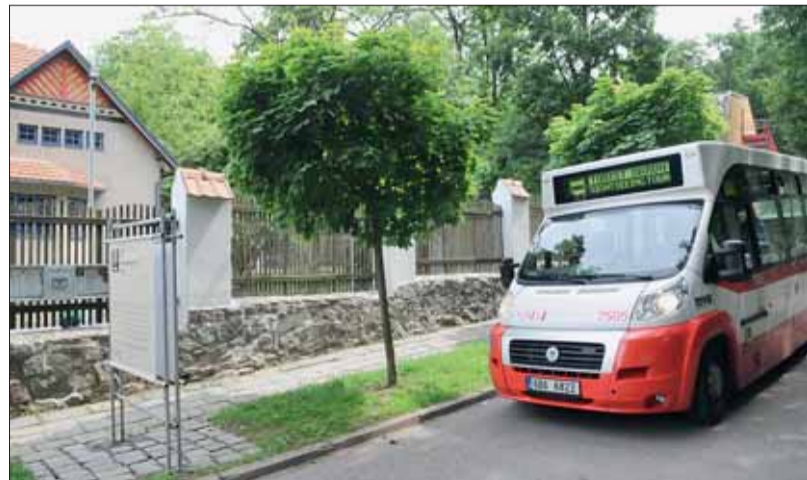
Jednou z památek, které lidé z minibusu uvidí, je Jurkovičova vila.

I v letošní sezóně do brněnských ulic vyjede turistický minibus. Při projížďce je možné si prohlédnout nejzajímavější místa a stavby ve vnějším okruhu historického centra města. Zdatní průvodci doplní zajímavým výkladem o historii i současnosti města. Minibus bude v provozu od pátku do neděle od června do srpna, odjíždí se vždy z Malinovského náměstí naproti Mahenovu divadlu a jízdenky lze koupit přímo ve voze.