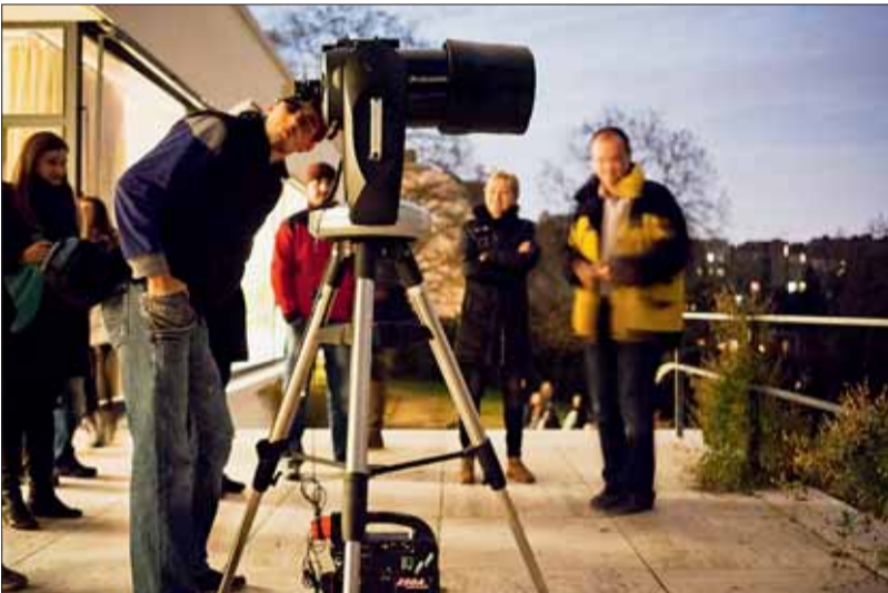
■ Ve vile Tugendhat se kromě prohlídek konají různé kulturní či vzdělávací akce.

Rodinná vila postavená podle návrhu německého architekta Ludwiga Miese van der Rohe v letech 1929–1930 sloužila svému původnímu účelu pouze prvních osm let.