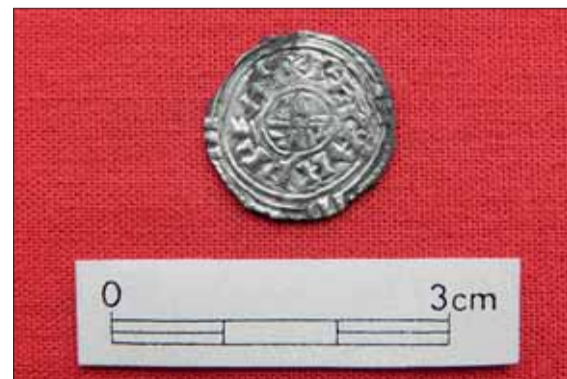
► Denár uherského krále Ondřeje I. nalezený v jednom z hrobů.

Chcete-li se dozvědět o archeologických objevech v Brně více, sledujte tuto rubriku nebo navštívte sekci Archeologie na stránkách www.encyklopedie.brna.cz . Tato část Internetové encyklopedie dějin Brna je finančně podporována v rámci Operačního programu Vzdělávání pro konkurenceschopnost, který je spolufinancován Evropským sociálním fondem a rozpočtem České republiky.