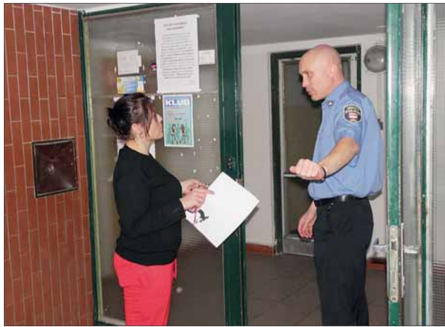
Strážník vysvětluje obyvatelce domu Koniklecová 5 funkce čipového otevírání dveří.

Denisa Kapitančíková, Městská policie Brno