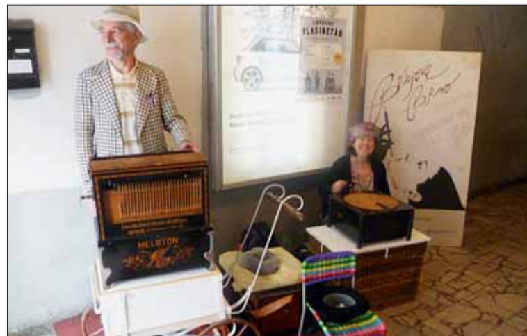
Jarmark na Fléď – i s flašinetářem – měl loni úspěch.

Více informací k celému programu získáte na stránkách www.bonjourbrno.cz. Markéta Žáková