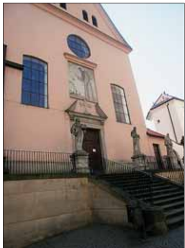
■ Vstup do „kapucálské krchcimry“