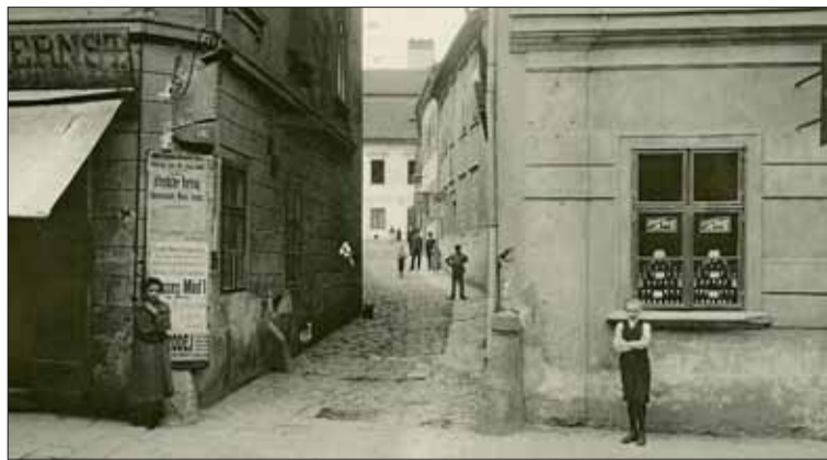
► Poznáte ulici na snímku?

Ulice za Slovanem dnes nese název Mezírka, daleko známější je ovšem název „Šmálka“, protože zdejší kolonie přináležela k dřívější textilní fabrice továrníka Schmala. Avšak úplně původní kolo-