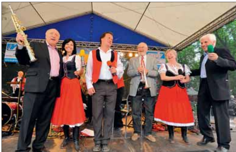
■ Tradiční koncert Nebe plné hvězd se koná 30. dubna v parku u „Šelepky“.