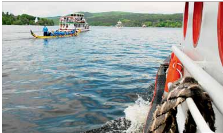
■ Aby bylo „brněnské moře“ atraktivní, musí být voda jako na Jadranu. Čistá.

Po dobu realizace opatření nebyly zaznamenány žádné negativní vlivy na zdravotní stav vodních živočichů a koncentrace celkového fosforu na přítoku do nádrže má setrvalě klesající tendenci. Od roku 2010 zde Krajská hygienická stanice nevyhlásila zákaz koupání a během vegetační sezóny