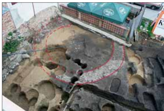
► Pohled na dochovanou část raně středověké rotundy.

Rotundu lze přiřadit do širšího okruhu sakrálních staveb, z nichž v současnosti známe pouze rotundu Panny Marie na Starém Brně a rotundu sv. Kateřiny ve Znojme, které jsou datovány do 11. století. Podobně jako tyto stavby představuje rotunda jednu z nejstarších církevních staveb na území Moravy (pomineme-li církevní stavby z období velkomoravského).