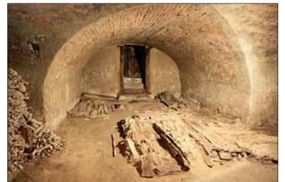
► Pohled na reliéfy dřevěných rakví z 18. století v východní části největší komory krypty. Patrný je také vstup z kostelní lodi.

Chcete-li se dozvědět o archeologických objevech v Brně více, sledujte tuto rubriku nebo navštivte sekci Archeologie na stránkách www.encyklopedie.brno.cz . Tato část Internetové encyklopedie dějin Brna je finančně podporována v rámci Operačního programu Vzdělávání pro konkurenceschopnost, který je spolufinancován Evropským sociálním fondem a státním rozpočtem České republiky.