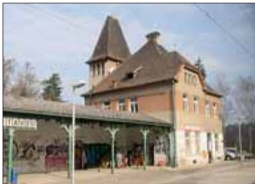
Staré Bartoš hrne večer z Bílovic...

„Něsem blbá palice, v kurníku je dobrot! Jeden kohot a tři slepice.“