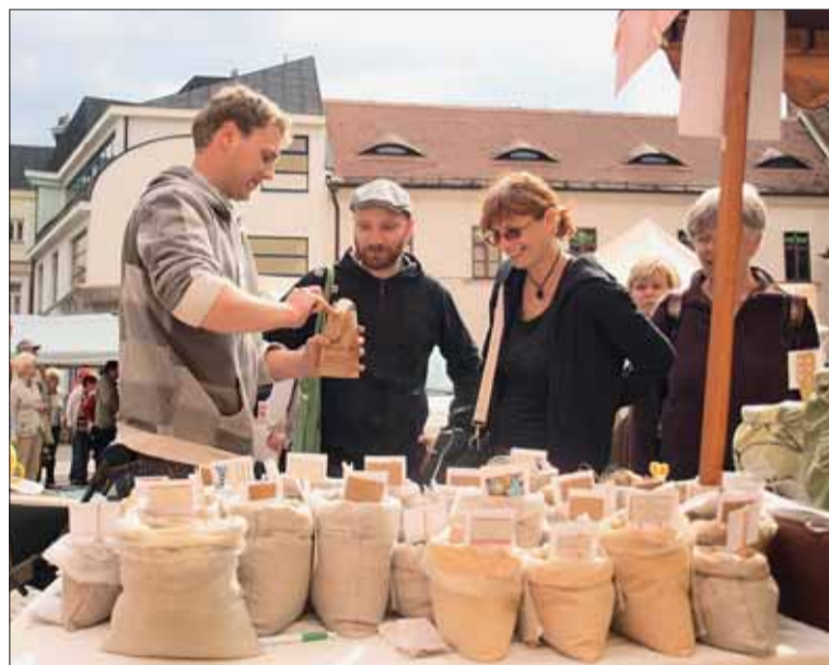
Trhy na Římském náměstí. Kdysi proslulý „blešák“, dnes nabízí regionální potraviny.