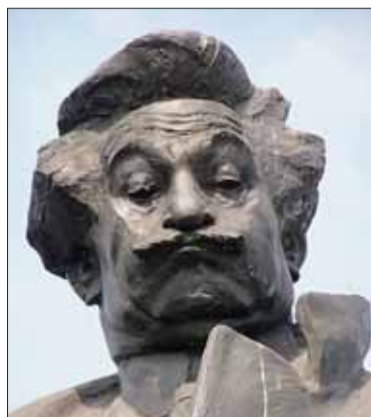
Věčnou slávu dal jí Leoš Janáček...

Bystrouška je na myslivně z podpory, místo masa dostává jen brambory. Že je chytrá a má kliku,