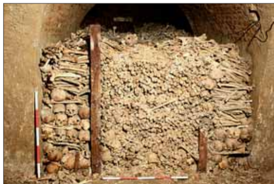
► Pohled na kosterní ostatky v severní části krypty. Patrné jsou fragmenty dřevěné přičky z 2. poloviny 17. století.