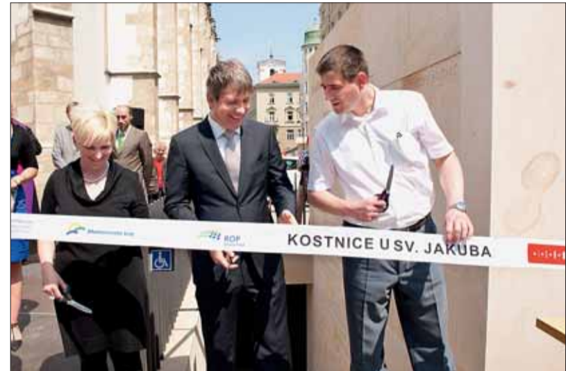
„Triptych“ je kompletní. Třetí část podzemí byla za účasti primátora města Brna Romana Onderky (uprostřed) a dalších významných hostů slavnostně otevřena 20. června.

Aby tento unikát zachovalo pro budoucí generace, zpracovalo město Brno projekt na revitalizaci kostnice jako další části svého postupně zpřístupňovaného podzemí a získalo na ni dotaci z Regionálního operačního programu Jihovýchod ve výši 12,5 milionu korun.