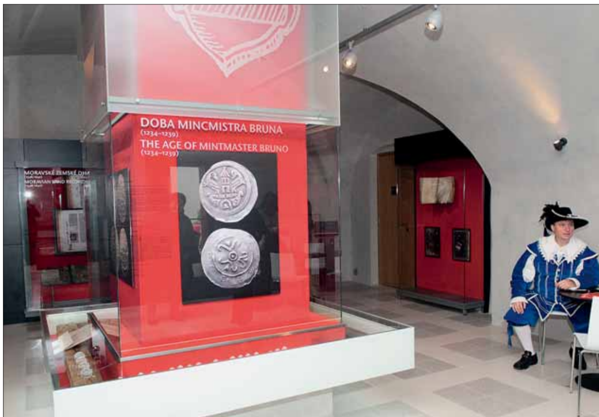
■ Ražba mincí. Expozice v Mincmistrovském sklepě zachycuje historii mincovní ražby v Brně a na Moravě od poloviny 11. do začátku 16. století. Nechybí ukázky mincovního řemesla a funkční replika středověkého mincovního lisu.