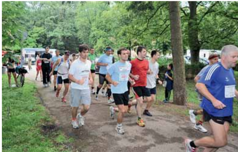
■ V půli června se v Pisárkách běžel závod na 6 km.

Koncept poháru zůstává stejný jako v předchozích ročnících. Závody startují v osvědčenou středu vždy v 18 hodin a běží se jich dvacet, patnáct nejlepších výsledků se započítává do celkového hodnocení a za dvanáct odběhlých závodů získají účastníci pamětní tričko. Pohárem však sezóna rozhodně nekončí, již 13. října startovní výstřel zahájí další ročník běžeckého závodu kolem Brněnské přehrady „Vokolo příglu“, který nabízí výzvu v podobě 14kilometrové trasy kolem „brněnského moře“. Soňa Haluzová