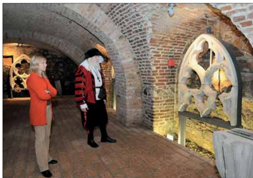
■ Fragmenty Královské kaple. Raně gotický unikát ve spodní části Dominikánského náměstí nechala městská rada v roce 1908 zbourat.

Poslední vstup v 17.30 hodin, prohlídky probíhají individuálně.