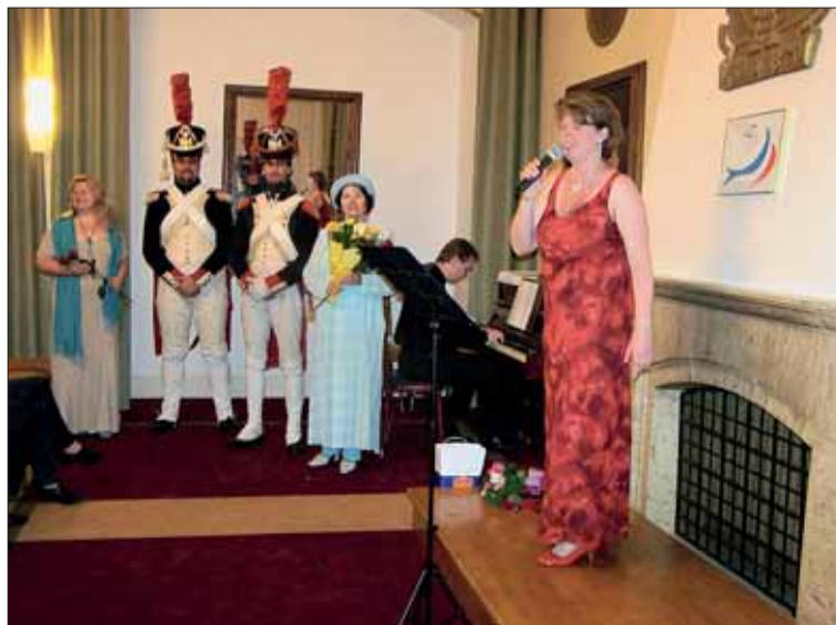
■ Árie, básně, gurmánské speciality. To vše „à la Rusko“.