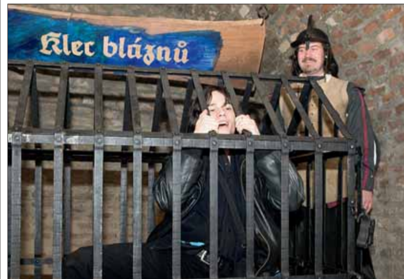
■ Klec bláznů. U návštěvníků labyrintu pokaždé vyvolá vzrušení. Zčásti pro svůj původní účel, zčásti kvůli objemu. Skupinky podle průvodců zkouší, kolik lidí klec pojme.