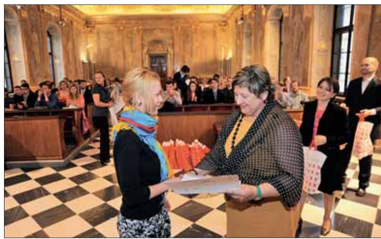
■ Ti nejlepší si mohou úspěch napsat do životopisu nebo získat stáž na magistrátu.

N ejčastějším nástrojem, jak podpořit talentované studenty, je prospěchové stipendium. Proč jim ale nenabídnout i jiné možnosti? Tak vznikla Masarykova univerzitní studentská soutěž (MUNISS), při jejíž organizaci spojily síly Ekonomicko-správní fakulta Masarykovy univerzity a město Brno.