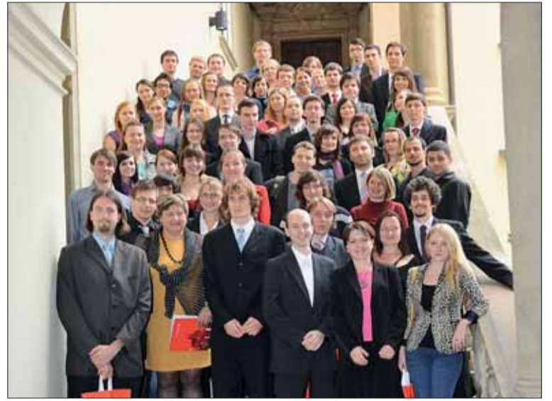
■ Inovativní nápady podložené průzkumem v terénu. To přinesly výsledné studie pro Brno.