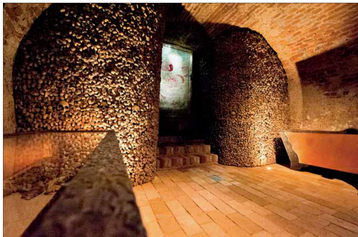
■ Kaple zemřelých. Návštěvníci ve druhé (hlavní) komoře mimo jiné uvidí skleněnou mozaiku výtvarnice Magdaleny Řičné s námětem Božího těla a pohřební schránky s ostatky.

„Ta bude sloužit jako prostor pro zádušní mše nejen pro děkanství, ale i pro soukromé zájemce,“ doplnila Kačírková. Zdobí ji kříž, ambon (vyvýšené řečnické místo v chrámu), plastika Piety, vitráž Boží tělo a pohřební schránky se dvěma sestavenými kostrami zesnulých (13leté dítě a dospělý) pohřbenými v objevených barokních rakvích.