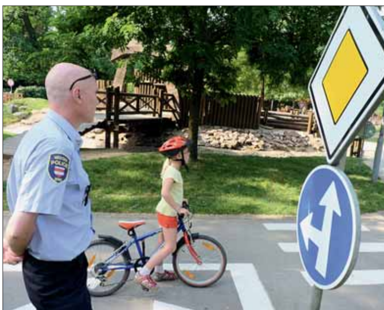
■ Těžko na dopravním cvičišti, lehký na silničním bojišti.

Jízda po dopravním hřišti, obohacená o prvky jízdy zručnosti, umožňuje praktický nácvik dovedností v ovládnutí jízdního kola a prevenci úrazů. Bezpečný nácvik na vytyčené trase je garantován vlastní konstrukcí dřevěných překážek a přítomností strážníků.