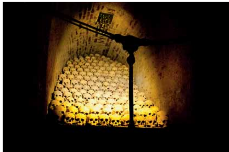
■ Umění a pieta. Slepou chodbu s pietně naskládanými ostatky zdobí kromě náhrobků také plastiky Duše a Slzy.

Nalezené ostatky byly převezeny do krypty na Kraví hoře, kde je odborníci očistili a zakonzervovali. Součástí expozice jsou především nejlépe zachované kusy kosterních ostatků, zbytek kosterního prachu, hlíny a polámaných kostí byl pohřben na centrálním brněnském hřbitově ve speciálních rakvích.