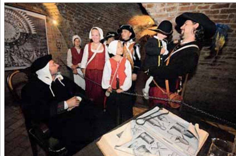
■ Kostymované prohlídky. Při zahájení turistické sezóny, o Brněnské muzejní noci nebo při Dni Brna se v labyrintu konají kostymované prohlídky. Podle průvodců mají vždy kladný ohlas – jsou atraktivnější a tajemnější.

Poslední vstup v 17.30 hodin, prohlídky probíhají s průvodcem ve skupině od 5 do 25 osob. Od října do dubna se konají každou hodinu.