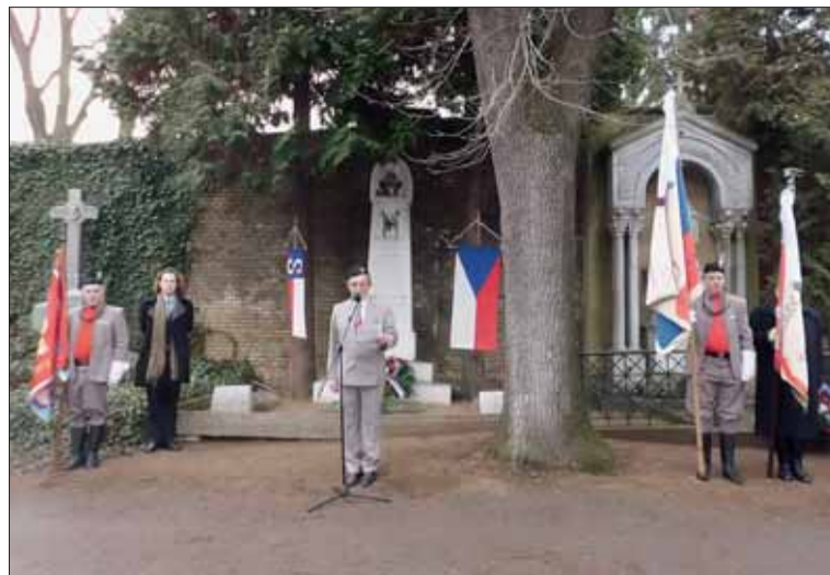
Jan Helcelet, po němž je v Brně pojmenována ulice ve Stránicích, posiloval své zdraví tělocvikem, plaval a miloval jízdu na koni.

H ned po Novém roce, 2. ledna, uctili moravští sokolové slavnostním aktem na Ústředním hřbitově v Brně 200. výročí narození Jana Helcelety (1812–1876), významné osobnosti obrozeneckého hnutí na Moravě.