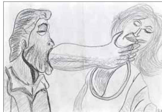
■ Psychické násilí