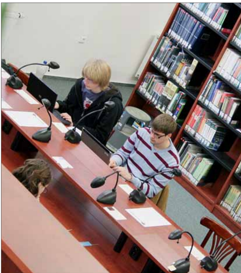
■ Masarykova univerzita je jednou z nejrespektovanějších vysokých škol v České republice. A nejžádanější.

Jednoznačně nejzajímavější projekt, na kterém dosud pracuji, jsou Studentští poradci. Zde jsem měl snad poprvé pocit, že dělám něco užitečného, co druzí oceňují. Jde o koncept „studenti radí studentům“, kdy kvalifikovaný tým poradců posky-