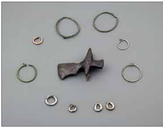
► Rané středověké nálezy záušnic a seker s ostny z hradu kolem starobrněnské rotundy