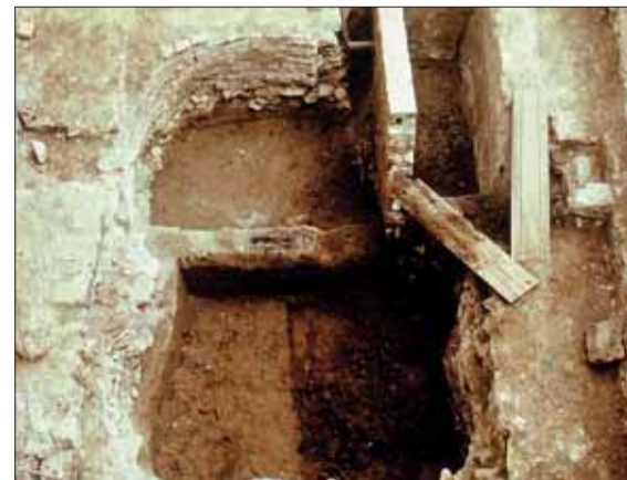
► Pohled do vnitřku rotundy.

Chcete-li se dozvědět o archeologických objevech v Brně více, sledujte tuto rubriku nebo navštivte sekci Archeologie na stránkách www.encyklopedie.brno.cz . Tato část Internetové encyklopedie dějin Brna je finančně podporována v rámci Operačního programu Vzdělávání pro konkurenceschopnost, který je spolufinancován Evropským sociálním fondem a státním rozpočtem České republiky.