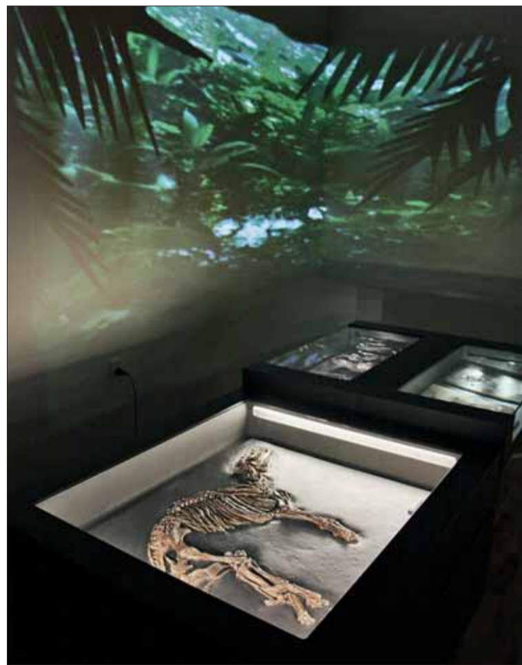
■ Předkové. Díky mimořádným fosilizačním podmínkám jsou na zkamenělinách z lokality Messel zachovány i detaily a jemné struktury jako obsah žaludku, zbytky tkání, peří ptáků nebo srst savců.

získat na dobu tří měsíců (do 7. dubna) soubor originálů zkamenělých živočichů z doby před 47 miliony lety. Pocházejí z někdejšího jezera Messel v německé spolkové zemi Hesensko nedaleko Frankfurtu nad Mohanem.