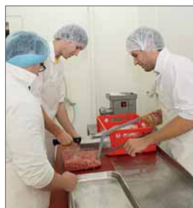
Na VFU se studenti mohou dozvědět řadu informací např. i o bezpečnosti a kvalitě potravin.

Naše studentská organizace I.V.S.A. Brno se snaží o kulturně-odborné aktivity – vítání prváků, každoroční majáles VFU, zahraniční výměny studentů,