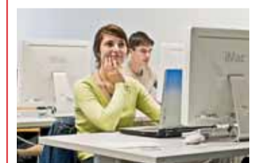
Univerzity rostou a rozvíjejí se. Jak se na nich studuje?