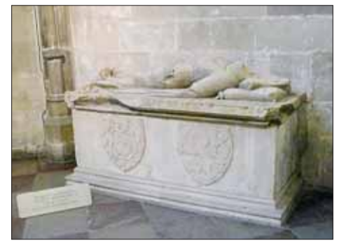
■ Náhrobek Břetislava II. v pražském chrámu sv. Víta