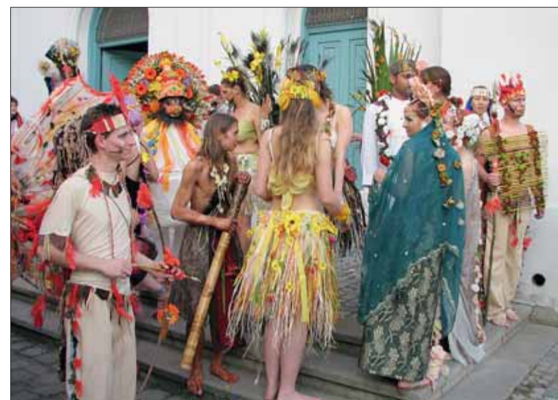
Ukázka prací studentů floristiky. Studovat na univerzitě není nuda.

Je tradiční a patří k největším, stále se ovšem rozvíjí, aby co nejvíce profilovala studenty pro dnešní praxi. Její atmosféru bych popsal jedním slovem – přátelská. Nepoznal jsem za svůj život lepší přátele než v průběhu studia na AF. A jsou to přátelé na celý život.