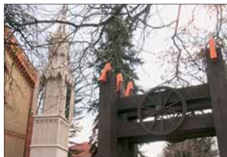
■ Břeta se vytočil: „Seš kurňa dobytek!“