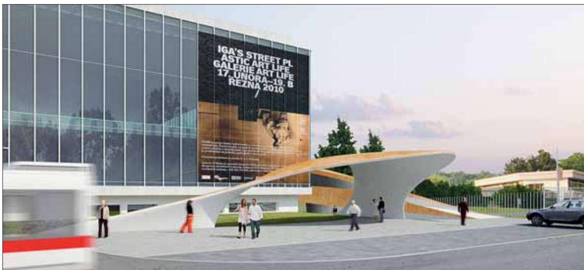
■ Přírodní zákonitosti, fyzikální jevy i chemické úkazy pod jednou střechou. Vizualizace: www.msccb.cz

Hlavním cílem projektu je vytvořit v Brně jedinečné interaktivní centrum popularizace a propagace vědy a výzkumu. Půjde tedy o místo k seznámení s přírodními zákonitostmi, fyzikálními jevy i chemickými úkazy, které bude sloužit nejen studentům přírodovědných oborů, ale zejména veřejnos-