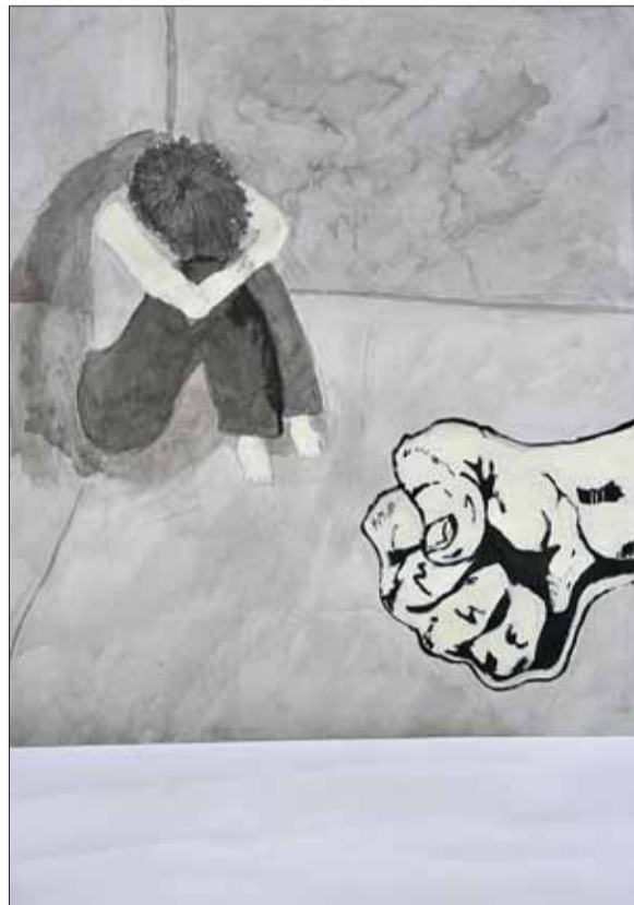
■ Násilí prohrává

Nejlépe hodnocené žákovské a studentské práce z této soutěže postupně uveřejňujeme na našich stránkách. V lednovém čísle jsme vás seznámili s vítěznými díly kategorie Fotografie, nyní vám představujeme nejlepší kresby.