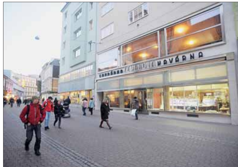
Mezi nejvýraznější části domu v Josefské ulici patří uliční výkladce a interiéry oblíbené cukrárny.