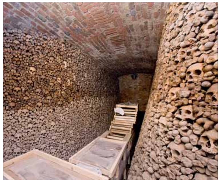
Kostnice u sv. Jakuba by se mohla stát jednou z nejatraktivnějších památek v Brně.