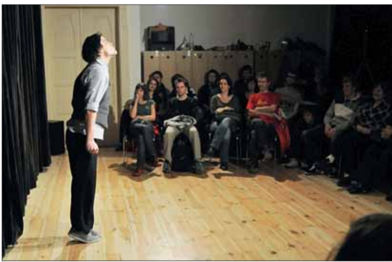
■ Na Divadelní fakultě JAMU lze studovat např. herectví, divadelní manažerství, scénografii nebo dramaturgiu pro neslyšící.

Pracujete už nyní na nějakém zajímavém projektu?