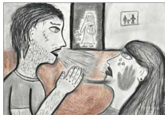
■ Za co trpí?