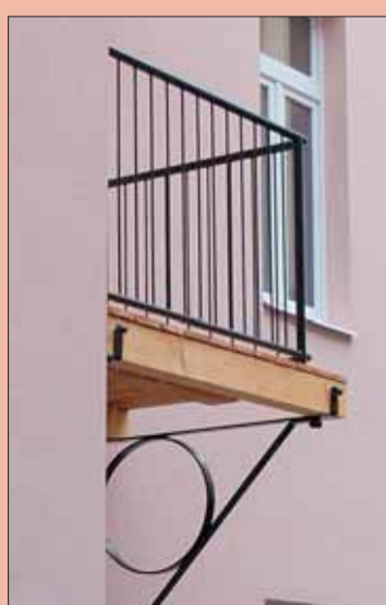
■ Rekonstruovaný bytový dům ve Spolkové 3.

Městská část Tuřany zřizuje na svém území tři mateřské školy s celkovou, plně využitou kapacitou 181 míst.