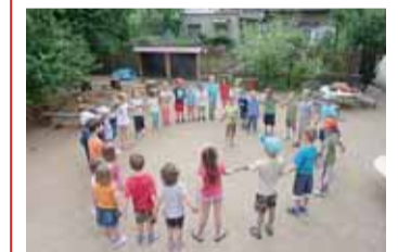
Školky v Brně on-line