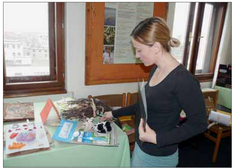
Porota hodnotí díla zasláaná do soutěže Moje Veličenstvo kniha 2011.