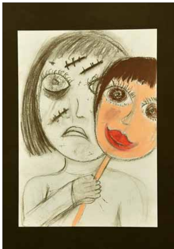
■ Zdání klame