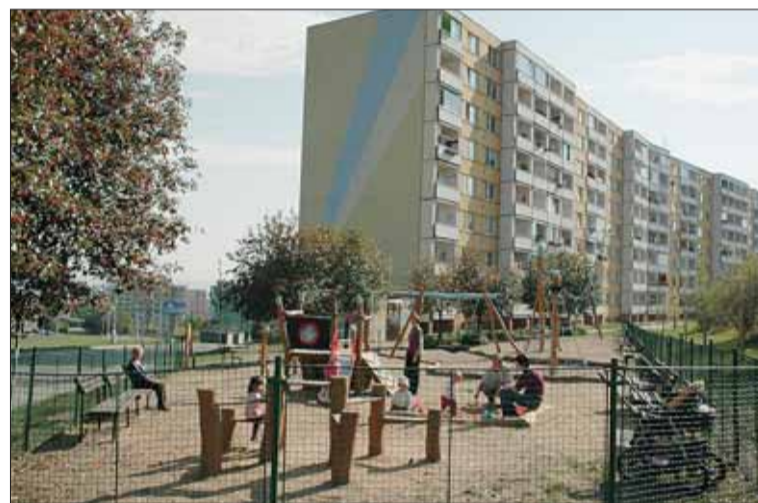
■ Bystrcké sídliště bylo sledováno ve všech třech vlnách výzkumu. Lidé jsou tu se svými byty, domy i celým sídlištěm převážně spokojeni.

V Urban centru – informační kanceláři městských projektů – na Staré radnici se od 21. února do 31. března mohou návštěvníci seznámit s výsledky třetí vlny unikátní série výzkumů vybraných brněnských sídlišť, které jsou od 80. let zpracovávány pro Magistrát města Brna. Konkrétně se v roce 2011 jednalo o sídliště Vinohrady, Bohunice, Bystrc II, Kamenný Vrch, Lesná a Kamechy.