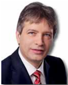
ROMAN ONDERKA primátor města Brna (ČSSD)