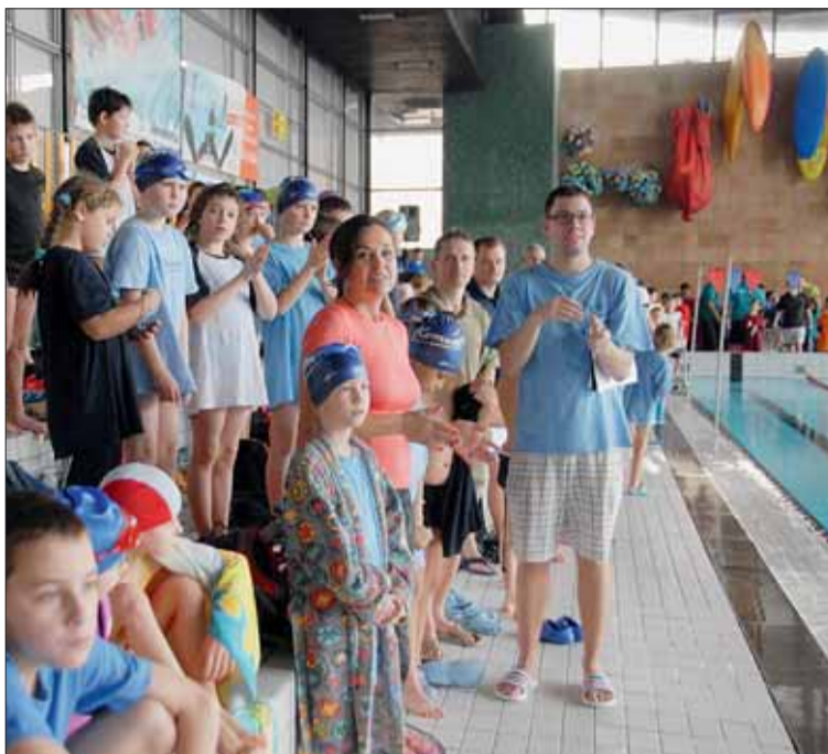
Malí účastníci závodu Brněnský tučňáček nejsou ve vodě zdaleka poprvé, ale možná poprvé soutěží na mezinárodní úrovni.

Srovnávací závody nejmladšího žactva však nejsou o vítězství a rekordech, ale hlavně o atmosféře prvních velkých závodů a zábavě pro děti. „Každý z malých plavců zde ukázal svou šikovnost a za pár let určitě o ně-