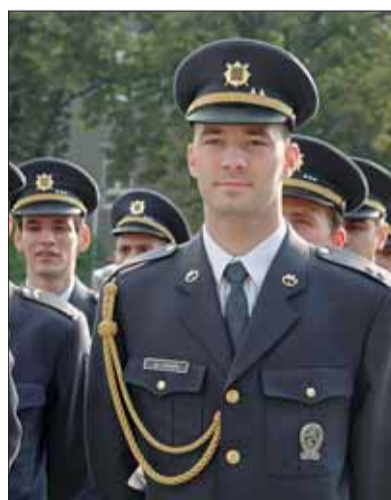
Jako jediní v zemi dostávají studenti UNOB plat. Pokud by ovšem studium ukončili předčasně, museli by peníze vrátit.

Určitě ano, ale spolužáci mají trochu jiné zájmy než já, jsem členkou univerzitního i fakultního senátu, působím v redakční radě našeho časopi-