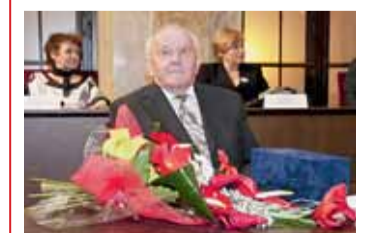
Obohatili naši společnost a získali Cenu města Brna