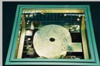
Nehybná směna.

Sterec v Moravské galerii. 2. února zahájila Moravská galerie v Brně první výstavu roku 2012. Představuje dílo současného umělce a finalisty Ceny Jindřicha Chalupického 2011 Pavla Sterce. Základem Stercovy práce jsou dlouhodobě promyšlené průzkumy, experimenty a konceptuální postupy reagující na nejrůznější druhy podnětů. Výsledek pak může nabývat různých podob – od tvorby komentovaných situací a performancí až po komplexní a promyšlené galerijní instalace. V nich autor používá nejrůznější média – fotografie, objekty, zvuk, texty apod. Ve své zatím poslední instalaci Nehybná směna Sterec využívá exotických reálií jako nástroje k univerzálnějším úvahám o symbolickém kapitálu, fetišizaci hodnot a jejich devalvaci. Výstava v Pražákově paláci v Husově 18 končí 27. května.