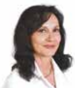
Karin Podivinská náměstkyně primátorky města Brna, ANO 2011

Zájem o obecní nájemní bydlení ze strany občanů stále stoupá. Je to hlavně proto, že pořízení vlastního bytu je dnes pro mladé lidi, ale i střední třídu vzhledem k cenám bytů i výši hypoték téměř nemožné.