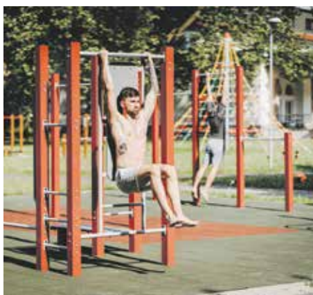
Aktuálně | Na Riviéře vzniklo nové workoutové hřiště

Vážené čtenářky, vážení čtenáři, ať už jste prázdniny strávili u moře, na chalupě nebo doma, snad vám bylo dobře. A třeba vám bylo dobře proto, že je s vámi prožila rodina a přátelé. Po prachbídém počátku roku to byl balzám pro duši, tedy v případě, že jste sociální kontakty opravdu postrádali.