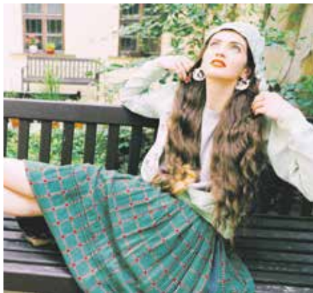
Magistrát informuje | Trochu jiné kousky do šatníku. Na Panské bude burza krojů

Zbrojovka opouští první ligu, Líšeň druhá v druhé lize