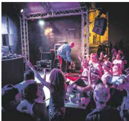
Aktuálně | Špilberk představí všechny krásy léta: kulturu, zábavu i romantiku