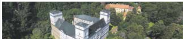
Zastavovaný areál zámku Račice v rámci dluhopisového programu e-Finance CZ v celkové hodnotě uveřejněné na adrese www.e-finance.eu/zajistene-dluhopisy .

Koncern e-Finance, a.s. v současnosti spravuje investice do nemovitostí v hodnotě přesahující 1 miliardu korun. Investiční strategií e-Finance je investovat prostředky získané z dluhopisů do nákupu a výstavby rezidenčních a komerčních nemovitostí v atraktivních lokalitách České republiky. Portfolio investic najdete na www.e-finance.eu .