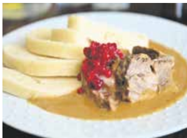
HOVĚZÍ SVÍČKOVÁ na smetaně, karlovarský knedlík