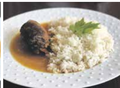
ŠPANĚLSKÝ PTÁČEK s klobásou, okurkou, slaninou, cibulí