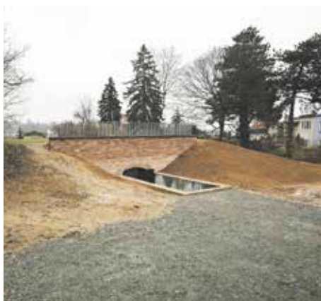
Magistrát informuje | Zpřístupnění vodojemů na Žlutém kopci je o krok blíž