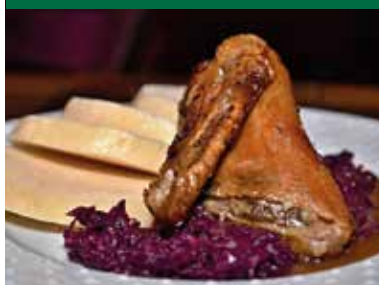
Čtvrtka pečené kačeny se zelím