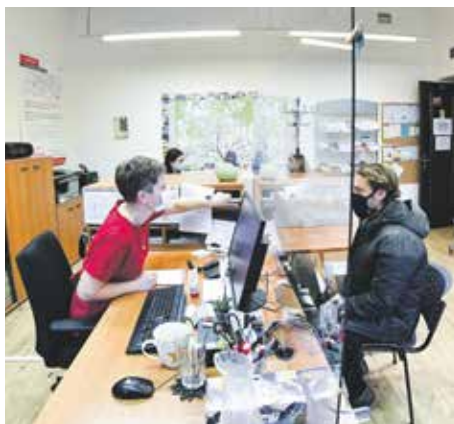
Téma | Socio Info Point poradí lidem v tíživé životní situaci

Milé čtenářky, vážení čtenáři, třídění odpadu vás zajímá. Lze to vysoudit z ohlasu, který vyvolal náš dvoudílný slovníček Manuál poctivého tříděče, který jsme otiskli v prosincovém a lednovém vydání. Pokud vám utekl, obě čísla si můžete přečíst nebo stáhnout na webových stránkách www.brno.cz v rubrice Brněnský metropolitán.