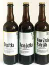
Prodej řemeslných pív v balení sklo, PET a KEG s možností zapůjčení výčepu