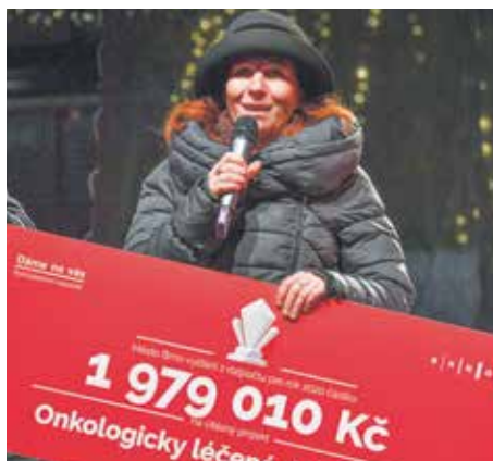
Magistrát informuje | Participativní rozpočet má čtrnáct vítězů