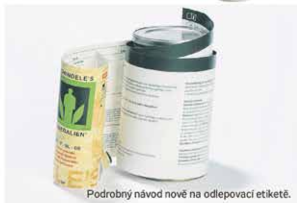
Podrobný návod nově na odleповací etiketě.