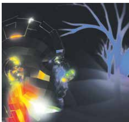
Aktuálně | Nová výstava ve VIDA! centru vtáhne do světa videoher