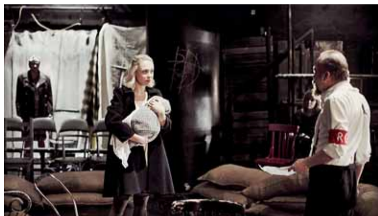
▲ Gertu vyhánějí z města. Diváci HaDivadla jsou toho svědky při reprízách hry Vyhánění Gerty Schnirch, nastudované podle stejnojmenného románu Kateřiny Tučkové. Příběh o jednom osudu zlomeném dějinami, o vině Čechů a Němců, o tom, zda je možno odpustit a porozumět, neztrácí už více než rok zájem publika. „Gerta je pro mě dokladem toho, jak mohou malý lidský osud převálcovat velké dějiny,“ řekla o hrdince své knihy autorka.