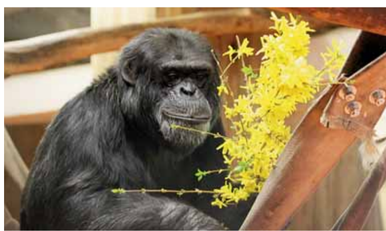
V příštím roce se chystá i úprava výběhu pro šimpanze.

Patrně největší změnou, která v zoo proběhne, je ale zavedení nekuřáckého prostředí. Pro ty, kteří si svůj koníček nedokážou odpírat, bude v areálu postupně vytvořeno až sedm míst, kde si mohou bez potíží zakouřit. Zoo se tím-