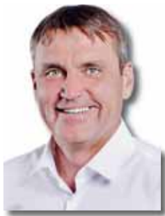
PETR VOKŘÁL primátor města Brna (ANO 2011)