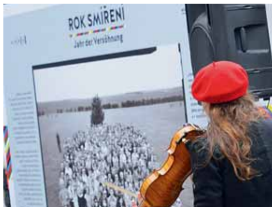
▲ Obří pohlednice poutníků. „Vyjadřujeme přání, aby všechny minulá křivdy mohly být odpuštěny a abychom se nezatížili minulostí a ve vzájemné spolupráci obraceli ke společné budoucnosti.“ Tento a další citáty z Deklarace smíření přijaté Zastupitelstvem města Brna 19. května si lze přečíst na výstavním objektu na křižovatce České a Solniční. Věvodí mu obří pohlednice se společnou fotografií všech poutníků, kteří se zúčastnili květnové Pouti smíření v Pohořelic do Brna.