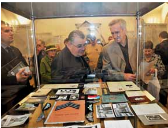
▲ Nikdy neustupovat zlu. Takové bylo krédo československých účastníků druhého a třetího odboje. I za cenu života se postavili nacistické totalitě a mnohým z těch, co přežili, pak komunistický režim místo úcty a vděku připravil věznění, popravu, exil a nucené zapomení. Přesto povstali jejich následovníci. O tom všem vyprávěla výstava Život ve stínu šibenice, která byla v Křížové chodbě Nové radnice zahájena v předvečer oslav 70. výročí konce druhé světové války. Vernisáží předcházela pietní akt v kostele sv. Michala.