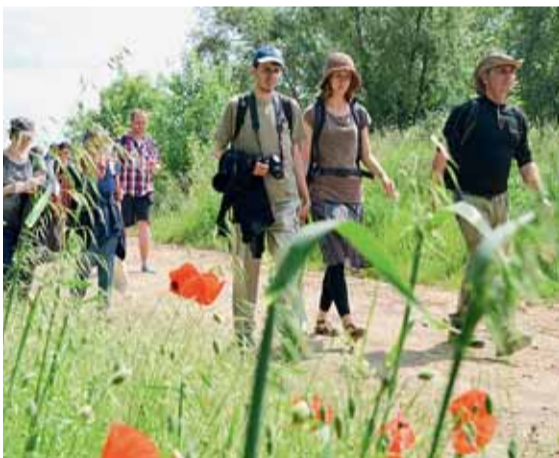
▲ Pouť smíření. 30. května se vypravila na cestu z Pohořelic do Brna početná skupina poutníků, aby tak symbolicky připomněla poválečný brněnský „pochod smrti“. V den 70. výročí události se však putovalo opačným směrem než v roce 1945, kdy se lidé museli shromáždit na Starém Brně a pod hlavními samopalů vykročit k rakouským hranicím. Nynější cestu zakončila ekumenická bohoslužba za smíření v opatství na Mendlově náměstí.