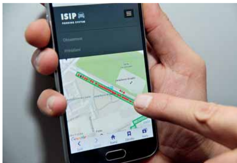
▲ Aplikace rezidentům ukáže, která místa jsou volná.

Návod k používání aplikace pro rezidenty dostali řidiči v minulých tý-