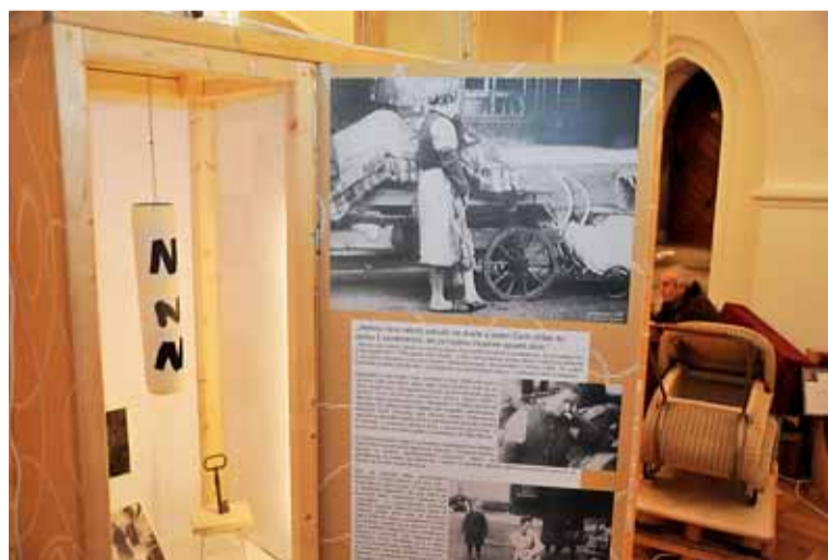
▲ Jak se žilo uprchlíkům. Do 10. ledna 2016 potrvá výstava Pomalu začalo být zase dobře, instalovaná na Staré radnici. Věnuje se osudům poválečných vyhnanců z Brna a jižní Moravy. Na audiovizuálních nahrávkách vyprávějí, jak přišli se svými rodiči do Rakouska a museli prosit o jídlo a hledat střechu nad hlavou či jak se pomalu a bolestně sžívali s novým prostředím. Prosincový program Roku smíření zahrnuje ještě např. Noc v galerii (10. prosince od 18 hodin v Místodržitelském paláci).

Fotostranu připravilo Tiskové středisko MMB