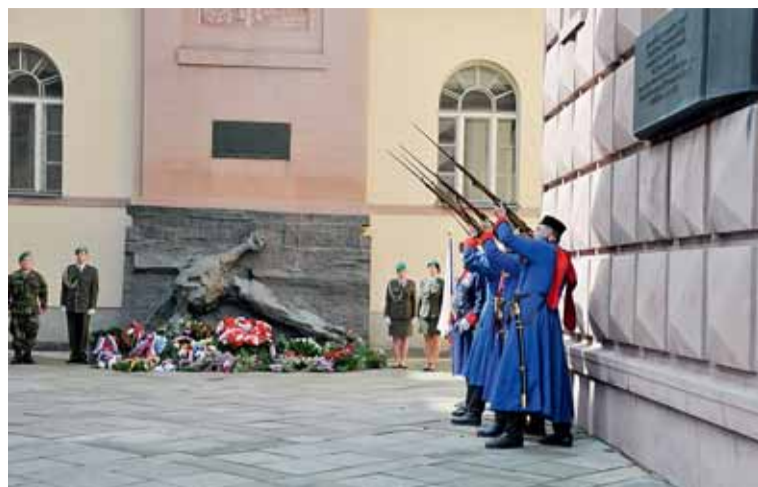
▲ Vzpomínka na smrt bestie. Definitivně zdechla před 70 lety, v Brně – jak se uvádí oficiálně – 26. dubna 1945. V severních částech města ale „plívá oheň“ ještě o týden déle. Památku padlých osvoboditelů i válečných obětí uctili na Ústředním hřbitově představitelé města, zástupci institucí a spolků i pamětníci. Utrpení mužů a žen vězňů v čase druhé světové války v Kounicových kolejích připomněl pietní akt 8. května.