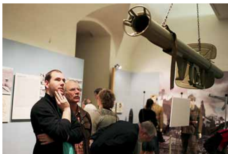
▲ Válečná vřava na Moravě. Výročí konce války a Rok smíření reflektuje také Moravské zemské muzeum. Do 3. ledna 2016 si mohou zájemci v Dietrichsteinském paláci prohlédnout výstavu Konec vlády hákového kříže – osvobození Moravy 1945, která se věnuje osvobozovacím bojům na Moravě a zvláště v Brně, ale také odsunu německého obyvatelstva. Přístupná je i komornější expozice Země vydává válečná svědectví o dosud trvajících nálezech zbytků bojové techniky, letadel i ostatků vojáků z obou stran válečného konfliktu.