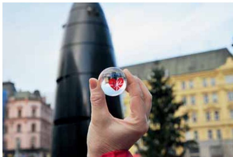
▲ Motiv vánočních skleněnek, které denně až do 23. prosince vypadávají každou hodinu z orloje na náměstí Svobody, navrhli studenti VUT.

Ve víkendových dílnách si děti vyrobí perníčky, ozdobí textil nebo upletou