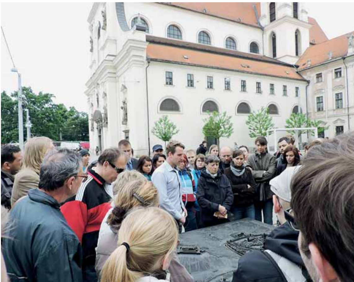
▲ Místa paměti. V dubnu vyšel knižní průvodce Místa Paměti národa. Obsahuje příběhy lidí i míst spjatých s důležitými událostmi českých dějin v období od rozhořvajícího se válečného konfliktu po první měsíce po konci druhé světové války. Pod názvem Místa paměti se pak v průběhu roku konalo několik komentovaných prohlídek lokalit spojených s nacistickým terorem a perzekucí židovského obyvatelstva či ulice Bratislavské a okolí.