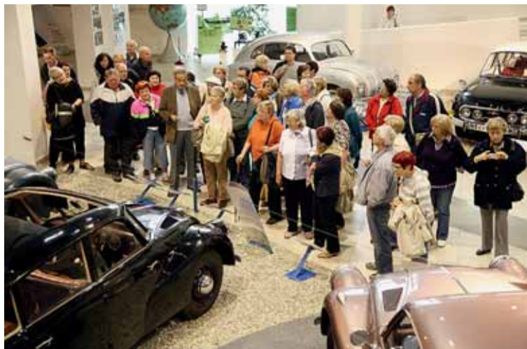
☐ Součástí „výuky“ na univerzitě třetího věku jsou i exkurze na zajímavá místa.

V akademickém roce 2015/2016 bude nově otevřen tříletý kurz Dějiny umění