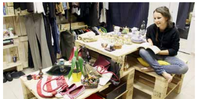
Charitativní obchod Šuplig.

„Naše kritika fungování policejní inspekce pomohla ke vzniku nezávislého orgánu – Generální inspekce bezpečnostních sborů. Ta ovšem vinou nekompetentního vedení a převzetí většiny zaměstnanců