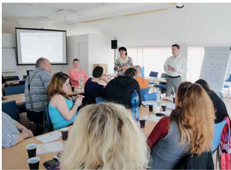
☑ Komunitní plán sociálních služeb na příští dva roky právě vzniká. Na snímku pracovní skupina zaměřená na rodiny.

Terénní služby pro seniory poskytují šest středisek pečovatelské služby při městských částech, která obslouží roč-