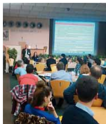
▲ Veřejná diskuse o Plánu mobility vzbudila zájem.

K analytické části Plánu mobility uspořádal Odbor dopravy MMB 24. března veřejnou diskusi, která se uskutečnila v Kanceláři veřejného ochránce práv. Zapojilo se do ní více než 120 účastníků z řad veřejnosti i odborníků. Týkala