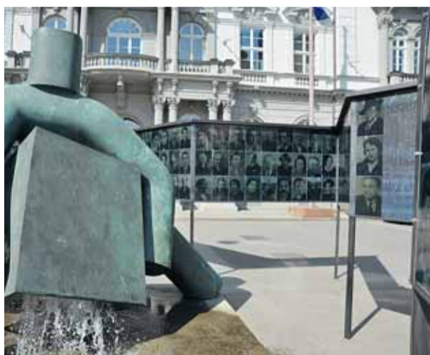
▲ Za portréty je třeba „podlézt“ dovnitř hvězdy.

Židovská kultura přes 800 let spoluvytvářela a obohacovala tvář města Brna i celé Moravy. V roce 1941 žilo na území protektorátu přes 88 tisíc židovských obyvatel, z toho v Brně více než 11 tisíc. Do konce války bylo jen z Brna deportováno do Terezína a Minsku asi 10 ti-