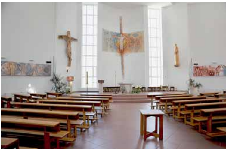
☐ Světlém prostoupené duchovní prostředí salesiánského kostela umocňují freska a obrazy od Milivoje Husáka.

V 60. letech oratoř vyhořela, v nepoškozených částech budovy pak působila hudební škola a v „Akci Z“ byla v areálu vybudována ještě mateřská škola.