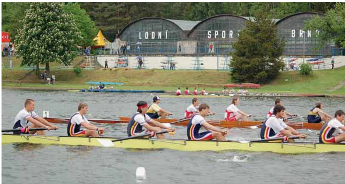
Na závodech bude startovat přes 600 veslařských nadějí z Česka i zahraničí.

Brněnská regata je zařazena do kalendáře Mezinárodní veslařské federace FISA, což je také známkou její kvality. Je i jedním ze sedmi kol vrcholné domácí soutěže družstev, tedy Českého poháru ve veslování. Z tohoto důvo-