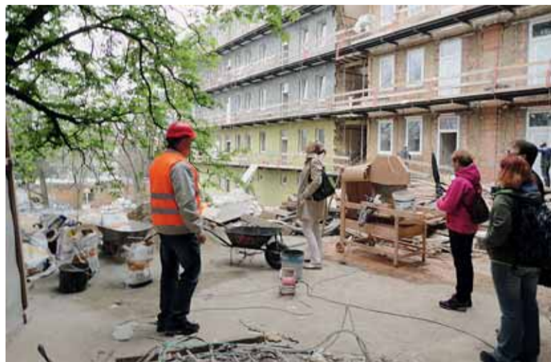
Rekonstrukce domu na Francouzské. Město tu bude mít k dispozici 39 opravených bytových jednotek určených zejména pro rodiny v bytové nouzi.

První projekt podobného typu vzniká – opět za spolupráce bytového odboru a odboru sociální péče magistrátu – na ulici Zámečnické, kde adaptací rozsáhlého prostoru vznikne velký byt s devíti samostatnými pokoji, společným sociálním zázemím, kuchyní a oby-