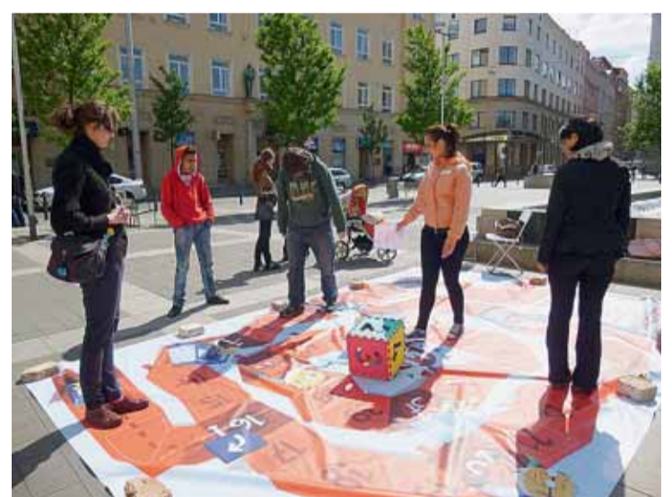
Loňské Mezigenerační odpoledne na Moravském náměstí. To letošně se koná v parku u Šelepovy ulice.

Kompletní program najdete na webu www.tydenmesta.cz . (zug)