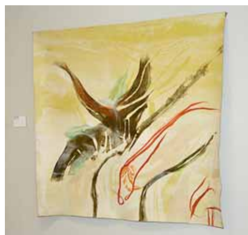
☐ Dílo výtvarnice mohly obdivovat i návštěvníci výstavy Brno – moravský Manchester v Uměleckoprůmyslovém muzeu.

► Pište na adresu Brněnský Metropolitan, Magistrát města Brna, Husova 12, 601 67 Brno, e-mailem na adresu vasickova.jana@brno.cz nebo pošlete SMS zprávy se správnou odpovědí na telefonní číslo 602 770 466.