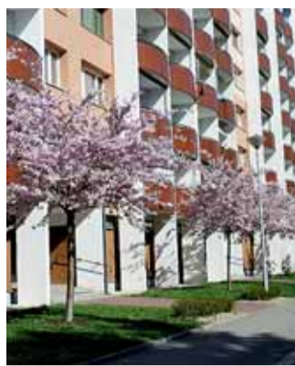
Na Ježkově na Lesné rozkvetly sakury a podél silnice Okružní byly vysázeny záhony narcisů. Je to nádhera, nádhera.