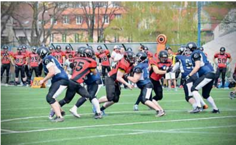
Brno Pitbulls versus Prague Mustangs.

Mužské týmy už svoji sezónu zahájily. Aligátoři, hrající nejvyšší domácí