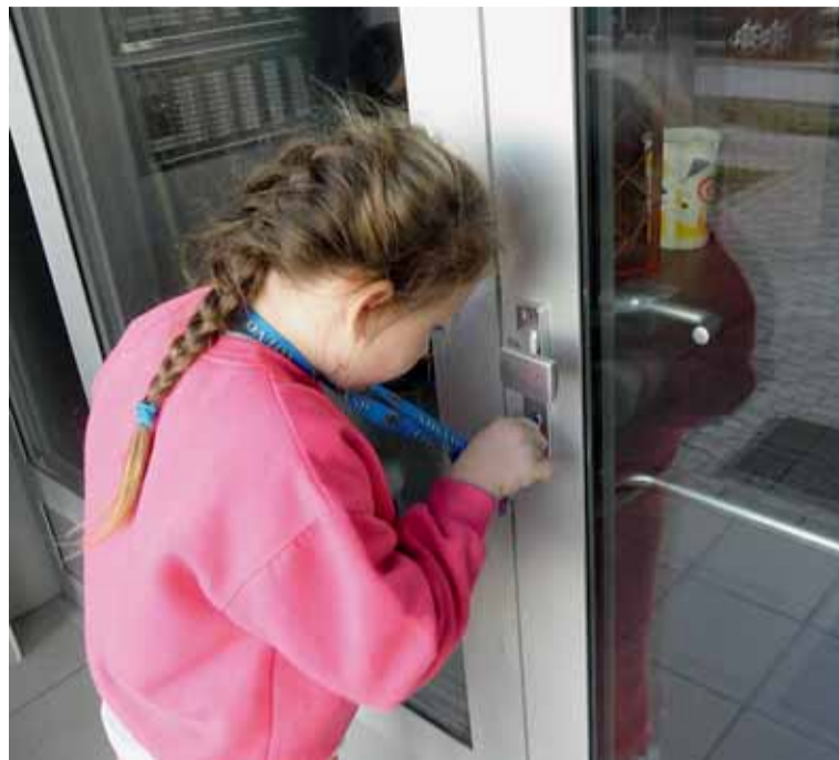
Myšlenka na výuku domovníků se zrodila v tomto domě na Konikleově 5. Tam bylo ustanovení domovníka vedle zřízení kamer či klubovny jedním z kroků ke zklidnění napjaté sociální situace.

Bude optimálně zapojovat nevládní a zájmové organizace, ale i seniory a zástupce sociálních, etnických a národnostních menšin a využívat jejich