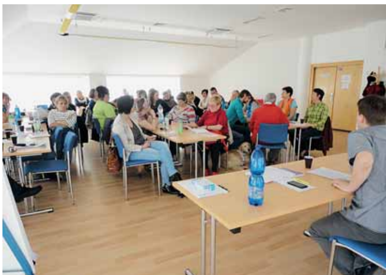
☑ Komunitní plánování do rozhodování o podobě sociálních služeb zahrnuje politiky, úředníky, poskytovatele, uživatele i veřejnost.

V posledních 10 letech se v sociální oblasti v Brně uplatňuje metoda komunitního plánování, která do rozhodování o podobě sociálních služeb zahrnuje všechny, jichž se tyto služby nějak dotýkají – politici, úředníci, poskytovatele, uživatelé i zainteresovanou veřejnost (proto název komunitní).