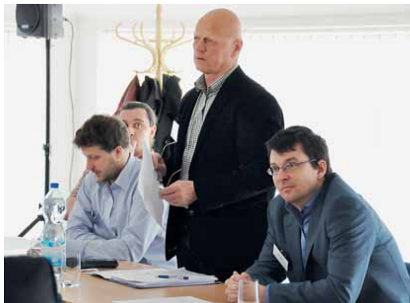
Sociální vyloučení je třeba řešit komplexně, shodli se účastníci setkání 19. března.

Dvoustranu připravil Odbor sociální péče MMB