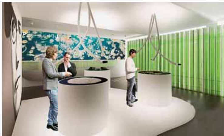
Expozice Brna a Jihomoravského kraje. Vizualizace: Chybič+Kristof Associated Architects

I talské velkoměsto Milán se pro následujících šest měsíců stane hostitelem světové výstavy EXPO 2015 zaměřené na klíčové otázky udržitelného rozvoje. Mezi 146 účastníky nechybí Česká republika. Brno se od 17. května předvede dvoutýdenní expozicí v českém pavilonu jako centrum výzkumu a inovací.