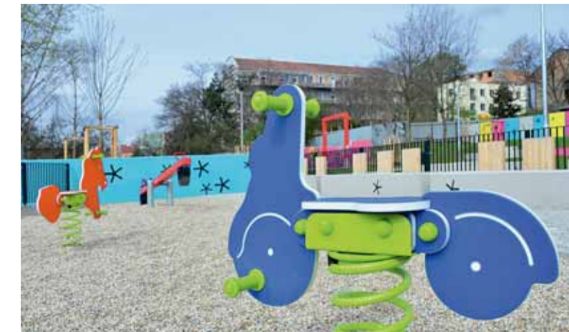
Park Hvězdička před rekonstrukcí a po ní. Zanedbaná plocha se proměnila v přívětivé prostranství s herními prvky i posezením.