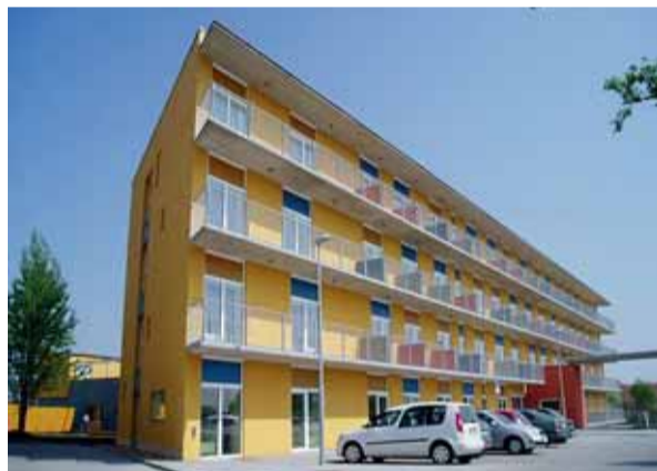
Domov pro seniory na Holásecké v Tuřanech.

V současnosti se buduje organizační struktura procesu tvorby tohoto plánu. Bude