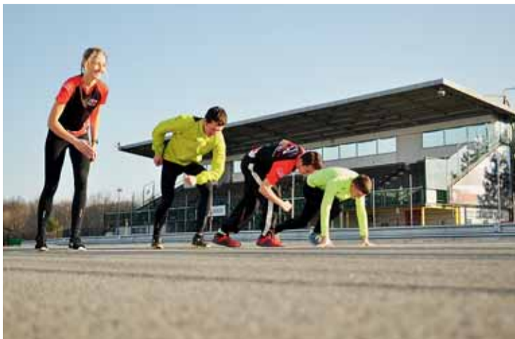
▣ Závěrečné stoupání prověří kondici všech závodníků.

Zázemí tak sportovci budou mít přímo v boxech okruhu, bezplatné parkování bude zajištěno v paddocku. Držitel nejrychlejšího času na jedno kolo, tedy 5403 metrů, bude rovněž zapsán do tabulky traťových rekordů okruhu