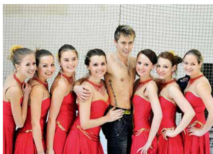
Vítězek z benefice poputuje dětem ze speciálních škol.

Do krasohaly přijedou jako hosté i Dáda Patrasová a Felix Slováček, tradiční účastníci benefiční akce. Druhá část odpoledne bude karnevalová: vítě-