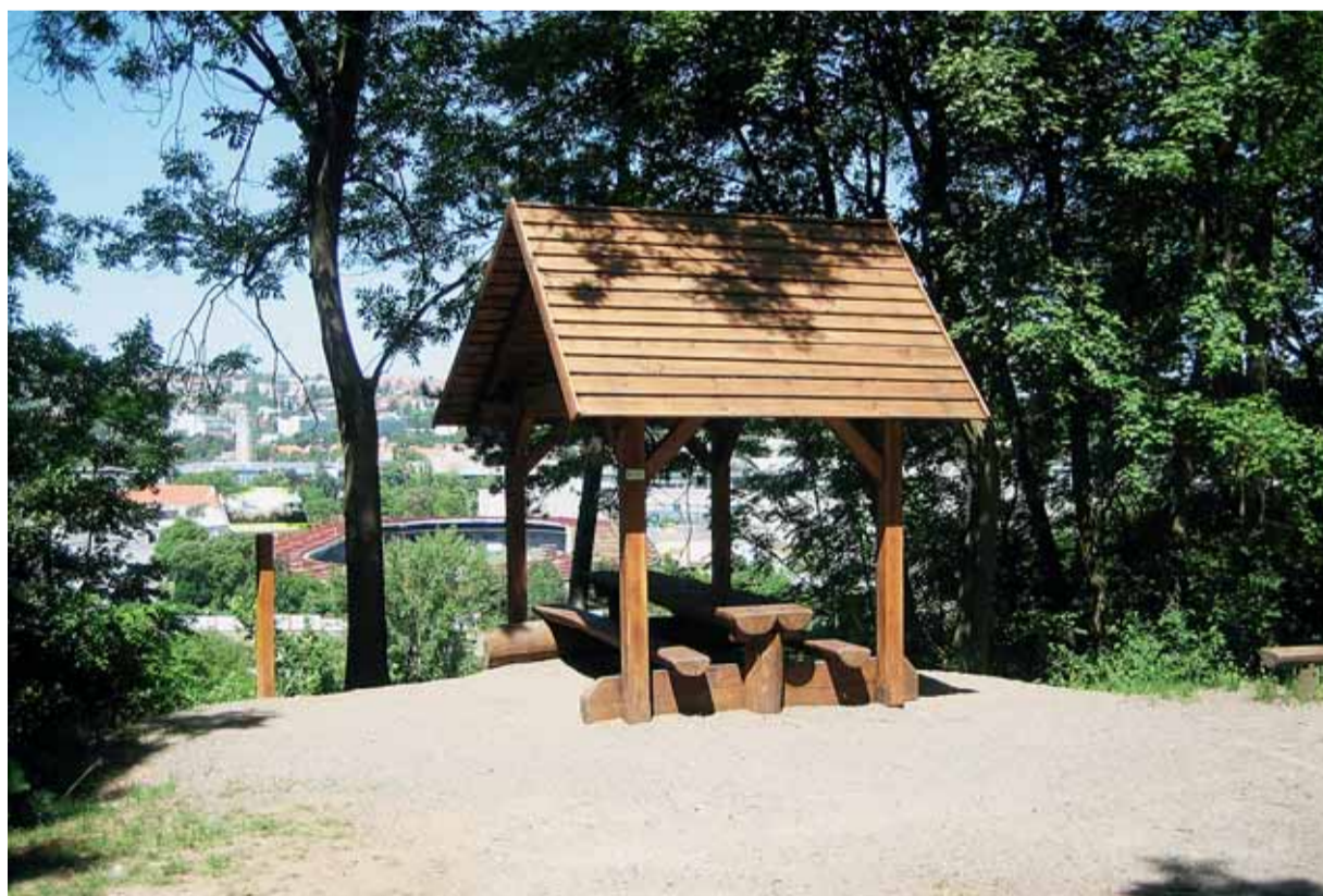
▲ Altánek na Červeném kopci.

Součástí lesních porostů spravovaných Lesy města Brna je i několik chráněných