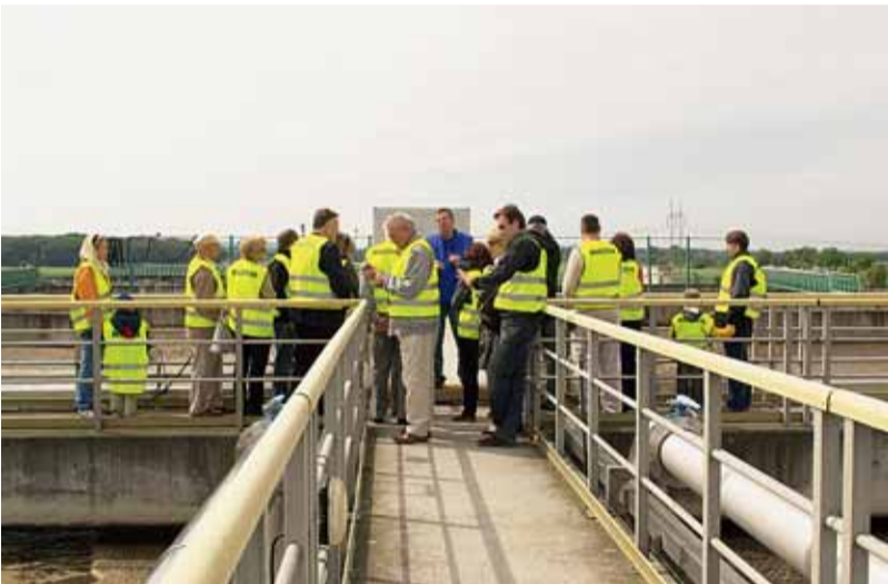
▲ Den otevřených dveří v ČOV Brno – Modřice.

Od roku 1872, kdy byla uvedena do provozu úpravná voda v Pisárkách, již několik generací vodohospodářů zajišťuje pro obyvatele Brna a jeho okolí pitnou vodu. Akciová společnost Brněnské vodárny a kanalizace byla založena v roce 1992 a město v ní má více než 50procentní majetkovou účast.