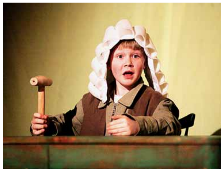
První inscenací byla starobrněnská pověst Baron Trenck.