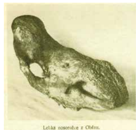
Lebka nosorožce z Obřan.