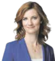
Markéta Vaňková primátorka města Brna, Společně – ODS a TOP 09

Milé Brňanky, milí Brňané, statistika možná nuda je, ale čtení závěrečné zprávy průzkumu kulturních potřeb Brňanů nikoliv. Reprezentativní vzorek totiž má skutečně cenné údaje, na co se zaměřit a kde co zlepšit.