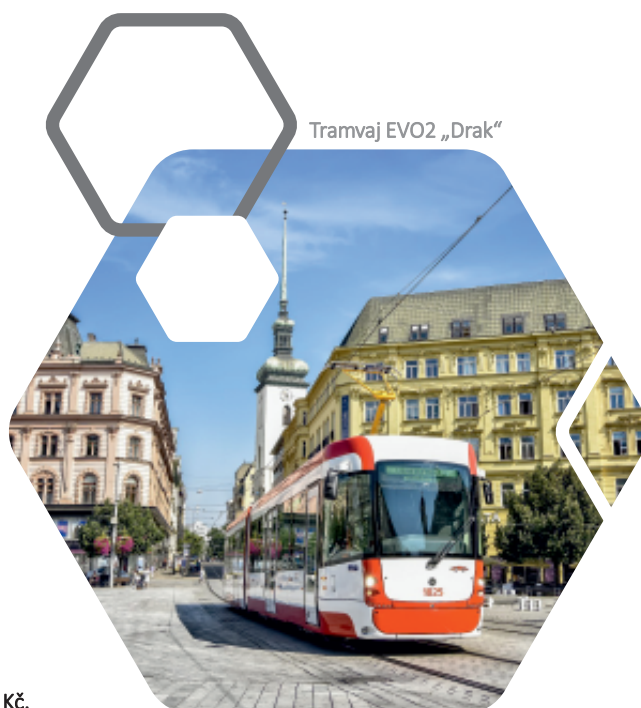
Tramvaj EVO2 „Drak“

Celkové náklady na nákup trolejbusů: 1 168,7 mil. Kč , z toho z fondů EU: 468 mil Kč .