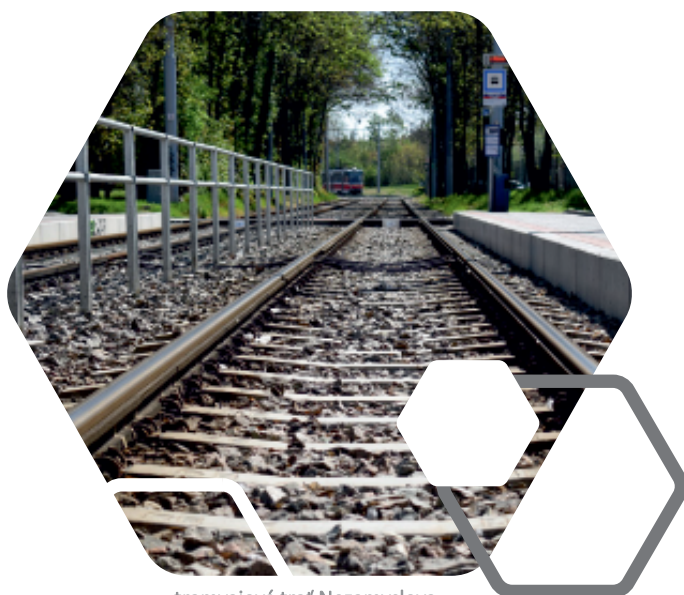
tramvajová trať Nezamyslova

Měnična Páteřní celkové náklady: 53 mil. Kč