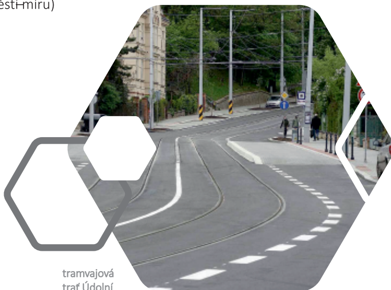
tramvajová trať Údolní