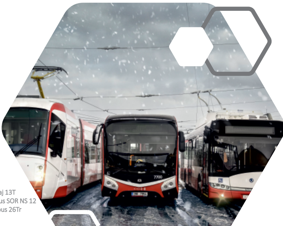
tramvaj 13T autobus SOR NS 12 trolejbus 26Tr

Z toho dotace ze zdrojů EU činily 2,3 miliardy Kč .