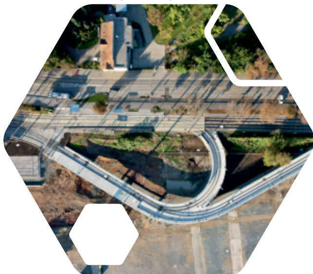
vratná smyčka Pisárky, ARENA BRNO

Modernizace tramvajové tratě při ulici Obvodová (úsek zastávka ZOO-smyčka Rakovecká) v rámci modernizace tramvajové trati byl mimo jiné zrealizován nový systém trolejového vedení tzv. řetězovka, který umožňuje vyšší rychlost celkové náklady: 144 mil. Kč (z fondů EU: 116,3 mil. Kč)