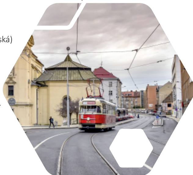
tramvajová trať Zábrdovická

Měnírna Netroufalky celkové náklady: 59 mil. Kč (z fondů EU: 40 mil. Kč)