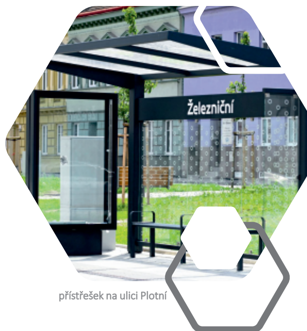
přístřešek na ulici Plotní

Kabelové trasy: V období 2018-2025 bylo v rámci investičních akcí zrekonstruováno nebo nově založeno více než 9,3 km kabelových tras v celkové částce téměř 221 mil. Kč .