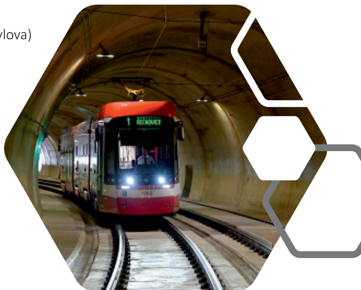
Tramvajový tunel Žabovřeská

Nová trolejbusová trať Jedovnická celkové náklady: 35,5 mil. Kč