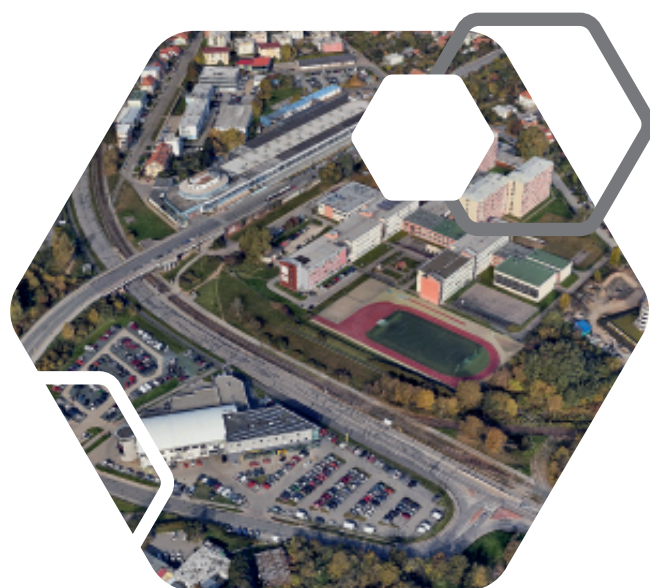
tramvajová trať Kníničská

předpokládaná cena 120 mil. Kč náklady určí zadávací řízení