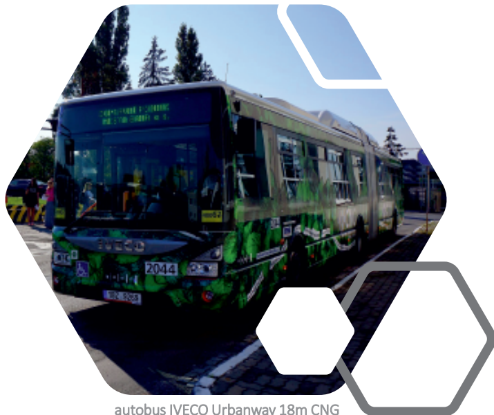
autobus IVECO Urbanway 18m CNG

Celkové náklady na nákup autobusů: 1 211,1 mil. Kč , z toho z fondů EU: 241 mil. Kč .