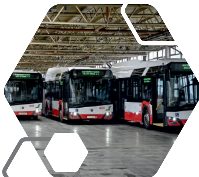
trolejbusy Škoda 27Tr