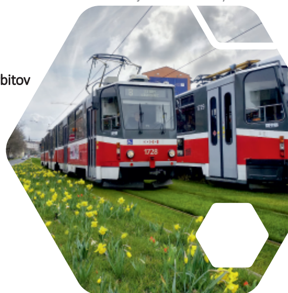
tramvajová trať Nové sady

Měnírna Královo pole celkové náklady: 61 mil. Kč