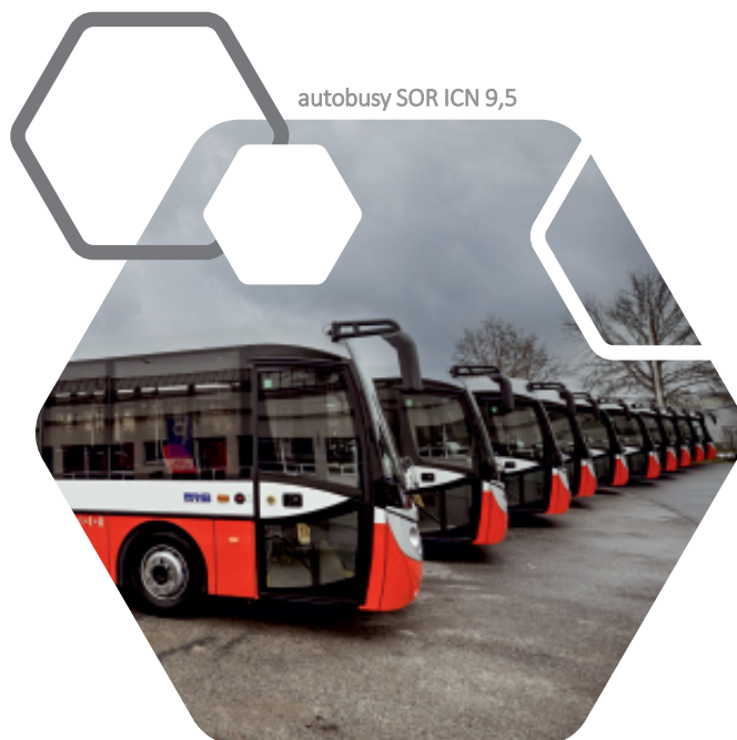
autobusy SOR ICN 9,5

Celkové investiční náklady do vozidel MHD za období 2018-2026 dosahují výše 6,9 miliardy Kč .