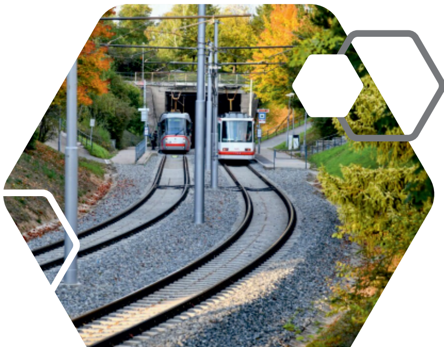
tramvajová trať Krematorium – Švermova

a ze zdrojů statutárního města Brna 1,58 miliardy Kč .