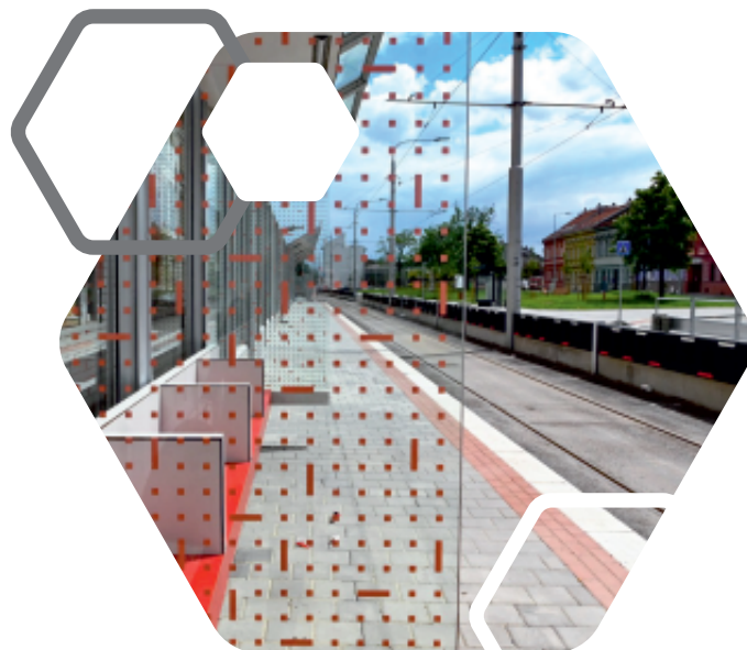
tramvajová trať Plotní

Rekonstrukce tramvajové tratě Krematorium – Osová celkové náklady: 115 mil. Kč