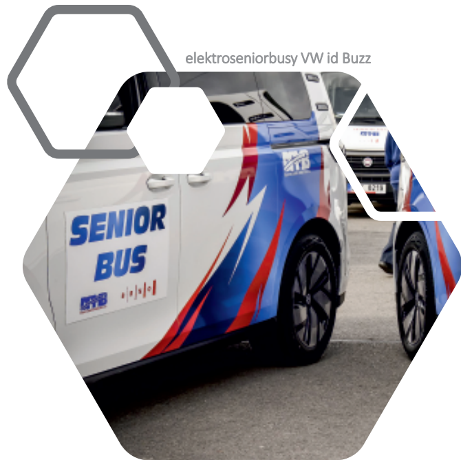
elektroseniorbusy VW id Buzz

Náklady na pořízení vozů pro službu Seniorbus činily celkem 6,3 mil. Kč