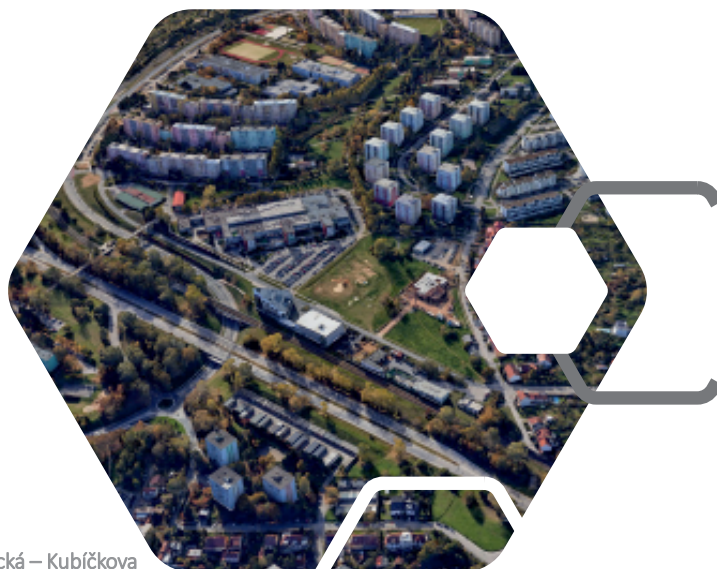
tramvajová trať Rakovecká – Kubíčková

předpokládaná cena 42 mil. Kč náklady určí zadávací řízení