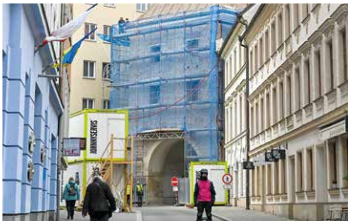
Měniňská brána prochází od loňska kompletní rekonstrukcí.

Radka Loukotová