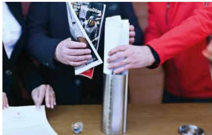
Naši následovníci se z obsahu za desítky let dozví, jak vypadal život v Brně v roce 2026.