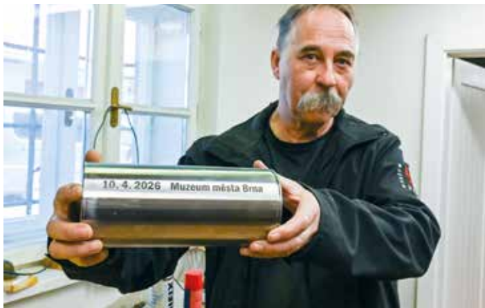
Při posledních opravách před 50 lety do makovice žádná časová schránka umístěna nebyla, teď ano.