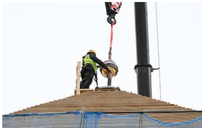
V dubnu 2026 se na vršek kupole vrátila zlatá makovice.