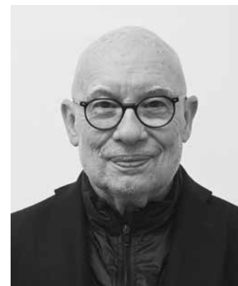
Mezinárodní spolupráce města Brna Dennis Russell Davies

Přes výrazně omezenou hybnost nohou se věnuje závodnímu plavání. Získala bronz na mistrovství světa 2023 a tři bronzy na mistrovství Evropy 2024. Závodila také na letní paralympiádě v Paříži. Umístila se v top ten českého parasportu za rok 2023.