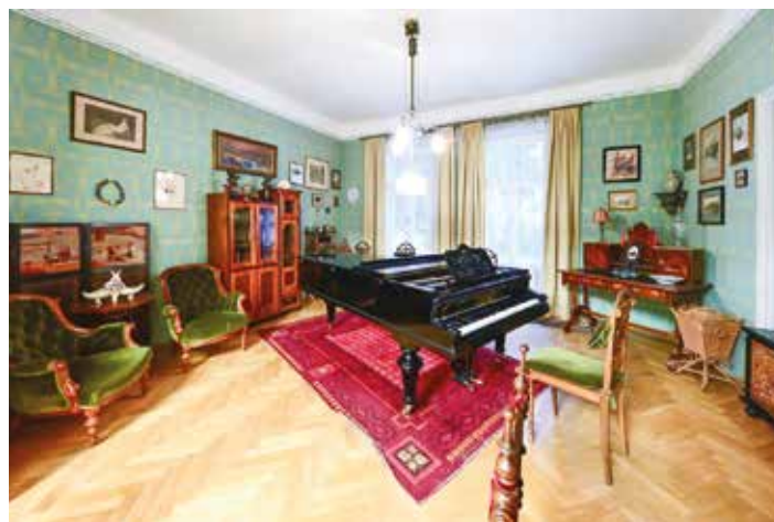
Janáčkova pracovna s klavírem