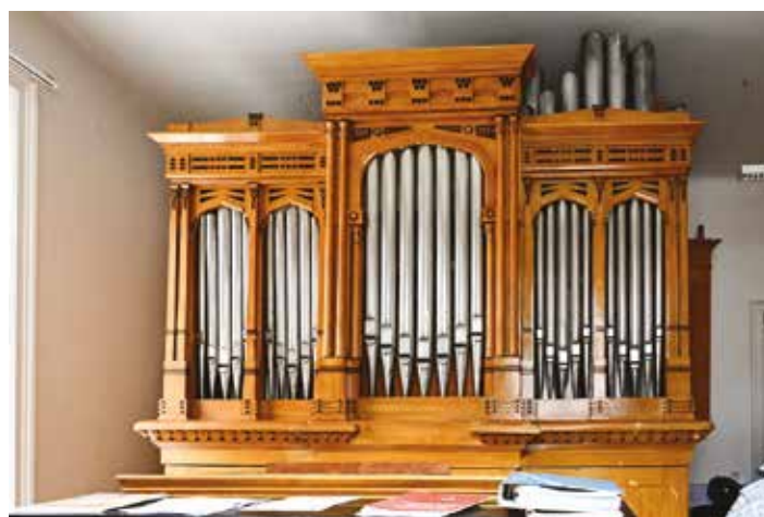
Varhany Leoše Janáčka