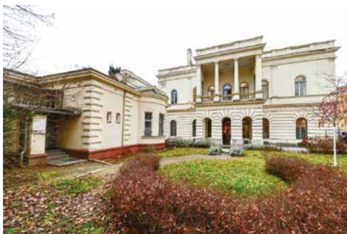
Chleborádova vila a zahradní domek (vlevo)

Radka Loukotová