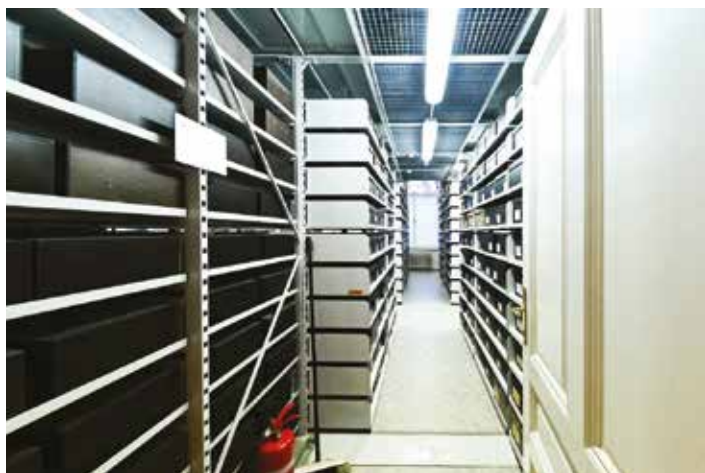
Janáčekův hudební archiv (součást UNESCO)