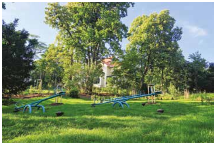
Zahrada Arnoldovy vily