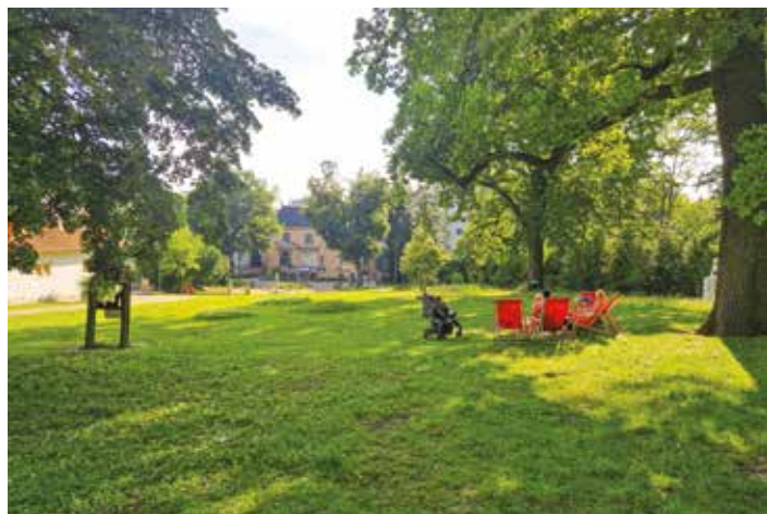
Zahrada vily Löw-Beer