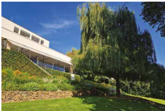
Zahrada vily Tugendhat